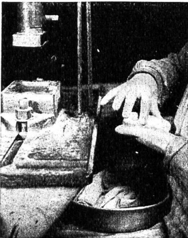
Blinde formen und pressen Seifenstücke.

Arbeit bietet ihnen schönste Befriedigung; sie verbindet sie mit dem Leben des Lichts und der Farben, und sie reiht sie als vollwertige, gleichberechtigte Bürger in die menschliche Gesellschaft ein.