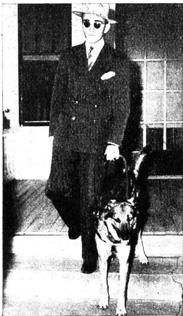
Die Hunde sind die besten Freunde ihrer blinden Meister. In Amerika nennt man sie das „sehende Auge des Blinden“.

Die Blinden aber vermögen die Augen nicht nach fünf Minuten zu öffnen. Sie müssen immer in ihrer Nacht verharren, in jener finsternen Einsamkeit, die sie wie eine Mauer von jenem Leben trennt, das die sehenden Menschen führen. Sind sie darum dem Leben verloren? – Nein, man tut alles, um Tausende von Menschen, die entweder blind geboren wurden oder durch Krieg, Krankheit oder Unglücksfall ihr Augenlicht verloren haben, dem Leben wiederzugeben. In Amerika ist man zum Beispiel dazu übergegangen, den Blinden sogenannte „sehende Augen“ zu verschaffen, das heisst, man richtet besondere Blindenhunde für sie ab, die ihren Meistern bei allen Gelegen-