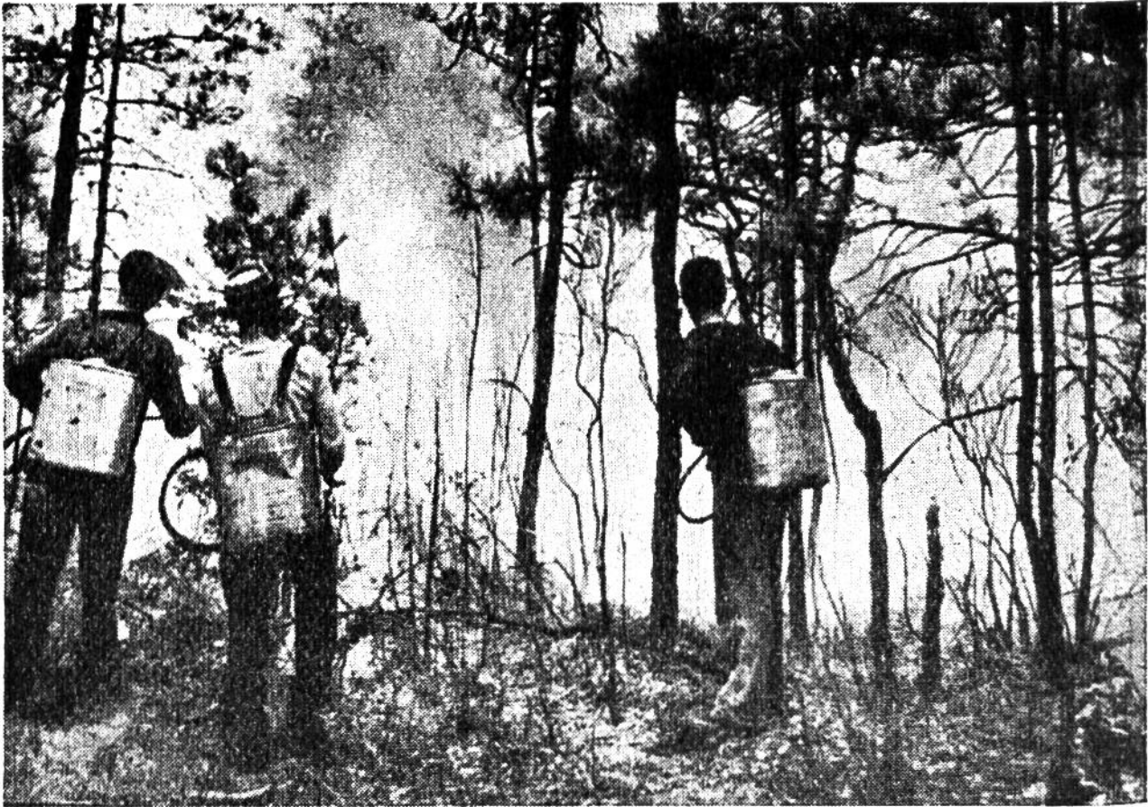
Löscheimer mit Pumpvorrichtung, wie sie bei uns zum Bespritzen der Reben benutzt werden.

ten der zwölf einzelnen Bezirke, lässt sich die peinlich umgrenzten Gefahrengebiete melden, erteilt Befehle, bestimmt Marschrichtung der Mannschaften und Anrollwege der Löschwagen.