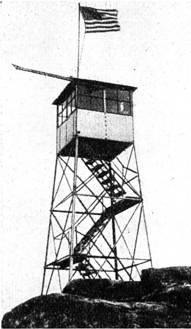
Hoch über den Waldgebieten steht der Beobachtungsturm.

von bewaldeten Hängen. Vielfach trägt der Mensch durch Unachtsamkeit und Leichtsinn an der Entstehung des Brandes die Schuld, vielfach ein Blitzstrahl, oft aber entzündeten sich Gras und Laub in drückend heisser Luft von selbst. Wie gewaltig an Ausmass sind erst die Brände, welche sich in Gegenden ausdehnen können, wo weder Gestein noch Bäche noch der Zugriff der Menschen dem vernichtenden Werk des Feuers Einhalt gebieten können!