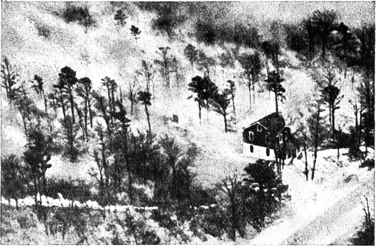
Kein harmloses Gemälde: eine durch Waldbrand verursachte Katastrophe!

baren Spezialeimern spritzen. Bäume werden gefällt, Sperrgräben ausgehoben – vielerlei harte Arbeiten, die in kürzester Frist und oft in schwelendem Rauch, in Hitze und Lebensgefahr verrichtet werden müssen.