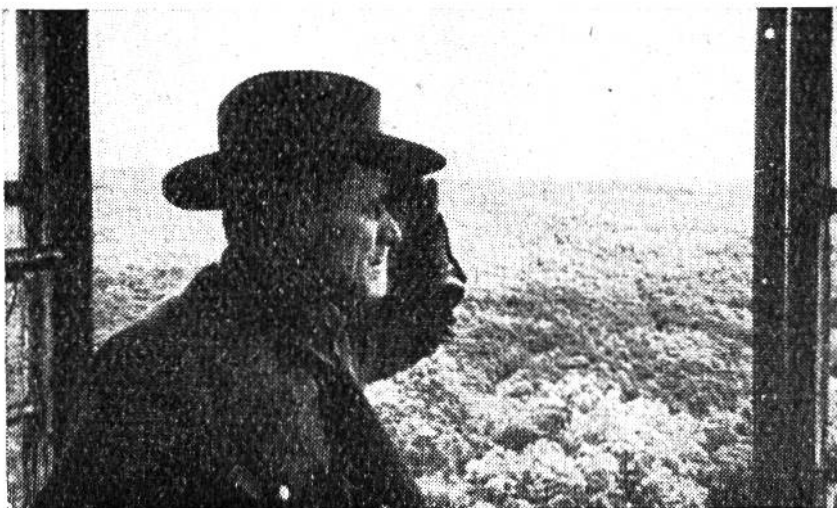
Das kleinste Rauchwölkchen macht den Feuerwächter stutzig.

und, unmittelbar nach Feststellung eines Brandherdes, ganzer Einsatz zwecks Begrenzung und Erstickung des Brandes. So ist beispielsweise in den riesigen Waldbezirken des Staates