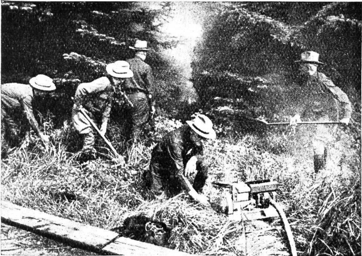
Das nachlässig gelöschte Touristenfeuer könnte einen Waldbrand verursachen!

New York eine Feuerwehrorganisation ins Leben gerufen worden, welche die nahezu 30 000 qkm Wald – in der Ausdehnung von drei Vierteln der Schweiz! – Minute für Minute genauestens und ausschliesslich in bezug auf Feuersgefahr zu überwachen hat. Das Zentralbüro der Waldfeuerwehr steht durch ein ausgedehntes Telephonnetz mit rund hundert Beobachtungstürmen in Verbindung, auf denen wetterharte und mutige Männer Ausschau halten und nicht nur bereit sind, Feuermeldungen durch Radio und Telephon nach der Zentrale des Distriktförsters weiterzugeben, sondern auch dessen Anordnungen zur Bekämpfung eines ausgebrochenen Brandes entgegenzunehmen.