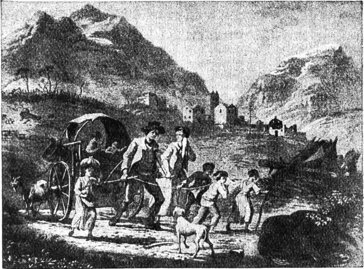
Die verarmten Familien retteten ihr blosses Leben.

Unter Alois Reding schlugen sie gegen den Franzosen Schauenburg los. Nach heldenhaftem Kampf mussten sich die Schwyzer den allerdings milden Bedingungen unterwerfen; in Nidwalden jedoch flammte der Widerstand von neuem auf und führte zum Schreckenstag vom 9. September 1798. Schwer wurde die sich hartnäckig wehrende Talschaft für ihr freiheitliches Unterfangen bestraft: an die 400 Menschen, darunter über 100 Frauen und Kinder, fanden den Tod; ihre Heimstätten wurden niedergebrannt, ihre Felder verwüstet, ihr Gut geraubt. Obdachlos irrten verwaiste Kinder umher und suchten Unterkunft, Hilfe und Trost. Derjenige aber, der diesen unglücklichen und unschuldigen Opfern wütender Rachelust in Stans ein Heim bot, der ihnen bei eigener Armut ein Vater, Lehrer und dienender Knecht wurde, war kein anderer als der noch heute verehrte Vorkämpfer der Menschlichkeit und der Namengeber unseres Kalenders: Johann Heinrich Pestalozzi.