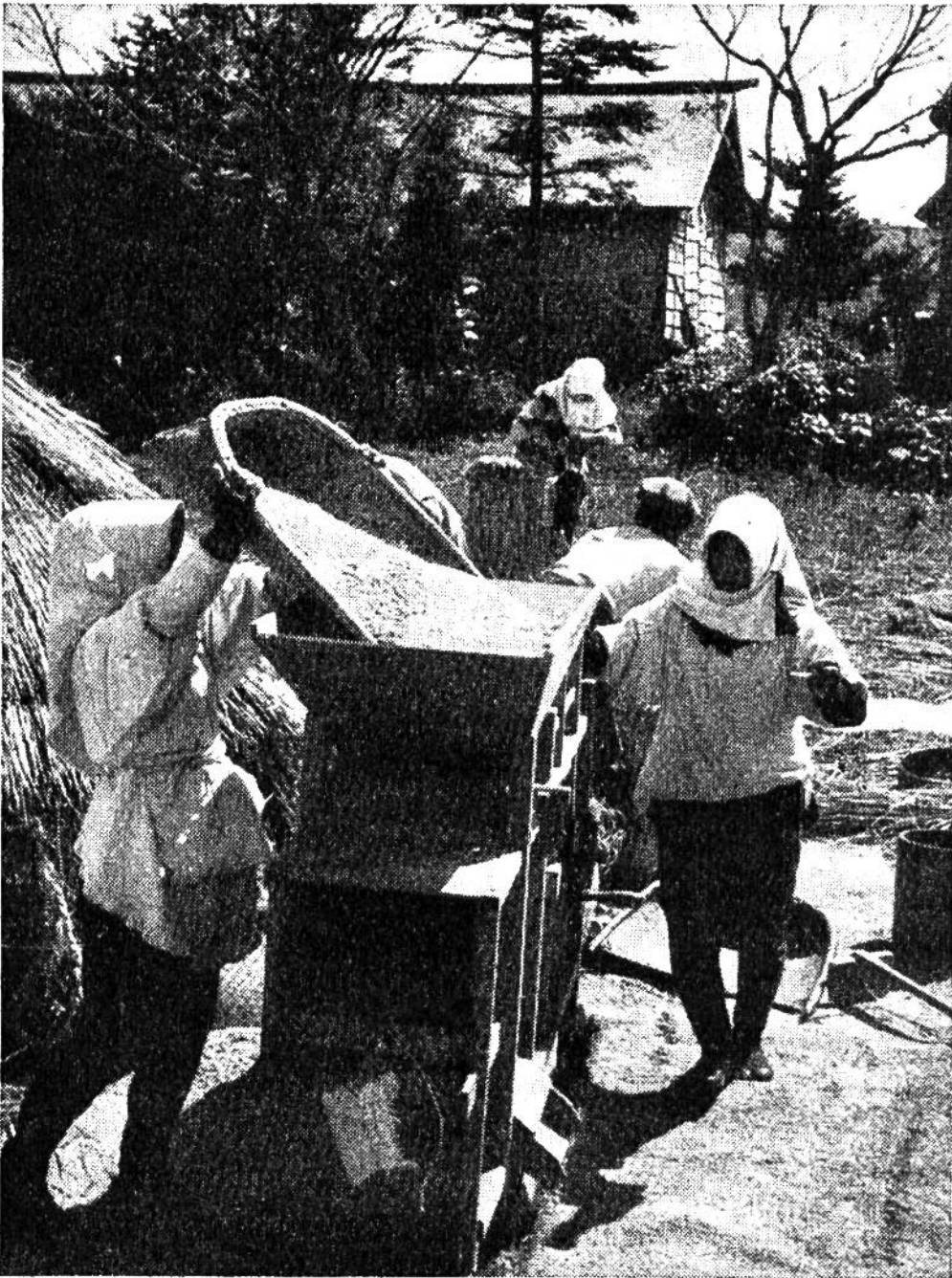
Erntezeit. Das Getreide wird in einer modernen Windfege gereinigt.

Eine weitere Eigenart der japanischen Landwirtschaft ist das Fehlen einer Grossviehzucht nach europäischen Begriffen. Auf den Kleinbauernhöfen braucht man meist nicht einmal Zugtiere. Hacke, Spaten und Sichel sind, heute wie vor vielen hundert Jahren, die wichtigsten Werkzeuge des japanischen Bauern. Die von den Japanern betriebene Landwirtschaft gleicht einem intensiven Gartenbaubetrieb. Da oft kleinste Flächen für die Ernährung einer Familie ausreichen müssen, stehen meistens auch genügend eigene und billige Arbeits-