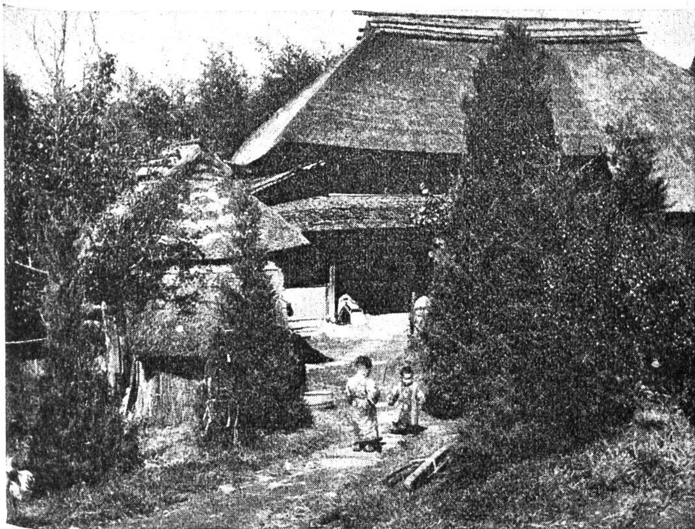
Spielende Kinder vor einem japanischen Kleinbauerngehöft.