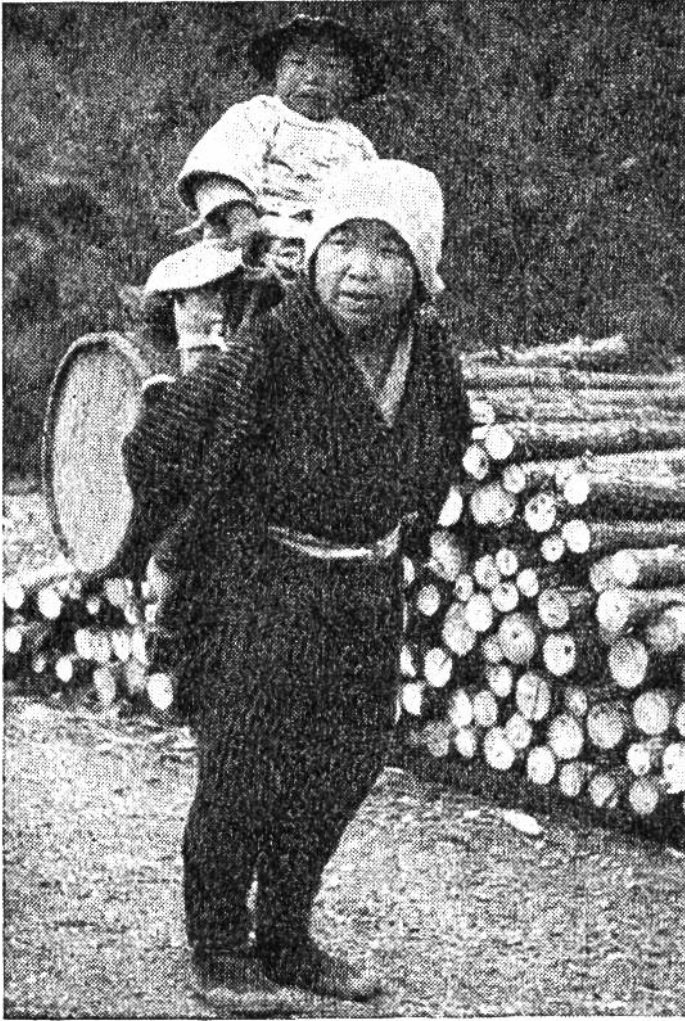
Japanische Bäuerin mit Traglast und Kind.