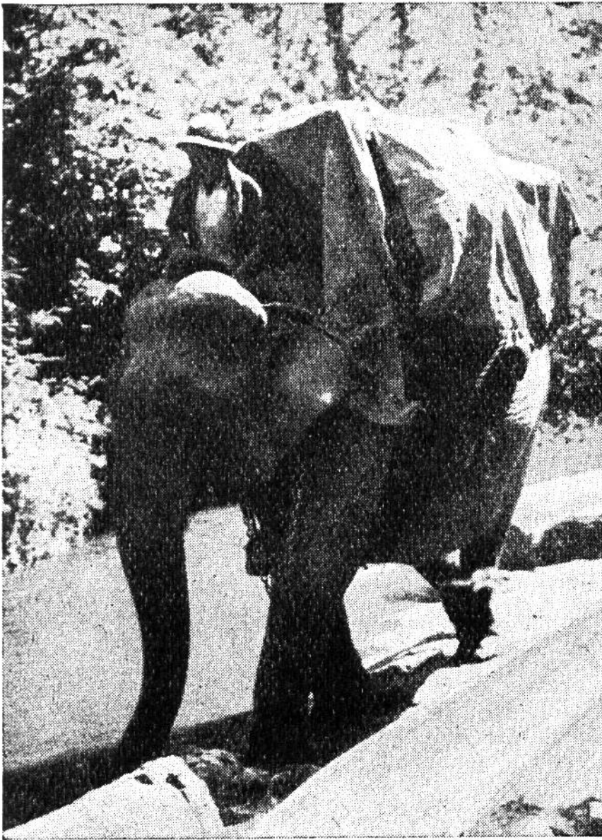
Auch als gewöhnliches Lasttier leistet der Arbeitselefant hervorragende Dienste.

wenn auch in Afrika, namentlich im belgischen Kongo, die Abrichtung afrikanischer Elefanten, die irrtümlich als unzähmbar gegolten haben, von den massgebenden Behörden nach Möglichkeit gefördert wird. Für die Dressur und die Behandlung des u. a. an seinen grossen Ohren kenntlichen Afrikaners liegt allerdings noch kein so grosser Reichtum an Erfahrungen vor wie für diejenige seines indischen Bruders. Auch über die Zucht der afrikanischen Art weiss man gegenwärtig noch wenig Bescheid, ist es doch ausserhalb ihres Kontinentes bisher erst ein einziges Mal gelungen, Nachwuchs zu erhalten, während junge indische Elefanten schon oft in europäischen und amerikanischen Tiergärten geboren wurden. Wohl hat man seit Hannibals Zeiten und vermutlich schon