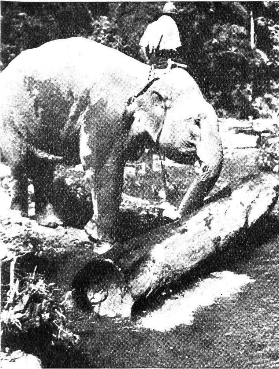
Der kostbare Teakholzstamm wird stückweise in den Fluss gerollt.

und Strom versinkt. Vor allem ist der abgerichtete Elefant ein grossartiges Werkzeug der Forstwirtschaft, das beim Fällen, Entlauben, Transportieren und Zersägen der gewaltigen Baumstämme, besonders des kostbaren Teakholzes, in Indien dem Menschen unschätzbare Dienste leistet. Hinzu kommt noch, dass diese riesenhafte Universalmaschine in der Regel Selbstversorger ist; der Arbeitselefant verpflegt sich vielerorts während seiner Freizeit im Urwald, falls dieser nicht zu weit von der Arbeitsstätte entfernt ist. Es werden ferner bei diesem wertvollen Helfer des Menschen so gut wie nie „Reparaturen“ benötigt, was man ja von Motorfahrzeugen nicht immer behaupten kann. Bei guter Behandlung erfreuen sich die Elefanten im allgemeinen einer ausgezeichneten