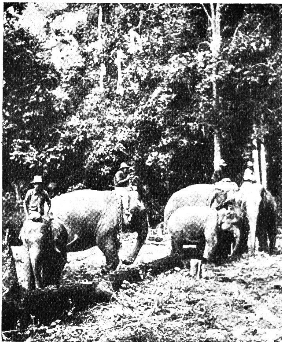
Indische Arbeitselefanten bereiten einen frischgefallenen Teakholzstamm zum Abtransport vor.