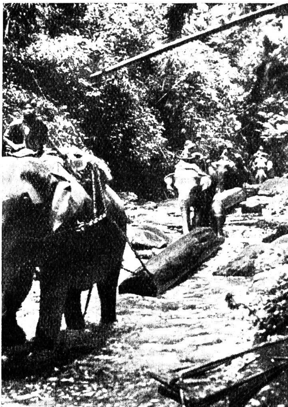
Der Elefant braucht keine Strassen. Die Stämme werden im Fluss geschleppt, bis ein richtiges Flößen möglich ist.

Gesundheit und einer langen Lebensdauer. Allerdings werden sie nicht Hunderte von Jahren alt, wie man früher glaubte, aber 40–50 Jahre sind doch – an einem Auto gemessen – gewiss schon ein recht schönes Alter!