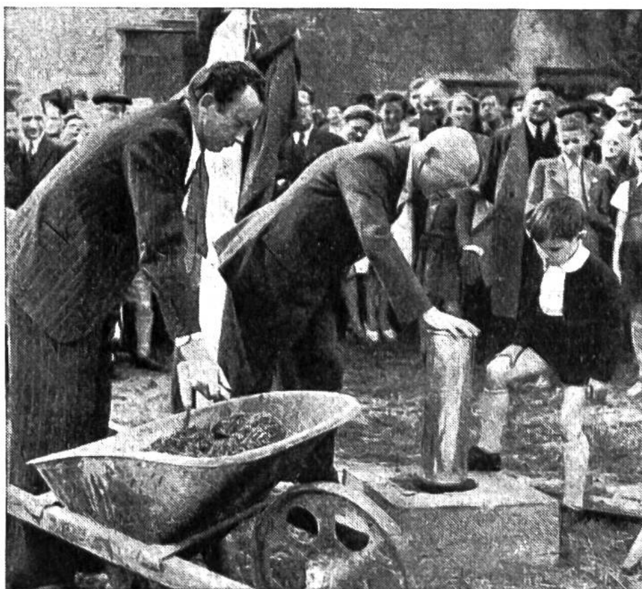
Am 28. April 1946 fand in Trogen die Grundsteinlegung des Kinderdorfes statt. Die Büchse mit historischen Dokumenten wird in den Grundstein eingemauert.

schau und im Mai 1946 heben jugendliche Freiwillige in Trogen die Erde für die in der ersten Bauetappe vorgesehenen Kinderhäuser aus. Die Stiftung Pro Juventute sammelt Geld und Naturalien; es ist eine Aktion, welche die Begeisterung grosser Kreise der Bevölkerung findet. Vor allem stellt sich die Jugend ein, die sich spontan anbietet, die mitbauen und mithelfen will.