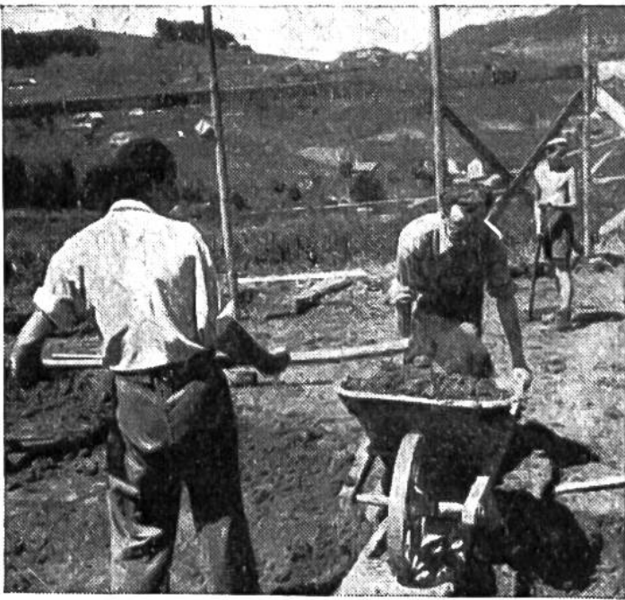
Junge freiwillige Helfer beim Ausheben der Baugrube.

Die Kinder dieses Dorfes sollen so erzogen werden, dass sie später nicht als Entwurzelte in ihre Heimat zurückkehren; deshalb schafft man sogenannte nationale Weiler, einen französischen, polnischen, ungarischen, holländischen und so fort, je nach Bedarf. Es gibt also kleine Kolonien, in denen die Kinder wohl im übernationalen Geiste Pestalozzis, aber in