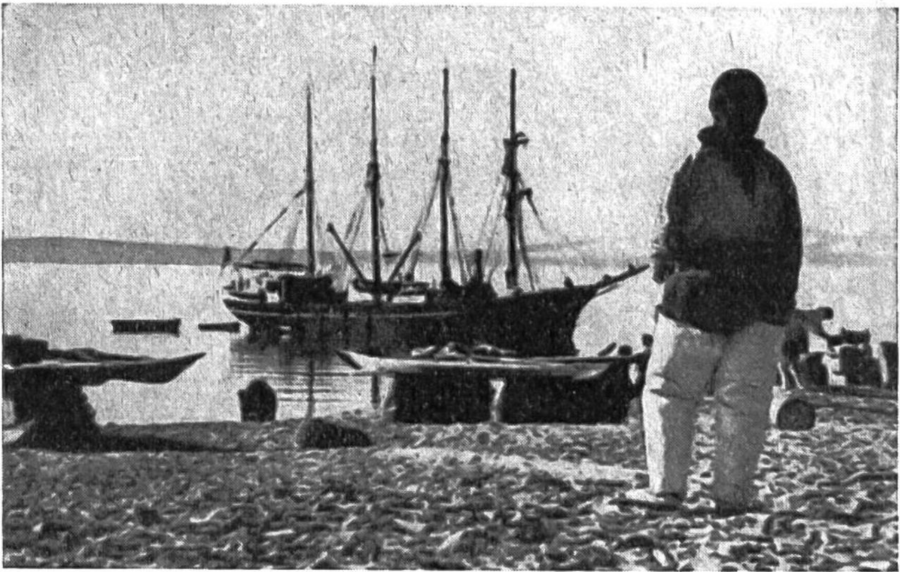
Die für die Eskimos wichtigen Lebensgüter werden ausgeladen.

sen einer der wildesten Schneestürme der dunklen Polarnacht tobt. In diesem einzigen Raum sitzen sie entblößten Oberkörpers beim Tranlicht und schmausen nach Herzenslust. Uns würde es wohl weniger munden; denn ihre Vorliebe für alle Arten rohen Fleisches, gefroren oder halbgefroren, entspricht nicht unseren Sitten. Auch erscheint es uns nicht gerade appetitlich, dass sie sich beim Essen der blossen Hände und eines eigenartigen Messers bedienen, mit dem sie die Bissen des mit den Zähnen gehaltenen Fleisches knapp vor den Lippen abschneiden. Die Eskimos besitzen, in primitiver Weise natürlich, einen ausgesprochenen Sinn für Musik, der sie befähigt, als eigene Komponisten und Dichter aufzutreten und sich auf einer Art kleiner Trommel geschickt zu begleiten.