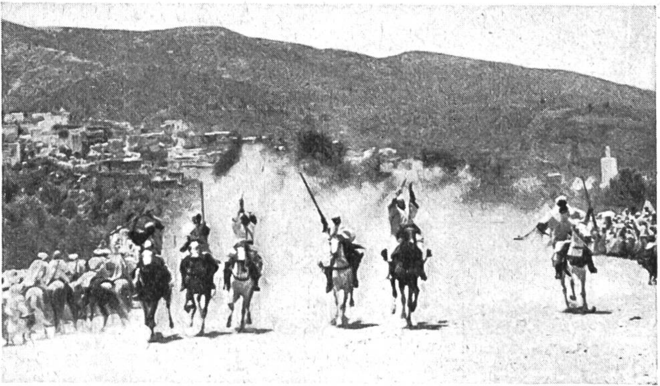
Die Fantasia ist in vollem Gange; eben sprengt wieder eine Reihe der zahlreichen Reiter im Galopp über den in der grellsten Sonne liegenden Platz.

halten. Aus dem ganzen Lande erscheinen die Söhne der verschiedenen Stämme mit ihren besten Pferden. Eine gewaltige Zeltstadt entsteht am Atlashang, und mit kaum zu zügelnder Ungeduld warten die stolzen Reiter auf den Beginn des Festes. Grosse Zuschauermengen, lauter Mohammedaner, haben sich versammelt, und die Wasserträger mit ihren tropfenden Schläuchen aus langhaarigen Ziegenfellen machen gute Geschäfte, indem sie die kostbare Flüssigkeit schalenweise an die vielen Durstigen ausschenken.