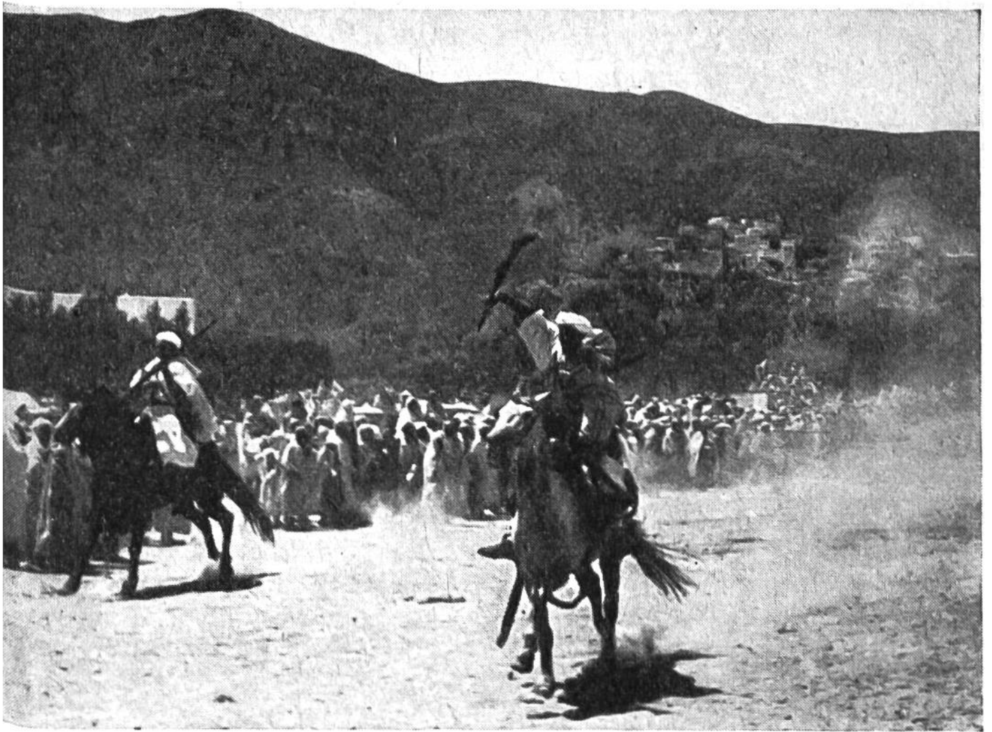
Mit sicherem Griff hat der Reiter das herunterfallende Gewehr aufgefangen. Im Hintergrund die heilige Stadt Moulay Idris.