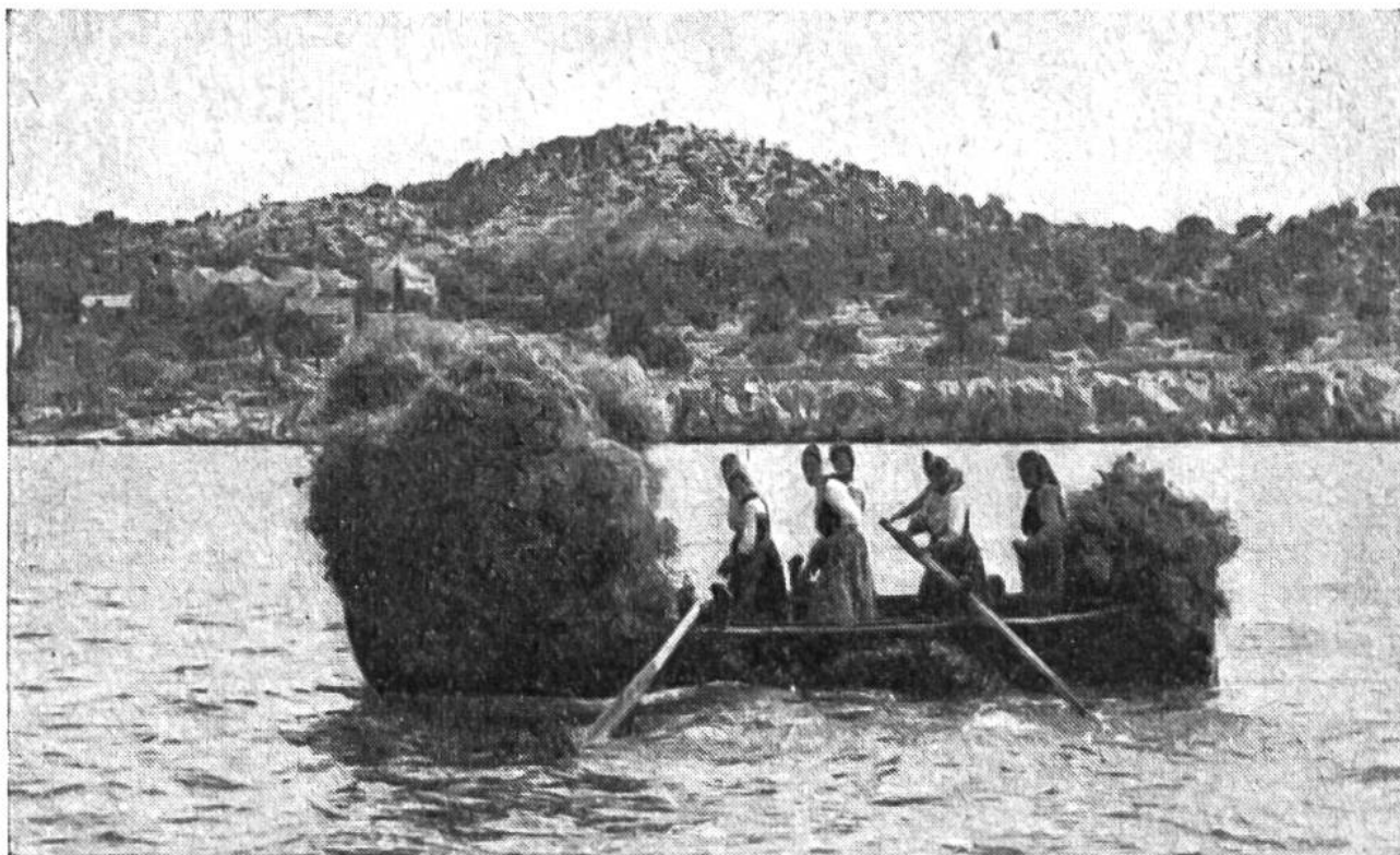
Die dalmatinische Insel Krapany ist an Futter für die Haustiere so arm, dass die Frauen das Heu vom Festland herüberra- dern müssen.

sie die Herden der Schafe, unter sengender Sonne flicken sie die Fischernetze, auf halbtägiger Uferwanderung tragen sie die bescheidenen Ernten ihrer kümmerlichen Gärten zu Markt. Bei der mühsam verdienten Nahrung von Brot, Wein und Fischen wahrlich eine bewundernswerte Pflichterfüllung, welche die Frauen Dalmatiens mit Frohsinn und Grazie zu bewältigen verstehen!