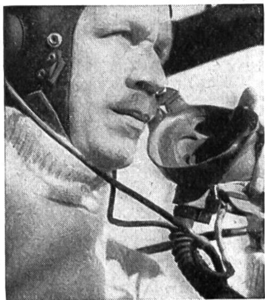
Ein Teilnehmer am Flug in die nördlichen Polargebiete mit dem Sauerstoffgerät für die Atmung in grossen Höhen.

interessantes Erlebnis hatte der Funker dieser Expedition: er war beim Überfliegen des Pols der erste Radio-Operator der Welt, der bei der Anpeilung das Ergebnis „Null-null-null“ erhielt.