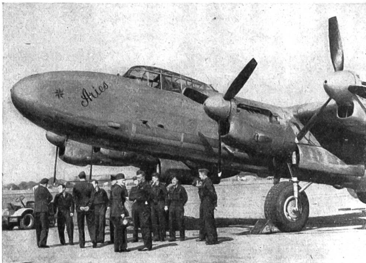
Das englische Flugzeug „Aries“ mit seiner Besatzung. Es ist für Flüge in die Polargebiete besonders ausgerüstet.

interessantes Erlebnis hatte der Funker dieser Expedition: er war beim Überfliegen des Pols der erste Radio-Operator der Welt, der bei der Anpeilung das Ergebnis „Null-null-null“ erhielt.