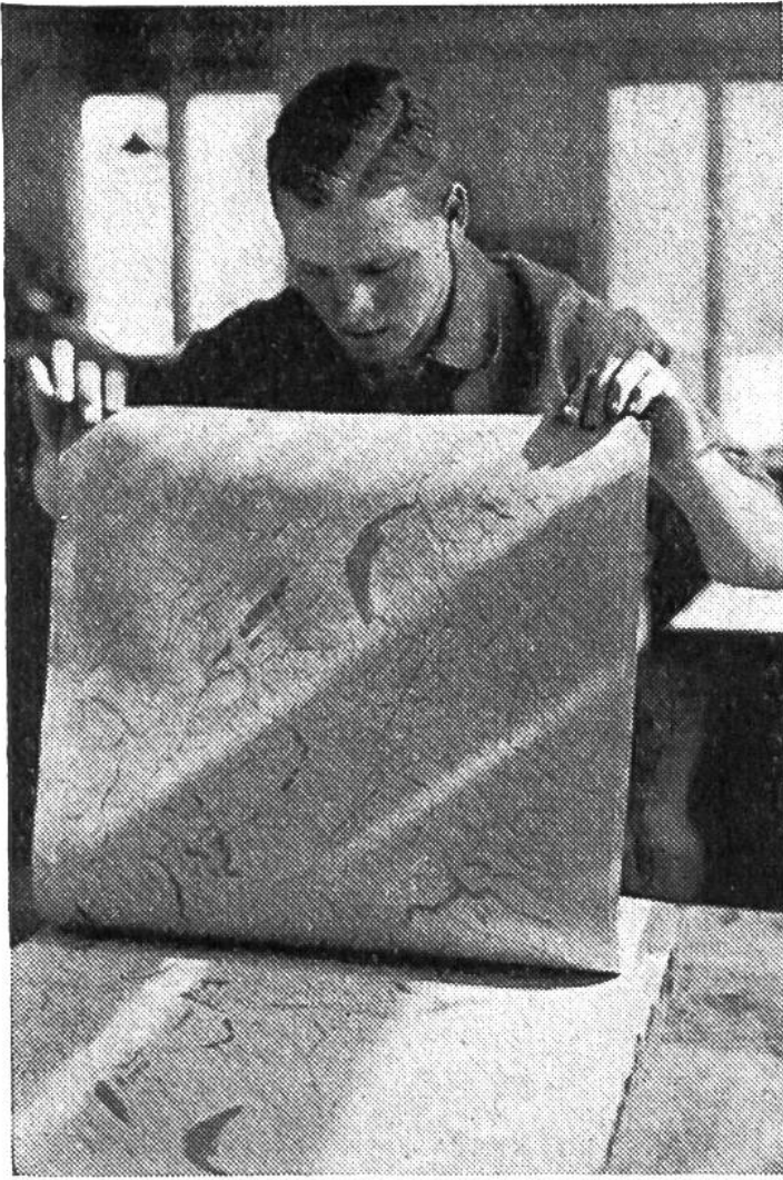
Der Umdrucker erstellt einen Umdruck auf die Druckplatte.

den mit spitzen Stahlnadeln eingeritzt; man nennt dies gravieren oder stechen. Die Farbtöne, aus denen das Relief, z. B. die Darstellung der Berge auf den Schulwandkarten, besteht, werden mit fetter Lithographiekreide aufgetragen und die Flächen, welche die politische Einteilung (Kantone oder Staaten) kennzeichnen, mit dem Pinsel aufgemalt.