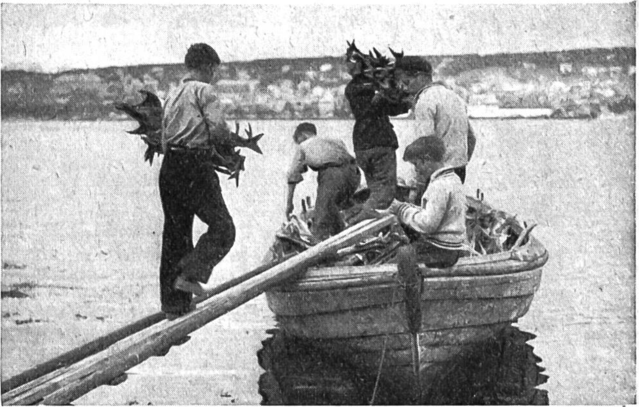
Die dürren Dorsche werden verladen und als Stockfische in der Stadt verkauft.

Schweiz vorkommt, jedoch nur von wenigen Kennern geschätzt und gegessen wird. Äusserlich kommt diese nahe Verwandtschaft zwischen Kabeljau und Trüsche z.B. darin zum Ausdruck, dass beide am Kinn einen einzelnen, nach vorn gerichteten Bartfaden tragen.