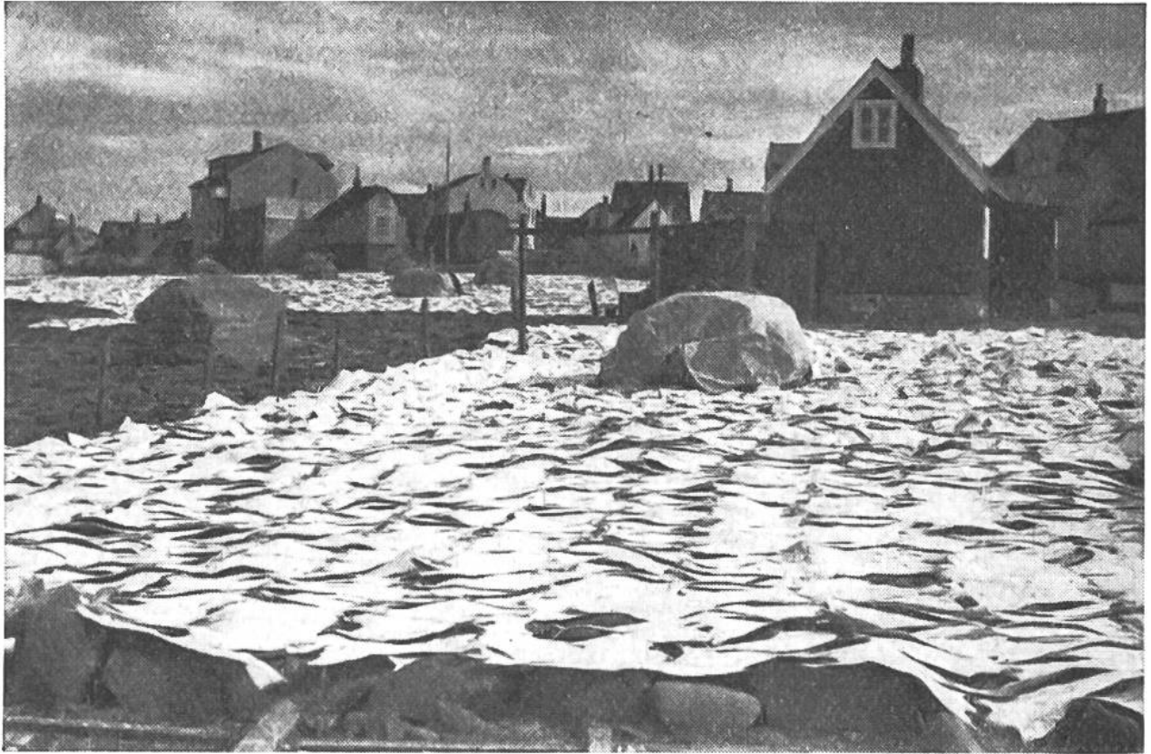
Bei der Verarbeitung der Dorsche zu Klippfischen werden die Fischkörper nicht gespalten, sondern nur geschlitzt, auseinandergelegt und in der Sonne auf Steinen ausgebreitet.