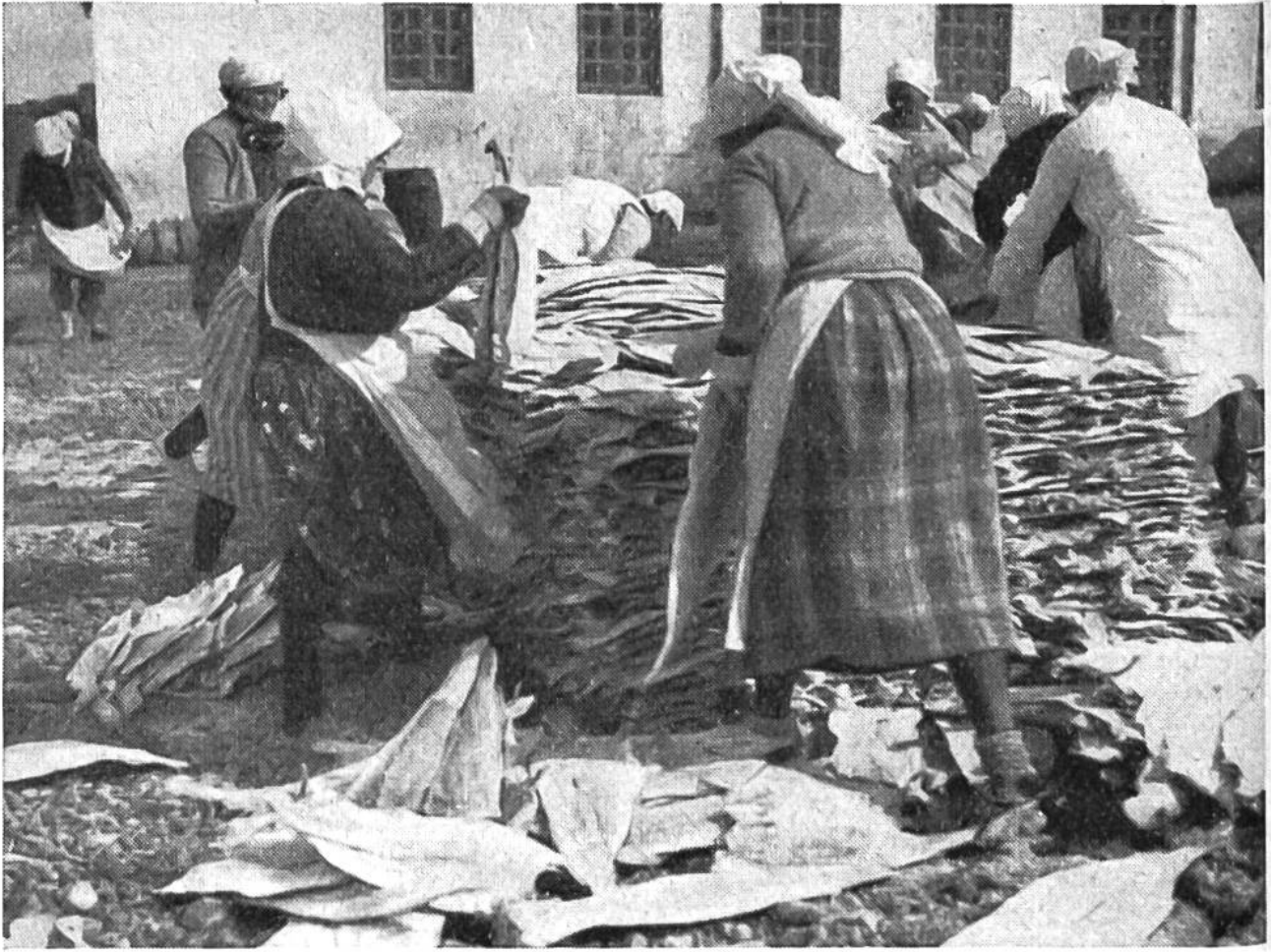
Die getrockneten Klippfische werden auf Haufen gelegt und zum Versand vorbereitet.

und der Länge nach gespalten worden ist, in riesiger Anzahl auf grossen Gestellen zum Trocknen aufgehängt und gelangt später als Stockfisch in den Handel. Erst wenn die Gestelle voll behangen sind, setzt gewöhnlich die Herstellung von Klippfischen ein. Die dazu bestimmten Fische werden nur auf der Bauchseite aufgeschnitten, gesalzen, aber nicht zum Trocknen aufgehängt, sondern auf Steinen ausgelegt. Wenn die Fische richtig dürr sind, werden sie zu Ballen zusammengesnürt und verladen.