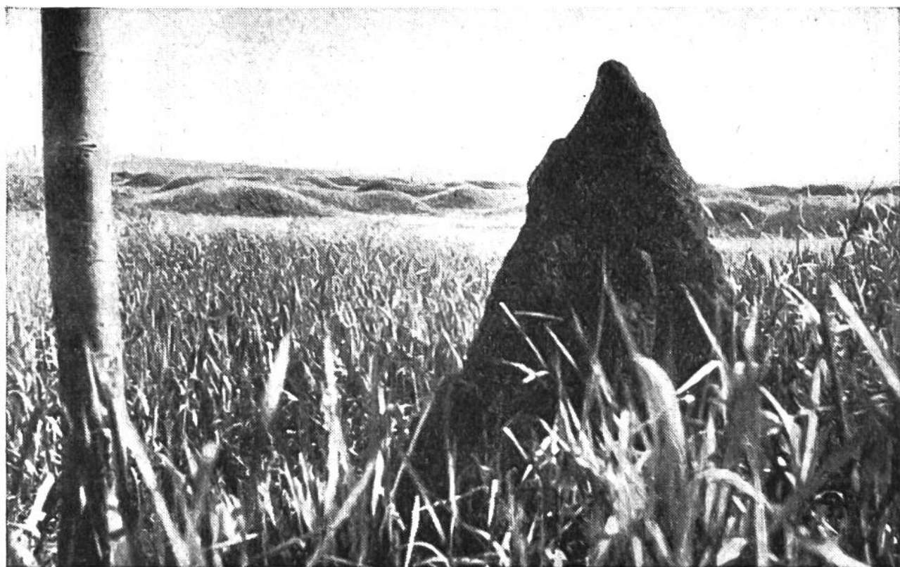
Übermannshoher Termitenhügel in der afrikanischen Steppe.