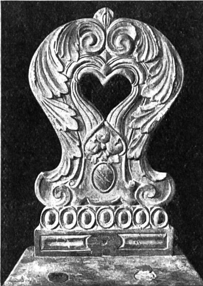
Toggenburger Schnitzerei: Eine Stabellen-Lehne aus dem 18. Jahrhundert.

in welchem Vorräte an Wäsche und Lebensmitteln, z. B. von Fruchtschnitzen, aufbewahrt wurden – waren beliebte Möbelstücke und eigentliche Vorgänger des Schrankes. Auf allen Seiten wurden diese grösseren und kleineren Kästen mit grosser Farbenfreudigkeit bemalt. Dass mit dem Pinsel auch vor den Bettstellen nicht haltgemacht wurde, beweisen die bemalten Bettladen. Es gibt noch in heutiger Zeit hie und da eine in vielen Farben leuchtende oder mit Schnitzwerk versehene doppelschläfige Himmel-