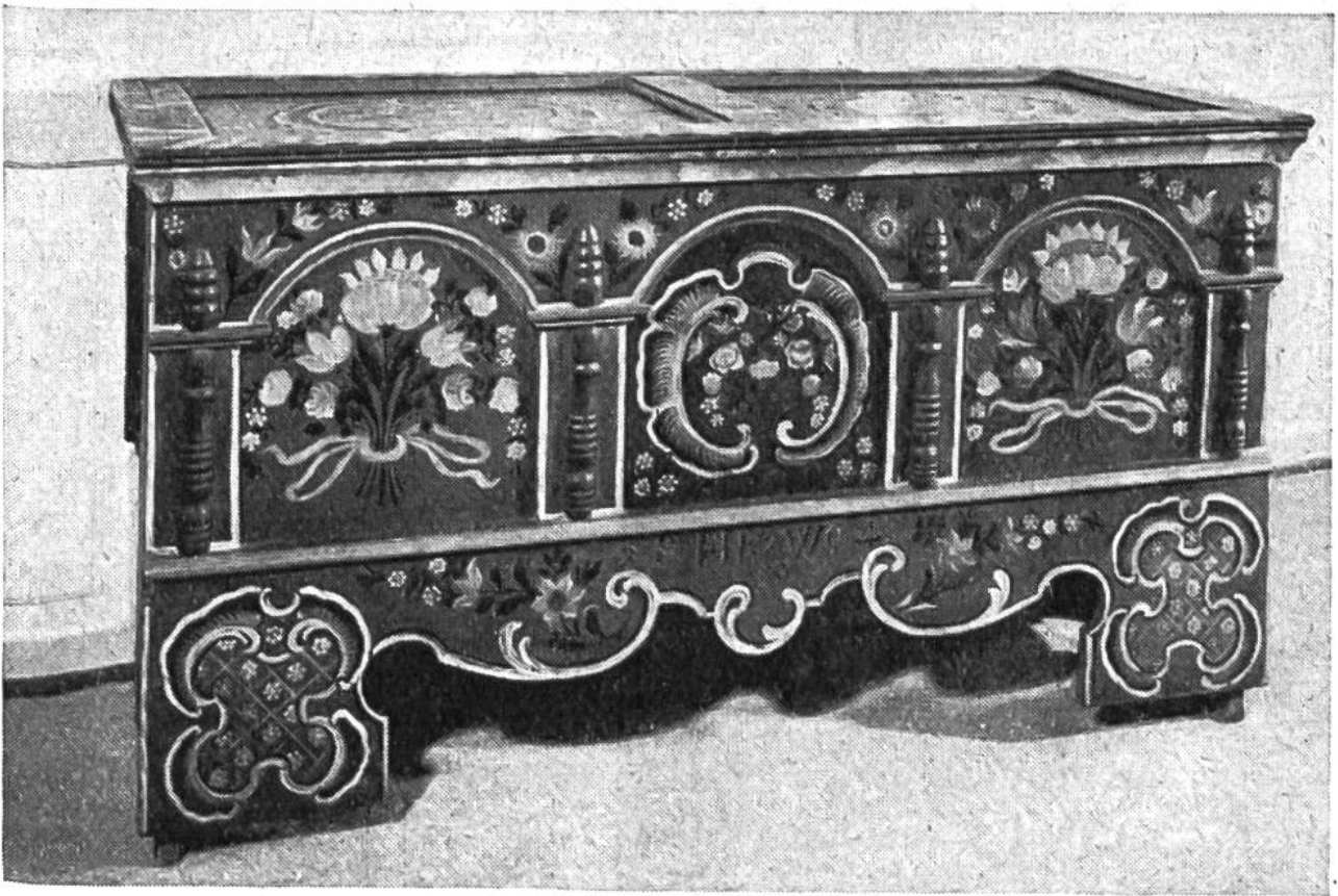
Diese schöne handgemalte Truhe aus dem Jahre 1804 steht im Appenzellerländchen.