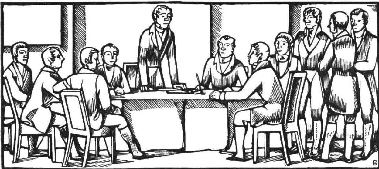
Kongresse zu Wien und Paris im Jahre 1815. Anerkennung der Neutralität der Schweiz.