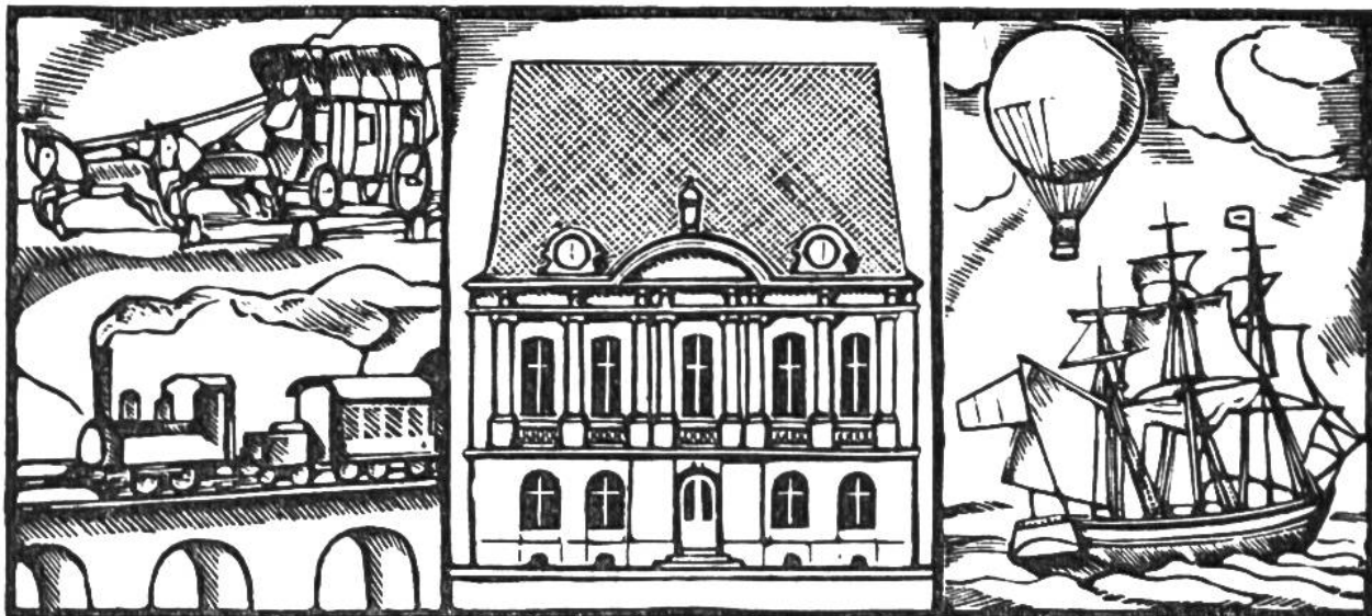
1874 wurde in Bern der Weltpostverein gegründet. (Bildmitte: Gründungsstätte an der Zeughausgasse.)

burg. Churchill wird engl. Ministerpräsident. 15.: Holland u. 28.: Belgien kapitulieren. Juni 10.: Norwegen kapituliert. 11.: Italien erklärt Grossbritannien u. Frankreich d. Krieg. 14.: Einmarsch deutscher Truppen in Paris. 17.: Russland besetzt nach Litauen auch Lettland u. Estland. 18.–21.: nahezu 40000 alliierte Truppen überschreiten die Schweizergrenze im Berner Jura. 22.: Waffenstillstand zw. Deutschland u. Frankreich u. 24.: zw. Italien u. Frankreich. Sept. 6.: Abdankung König Carols v. Rumänien zugunsten s. Sohnes Michael. 27.: Abschluss des Drei-Mächte-Paktes in Berlin zw. Deutschland, Italien u. Japan. Nov. 5.: Einmarsch ital. Trupp. in griech. Gebiet. 7.: Beginn der allnächtl. Verdunkelung i. d. Schweiz. 20.–24.: Ungarn, Rumänien u. die Slowakei treten dem Drei-Mächte-Pakt bei. Dez. 6.: Brit. Offensive gegen Libyen.