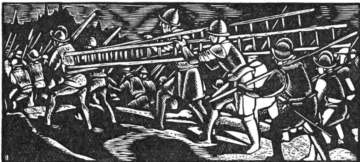
Genfer Escalade. Truppen Savoyens ziehen in der Nacht des 12. Dezember 1602 mit Belagerungswerkzeugen gegen Genf.