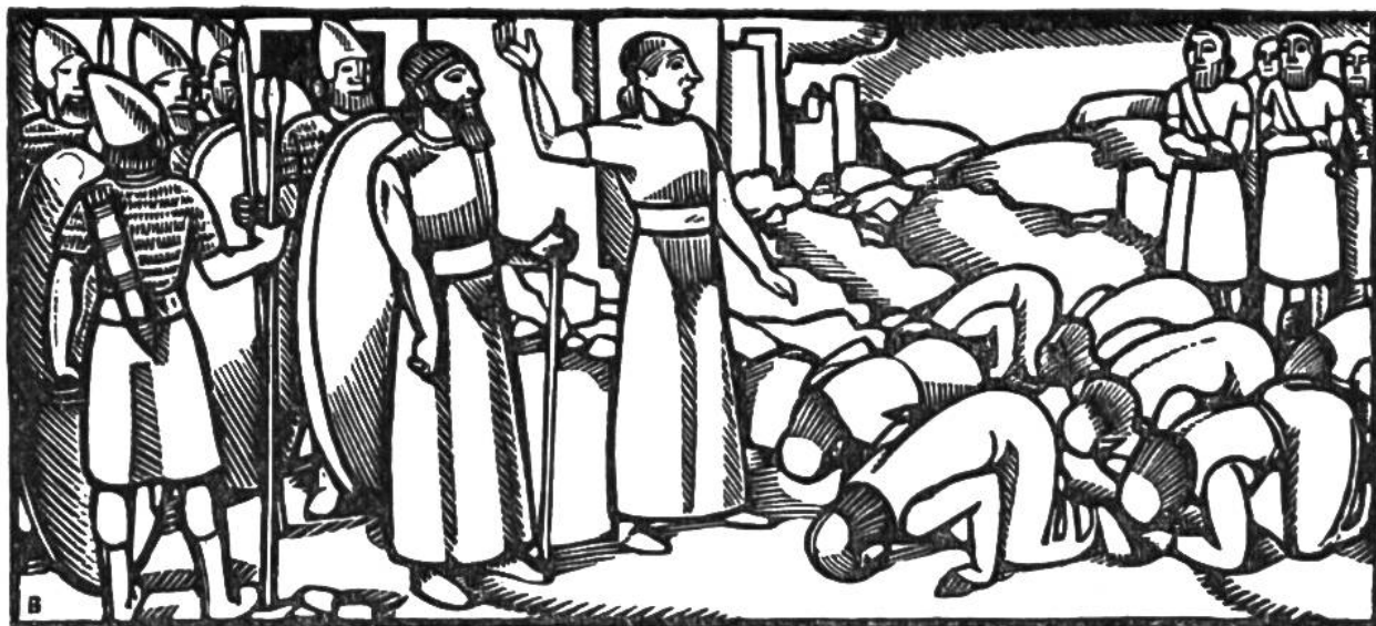
Eroberung Ägyptens durch Perser, 525 v. Chr.