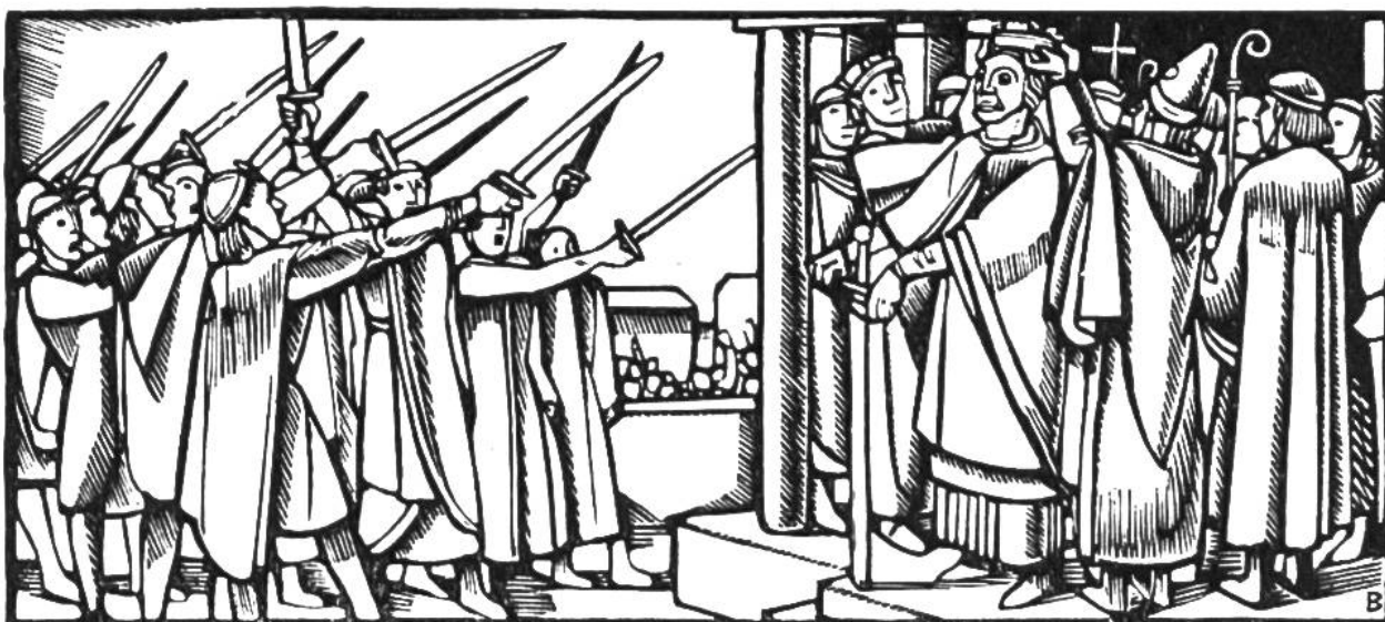
Der Frankenkönig Karl der Grosse wird am 25. Dezember 800 in Rom von Papst Leo III. zum römischen Kaiser gekrönt.