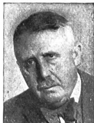
Eduard v. Steiger von Bern * 1881, seit 1941 im Amte Justiz-u. Polizeid.