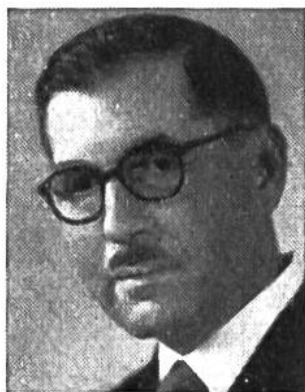
Dr. Karl Kobelt von Marbach (St. G.) * 1891 seit 1941 i. Amte Militärdepartem.