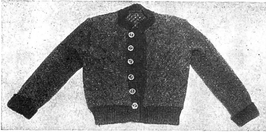
Kinderjäckchen aus einer alten Damen-tricotweste mit angestrickten Bördchen.