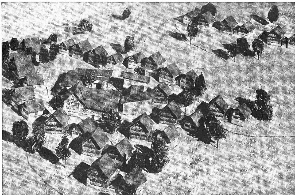
Das Modell des Kinderdorfes, das von Architekt Hans Fischli erbaut wird: ein helles, frohes Dorf aus heimeligen Häusern im Appenzeller Wohnhausstil.