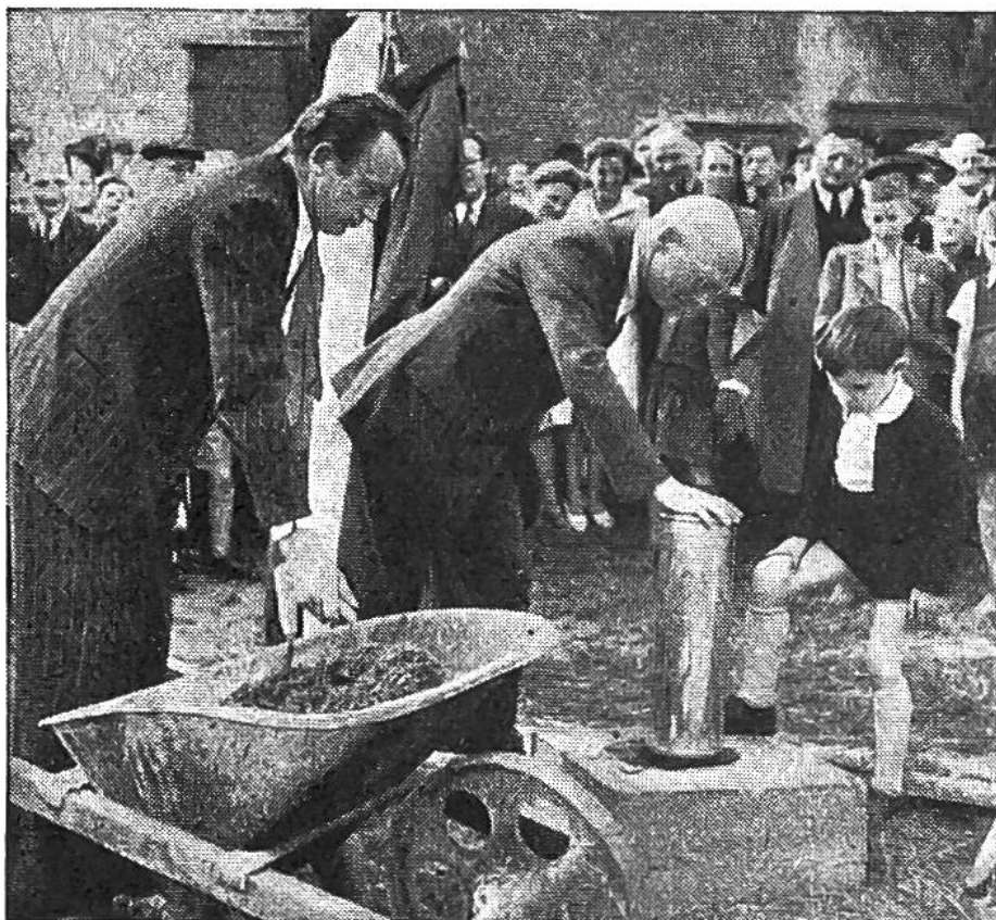
Am 28. April 1946 fand in Trogen die Grundsteinlegung des Kinderdorfes statt. Die Büchse mit historischen Dokumenten wird in den Grundstein eingemauert.

schau und im Mai 1946 heben jugendliche Freiwillige in Trogen die Erde für die in der ersten Bauetappe vorgesehenen Kinderhäuser aus. Die Stiftung Pro Juventute sammelt Geld und Naturalien; es ist eine Aktion, welche die Begeisterung grosser Kreise der Bevölkerung findet. Vor allem stellt sich die Jugend ein, die sich spontan anbietet, die mitbauen und mithelfen will.