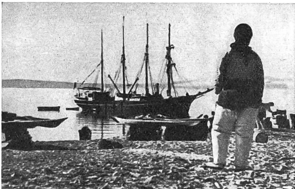
Die für die Eskimos wichtigen Lebensgüter werden ausgeladen.

sen einer der wildesten Schneestürme der dunklen Polarnacht tobt. In diesem einzigen Raum sitzen sie entblößten Oberkörpers beim Tranlicht und schmausen nach Herzenslust. Uns würde es wohl weniger munden; denn ihre Vorliebe für alle Arten rohen Fleisches, gefroren oder halbgefroren, entspricht nicht unseren Sitten. Auch erscheint es uns nicht gerade appetitlich, dass sie sich beim Essen der blossen Hände und eines eigenartigen Messers bedienen, mit dem sie die Bissen des mit den Zähnen gehaltenen Fleisches knapp vor den Lippen abschneiden. Die Eskimos besitzen, in primitiver Weise natürlich, einen ausgesprochenen Sinn für Musik, der sie befähigt, als eigene Komponisten und Dichter aufzutreten und sich auf einer Art kleiner Trommel geschickt zu begleiten.