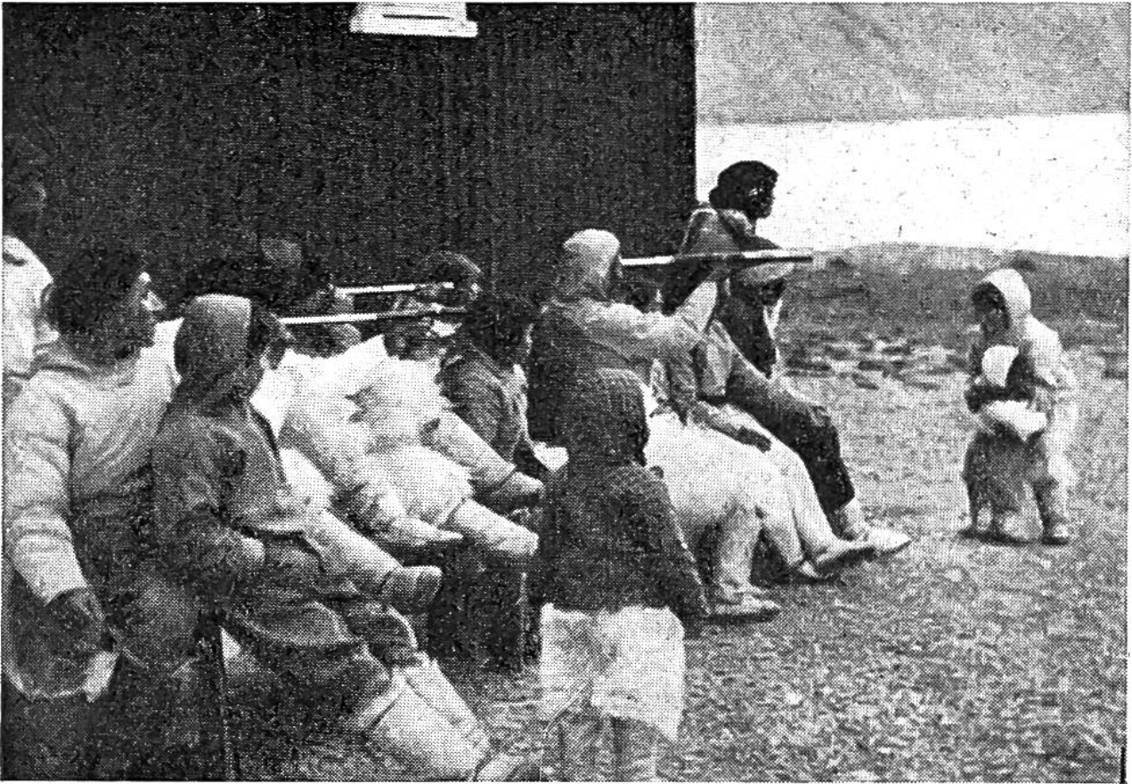
Einmal im Jahre läuft vor Thule, der Eskimosiedlung in Nordgrönland, ein dänischer Dampfer an. Neugierig und erwartungsvoll spähen die Eskimos nach ihm aus.