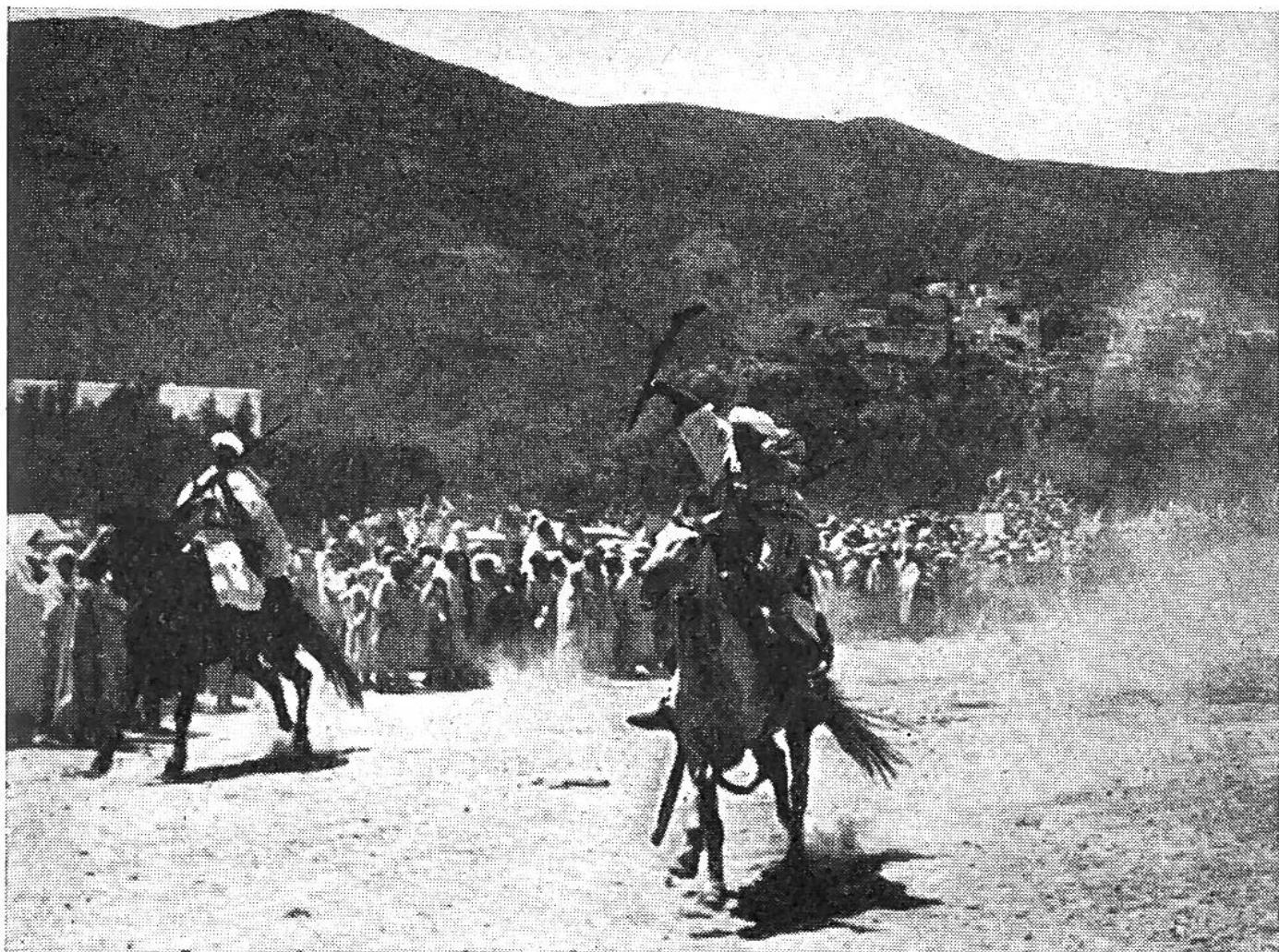
Mit sicherem Griff hat der Reiter das herunterfallende Gewehr aufgefangen. Im Hintergrund die heilige Stadt Moulay Idris.