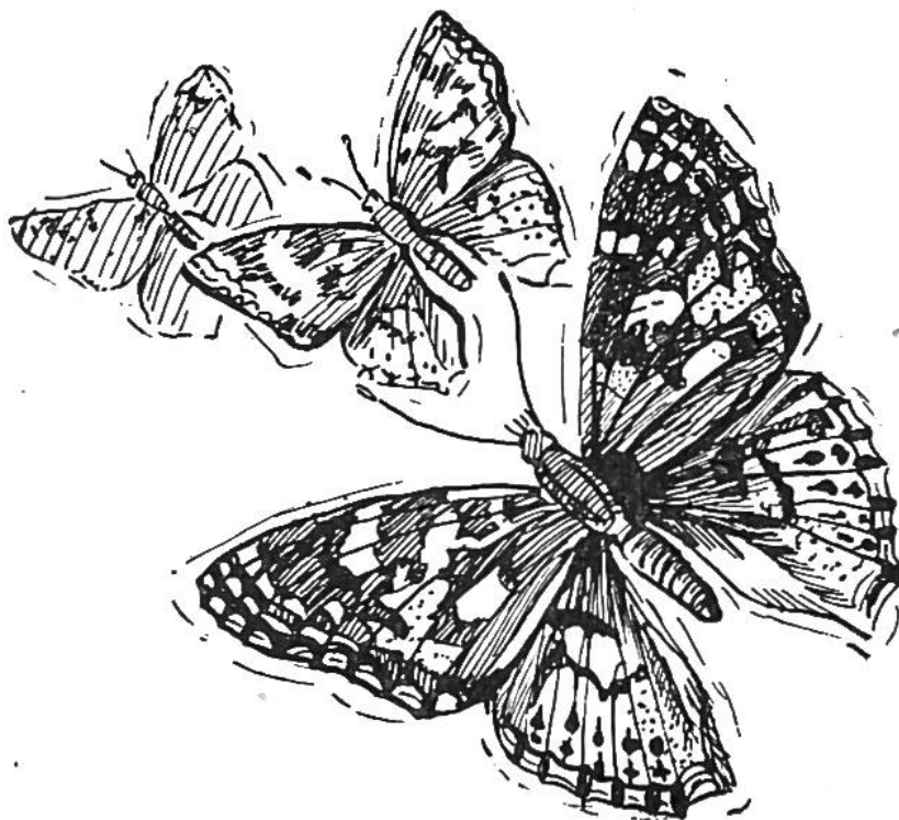
Distelfalter im Flug.

zahlreichen Beobachtungsstationen und Ermittlung ihres späteren Aufenthaltes kennen wir heute von vielen Vogelarten die jeweiligen Flugrouten auf ihrem Zug im Frühjahr nach Norden und im Herbst nach Süden. Diese Kenntnis vermittelt wiederum wertvolle Einblicke in die Lebensgewohnheiten der Vögel.