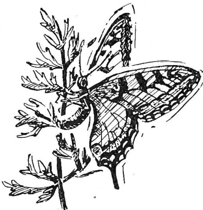
Schwalbenschwanz, ein Ei an eine Möhre heftend.

nur scheint bei ihm der Zug dichter aufgeschlossen, so dass es manchmal aussieht wie loses Schneegestöber mitten im Sommer. Unser prächtiger Admiral gehört ebenfalls zu den „Wandern“, aber man hat noch keine geschlossenen Züge beobachtet. Wäre es bei Nacht nicht so dunkel, so könnten wir noch eine ganze Anzahl feststellen, vor allem die Schwär-