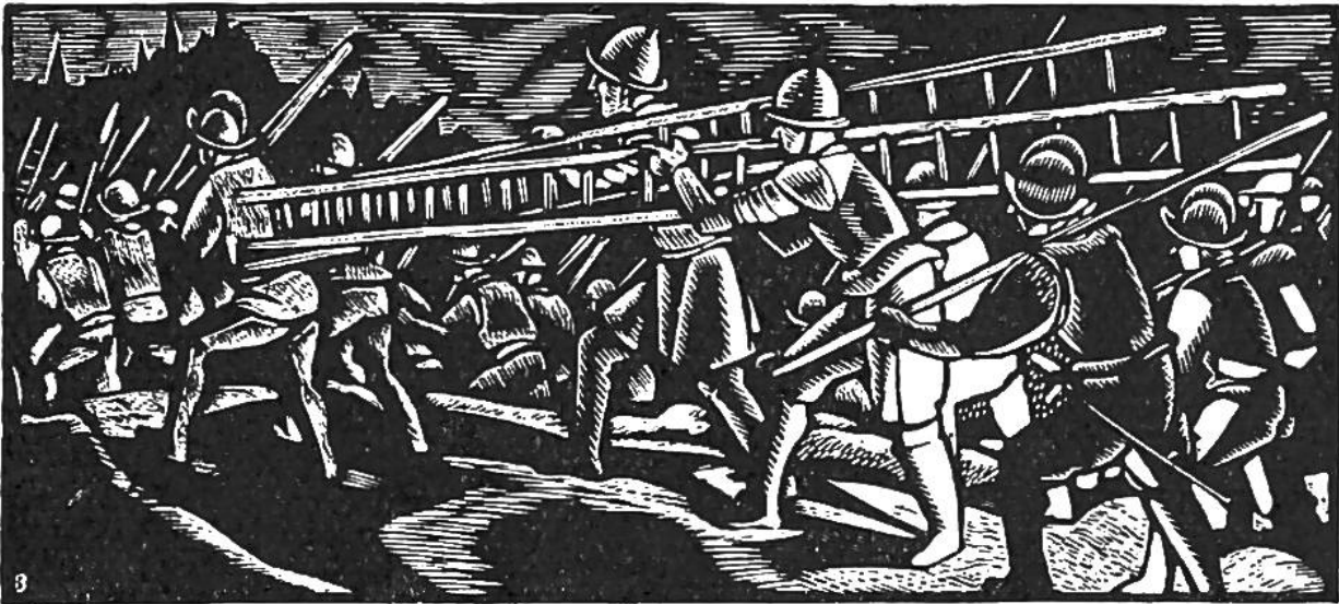
Genfer Escalade. Truppen Savoyens ziehen in der Nacht des 12. Dezember 1602 mit Belagerungswerkzeugen gegen Genf.