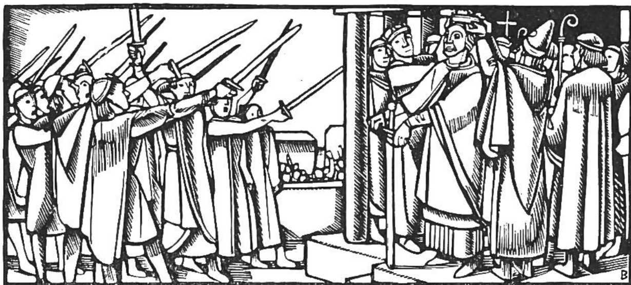
Der Frankenkönig Karl der Grosse wird am 25. Dezember 800 in Rom von Papst Leo III. zum römischen Kaiser gekrönt.