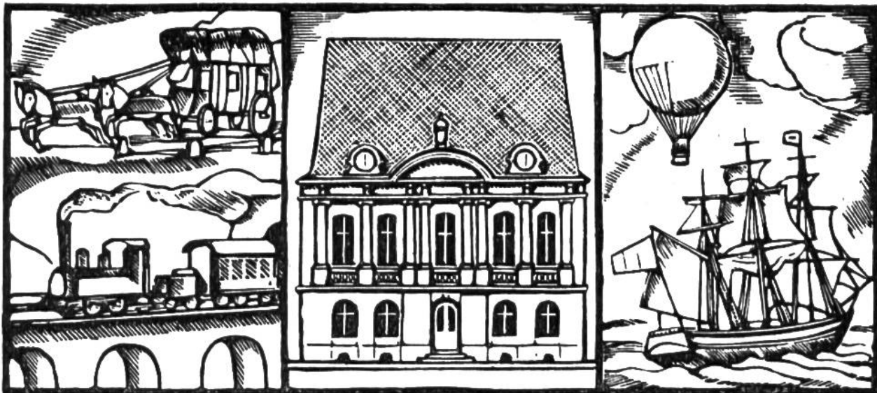
1874 wurde in Bern der Weltpostverein gegründet. (Bildmitte: Gründungsstätte an der Zeughausgasse.)

burg. Churchill wird engl. Ministerpräsident. 15.: Holland u. 28.: Belgien kapitulieren. Juni 10.: Norwegen kapituliert. 11.: Italien erklärt Grossbritannien u. Frankreich d. Krieg. 14.: Einmarsch deutscher Truppen in Paris. 17.: Russland besetzt nach Litauen auch Lettland u. Estland. 18.–21.: nahezu 40 000 alliierte Truppen überschreiten die Schweizergrenze im Berner Jura. 22.: Waffenstillstand zw. Deutschland u. Frankreich u. 24.: zw. Italien u. Frankreich. Sept. 6.: Abdankung König Carols v. Rumänien zugunsten s. Sohnes Michael. 27.: Abschluss des Drei-Mächte-Paktes in Berlin zw. Deutschland, Italien u. Japan. Nov. 5.: Einmarsch ital. Trupp. in griech. Gebiet. 7.: Beginn der allnächtl. Verdunkelung i. d. Schweiz. 20.–24.: Ungarn, Rumänien u. die Slowakei treten dem Drei-Mächte-Pakt bei. Dez. 6.: Brit. Offensive gegen Libyen.