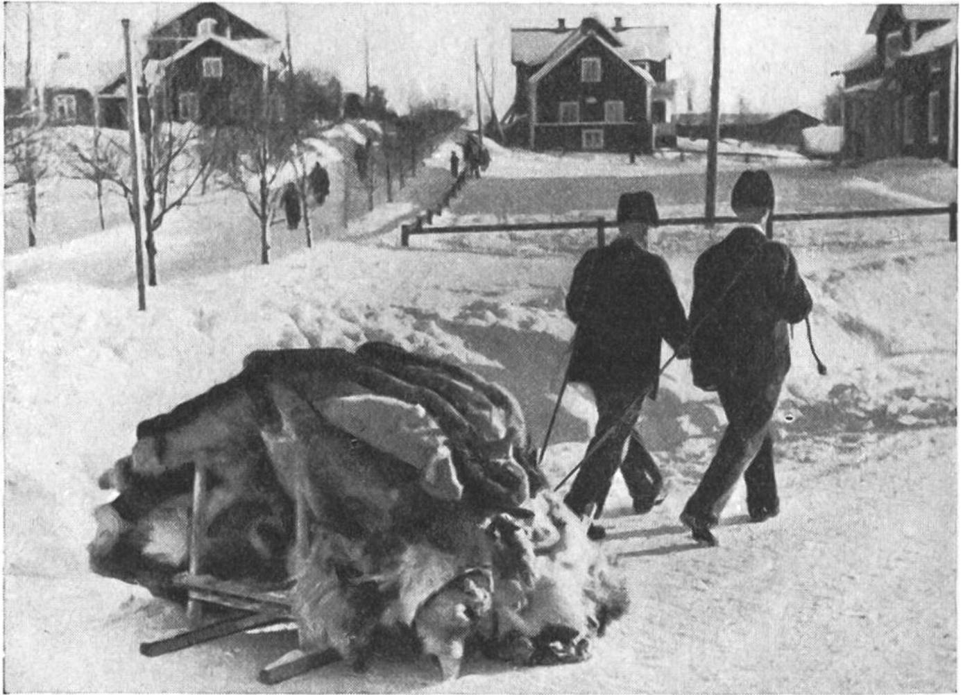
Die auf dem Fellmarkt erworbenen kostbaren Rentierfelle werden nach Hause geführt (Lappland).

unternommen, es zum Wohl unserer Bergbevölkerung einzuführen. Im Jahre 1866 erwarb die Oberengadiner Gemeinnützige Gesellschaft ein Paar Rentiere aus den Zoologischen Gärten von Paris und Köln. Von Samaden aus brachte man die Tiere auf die Alp Misaum unterhalb des Rosegg-Gletschers. Während des ersten Sommers lebten sie sich gut ein, und auch die Überwinterung in Pontresina verlief ohne Zwischenfälle; aber später wurde der Bock so angriffslustig, dass sein Geweih abgesägt werden musste. Da sich zudem die beiden Rentiere wider Erwarten nicht vermehren wollten, wurden sie an den Turiner Tiergarten verkauft. So endete dieser wohlgemeinte Versuch.