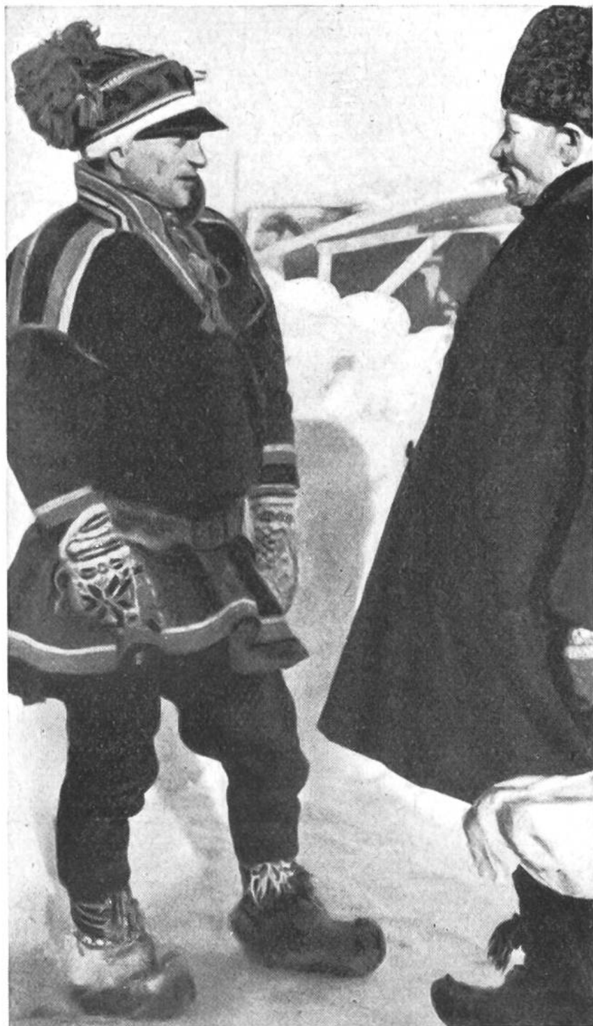
Auf dem Fellmarkt verhandelt ein lappländischer Rentierzüchter mit dem Fellhändler.

tier, das sich zum Schlittenziehen über die unendlichen Schneeflächen wie kein zweites eignet, und schliesslich dient es den kleinenwüchsigen Lappländern auch als Reittier.