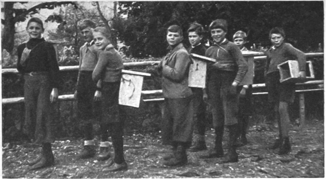
Knaben einer Primarschulklasse haben sich zu einer Vogelschutzgruppe zusammengetan. Sie rücken hier mit Nisthöhlen und Futtergeräten aus, um die aufgehängten Höhlen nachzusehen, beschädigte Kästen zu ersetzen und neue anzubringen. In der Gemeinde sind über 400 Höhlen zu kontrollieren.

Nutzpflanzen nach Beute absuchen. Jedermann vermag so zu ermessen, welch ungeheure Mengen schädlichen Getiers vernichtet werden, handelt es sich doch nicht nur um ein Meisenpaar und eine Vogelart. Die Stare sollen ebenso eifrig und die Gartenrotschwänzchen gar noch fleissiger sein. Es sind auch nicht bloss die kleinen Singvögel, die uns im Kampfe gegen die Schädlinge beistehn; die meisten Raubvögel, besonders Eulen, Bussarde und Turmfalken verdienen als eifrige Mäusejäger nicht weniger unsern Schutz. Magenuntersuchungen an toten und verunglückten Vögeln haben gezeigt, dass einige Eulenarten beinahe ausschliesslich tierische Schädlinge vertilgen, vor allem Mäuse und Ratten.