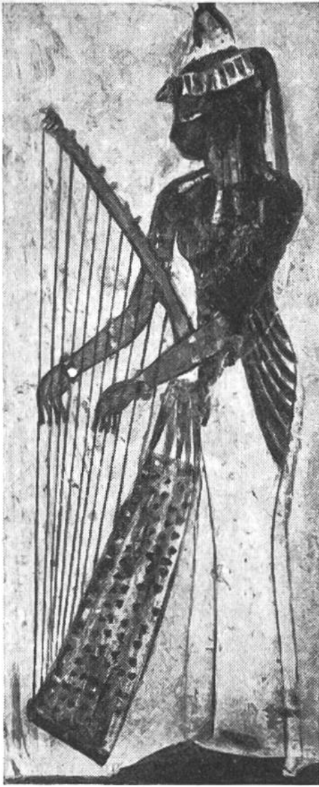
Ägypterin spielt auf einer elfsaitigen Harfe. Grabgemälde aus dem 14. Jahrh. v. Chr.