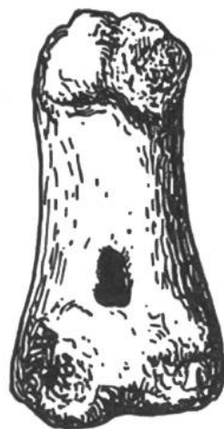
Pfeifchen aus einem Fusswurzelknochen (Altsteinzeit).