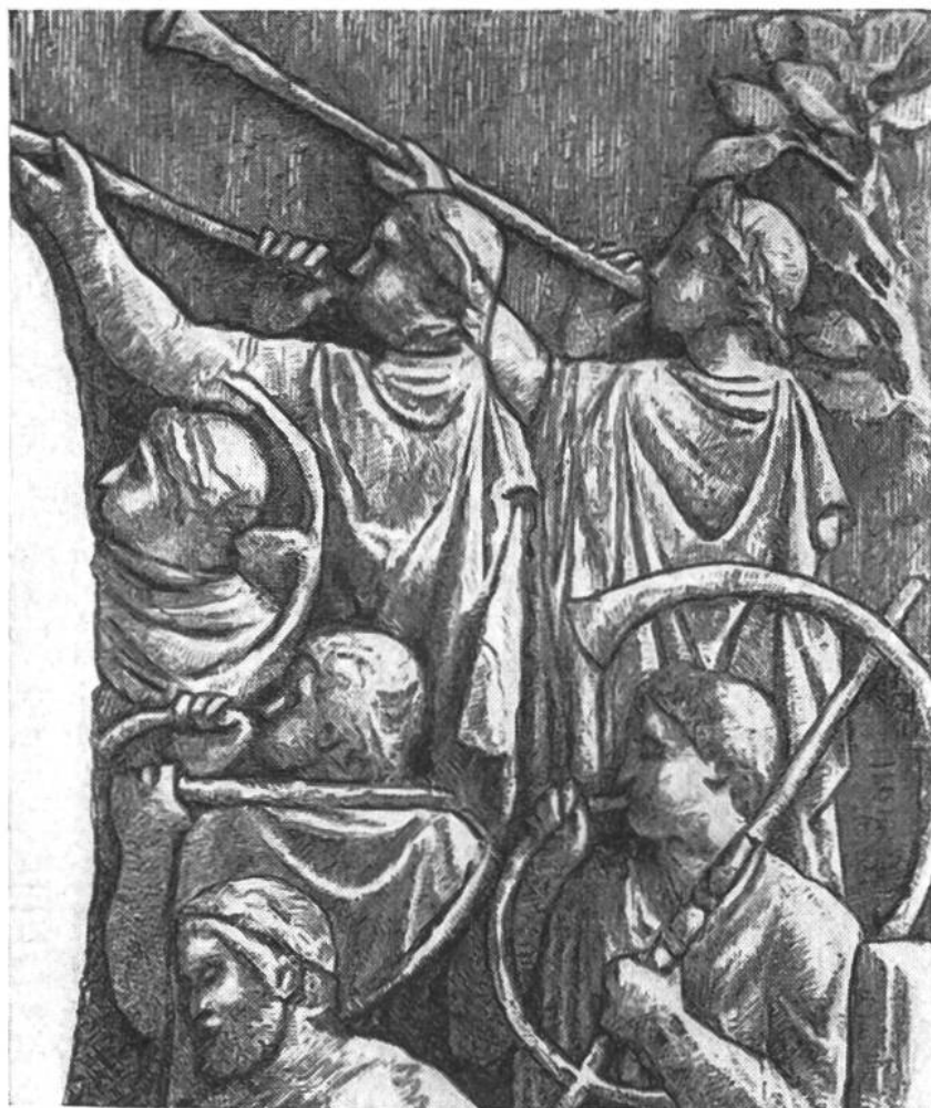
Römische Bläser an einem Triumphzug. Hauptinstrumente waren die Tuba (Trompete) und die Buccina. Relief v. d. Trajanssäule, Rom.

Die Römer schöpften ihre Musik zum grossen Teil am Born der griechischen. Musik wurde lange Zeit nur von den Vornehmen gepflegt. Adlige junge Männer und Mädchen lernten tanzen, singen, musizieren. Während der Mahlzeiten lauschten die reichen Römer gern den Klängen eines Orchesters. Gute Musikanten wurden sehr gefeiert und waren deshalb, so sagte man ihnen nach, oft ebenso reich an Einbildung wie an Geld!