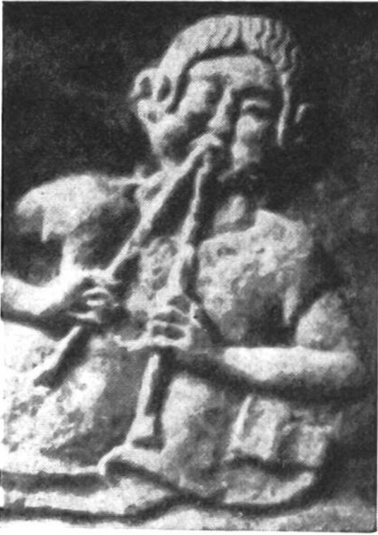
Flötenspieler (Aulosflöte). Von einem etruskischen Kalksteinrelief aus dem 6. Jahrh. v. Chr.

den Menschen zu stärken und zu bessern; sie kann ihn aber auch zur Tiefe ziehen.“ Die griechische Tonkunst bestand vor allem aus einstimmigen Gesängen – die alten Völker kannten überhaupt die Mehrstimmigkeit noch nicht. Je nach der gewählten Tonart trug der Gesang verschiedenartigen Charakter: edle Tonschöpfungen wurden auf der Kithara (Gitarre) und auf der Lyra (Leier) begleitet, während die Aulosflöte, ein Blasinstrument, das wildere und ausgesprochen weltliche Stimmung ausdrückt, an ausgelassenen Festen gespielt wurde. Bei sol-