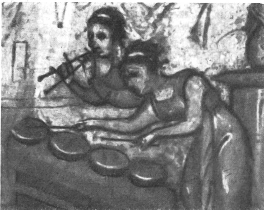
Musizierende Mädchen. Ausschnitt aus der Miniaturmalerei «Das Mahl des Pharao», um das Jahr 500 in Byzanz gemalt.

chen Festlichkeiten und bei Theateraufführungen sangen die Sänger eine Melodie in harmonischer Übereinstimmung mit dem unterlegten Text, worauf die Spielleute dieselben Töne auf ihren Instrumenten, eine Tonstufenleiter höher oder tiefer, wiedergaben.