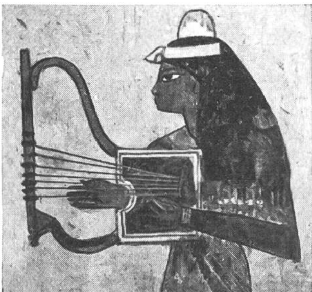
Ägypterin mit siebensaitiger Lyra (Leier), 14. Jahrhundert vor Chr.