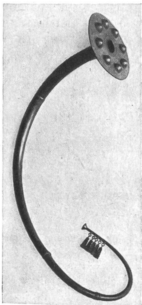
Lure, dänische Bronzetrompete aus der Bronzezeit.

instrumenten, deren Geräusche taktmässig gruppiert wurden. In dieser ursprünglichen musikalischen Beschäftigung bewahrheitet sich der Satz: „Im Anfang war der Rhythmus.“ Töne in unserm Sinne wurden erst den Blasinstrumenten entlockt. Auf Knochenpfeifen wurden die ersten Lieder, auf Tierhörnern die ersten Kriegsfanfaren geblasen, deren rauher Klang oft allein schon genügt, den Feinden Schrecken einzujaugen. Aus der Bronzezeit (ca. 2000–1100 v. Chr.) kennen wir die Lure, deren Töne schon weicher und angenehmer klingen. Die jüngsten und schönsten Geschwi-