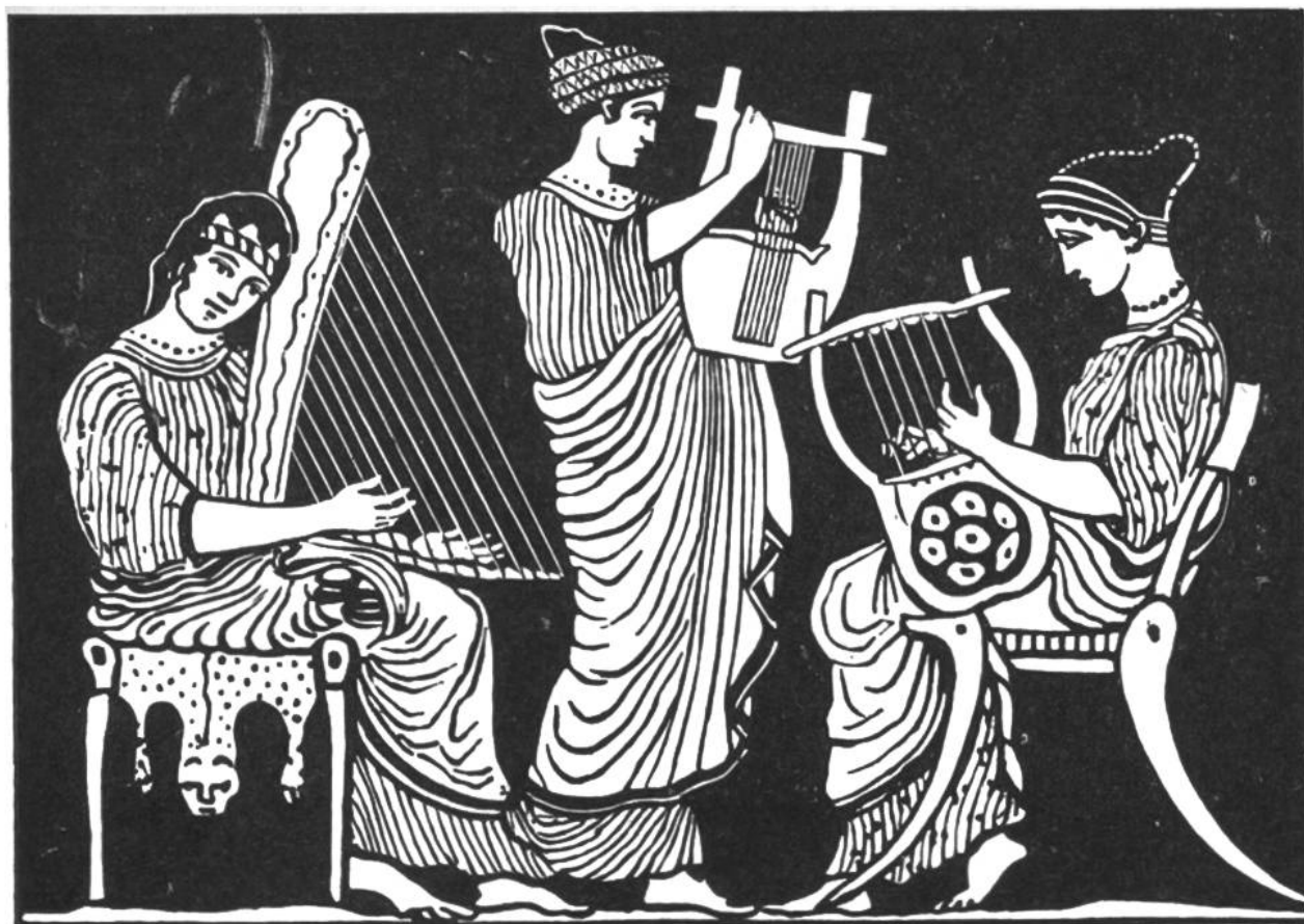
Griechinnen spielen Harfe und Lyra.

versammelten sich die Gläubigen zum Gottesdienst, den unzählige Musiker durch Spiel und Gesang verschönten. Die Psalmen bestanden oft aus Wechselgesängen zwischen Priestern und Gemeinde.