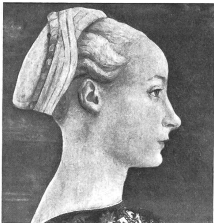
Frauenbildnis des Malers Domenico Veneziano (15. Jahrh.).