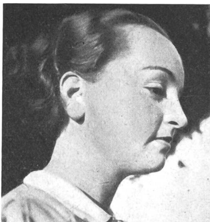
Mädchen aus dem heutigen San Gimignano.

ten, flattern nun in der Dämmerstunde Fledermäuse ein und aus. Drunten in der Stadt aber hat sich das Leben kaum gewandelt; der Anblick der Häuser wie der alten Kirche, des brunnengeschmückten Platzes wie der engen Gässchen ist heute noch derselbe, wie er sich vor Jahrhunderten dem Dichter Dante, dem Mönch Savonarola oder dem Geschichtstheoretiker Macchiavelli bot, als diese von Florenz aus in politischen Missionen in San Gimignano zu Gast waren und als sich die mächtigen Adelsfamilien leidenschaftlich um die Herrschaft stritten. Ja, die Menschen selbst haben sich in Aussehen und Gehaben nicht verändert: die Gesichtstypen der heutigen Bewohner sind den Bildnissen zum Verwechseln ähnlich, die im ausgehenden Mittelalter und zur Zeit der Renaissance in diesem Landstrich Mittelitaliens von Künstlern geschaffen wurden, und in den Gassen begegnet man immer noch den schlicht arbeitenden Wagnern, Schmieden, Korbflechtern, am Brunnen den Krugträgerinnen und Wäscherinnen, vor dem Tor dem Schäfer, der mit der Herde auszieht, um diese an der Berglehne zwischen den zum Trocknen ausgelegten Wäschestücken weiden zu lassen.