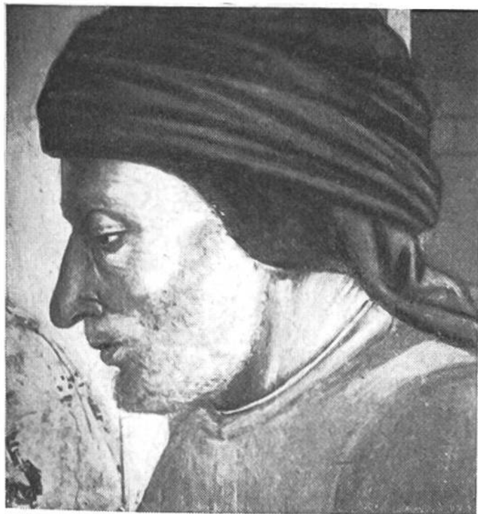
Freskenbildnis von Gozzoli (15. Jahrh.).