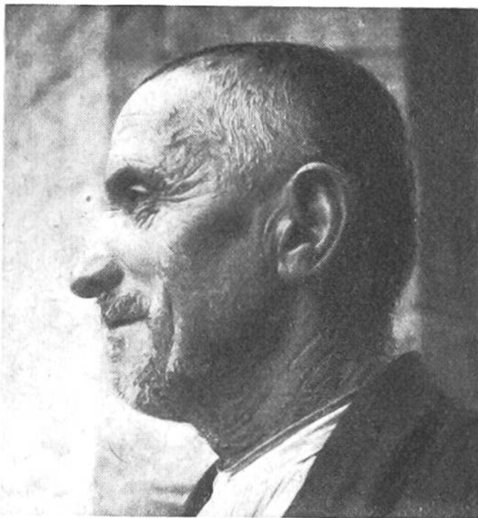
Bewohner von San Gi- mignano (20. Jahrh.).

In ihren Mauern sind noch Kunstwerke geborgen, wie sie sonst in den oft nüchternen Museen moderner Städte zusammengetragen sind — hier aber herrscht eine wunderbare Einheit von alteingesessenen Menschen mit alten Bauten, alter Kultur und alter, ewig schöner Landschaft, die von den hohen Türmen aus in beglückendem Rundblick zu über- schauen ist.