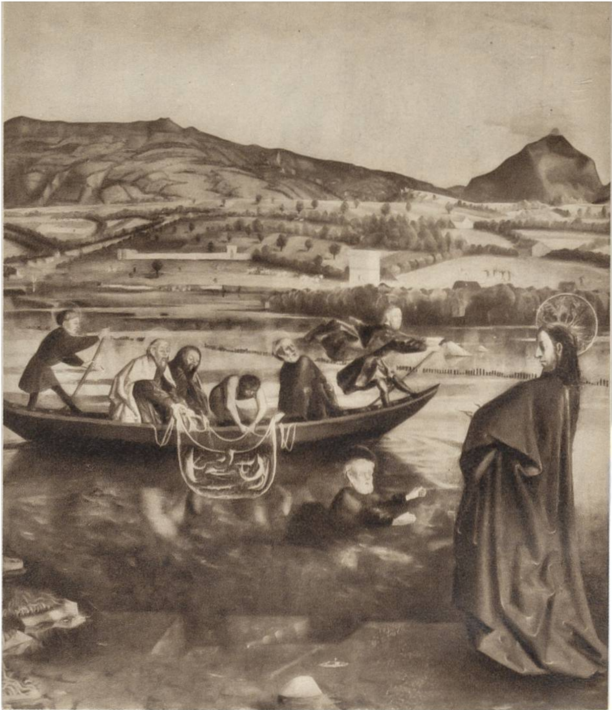
Der wunderbare Fischzug (Teilstück), von Konrad Witz, Basel, um 1395-1446. (Kunstmuseum Genf.)