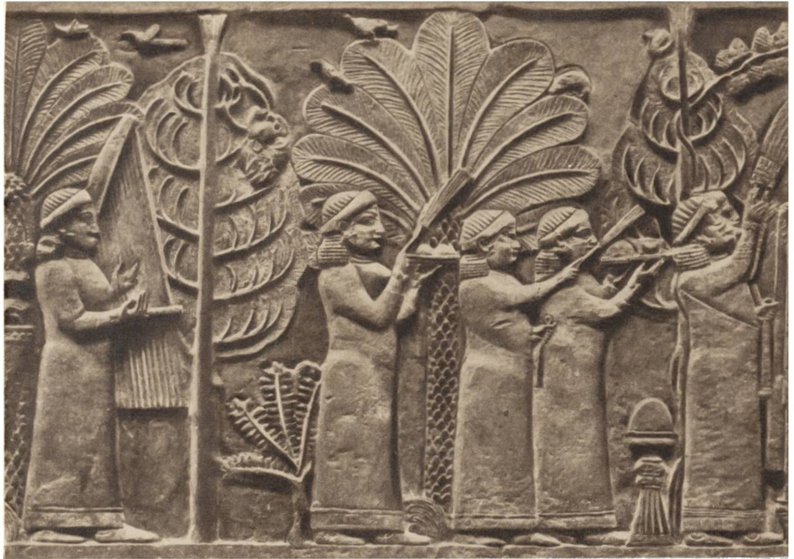
Gartenszene mit Dattelpal- me, Feige und Weinstock, assyri- sches Steinrelief aus dem 7. Jahr- hundert v. Chr.