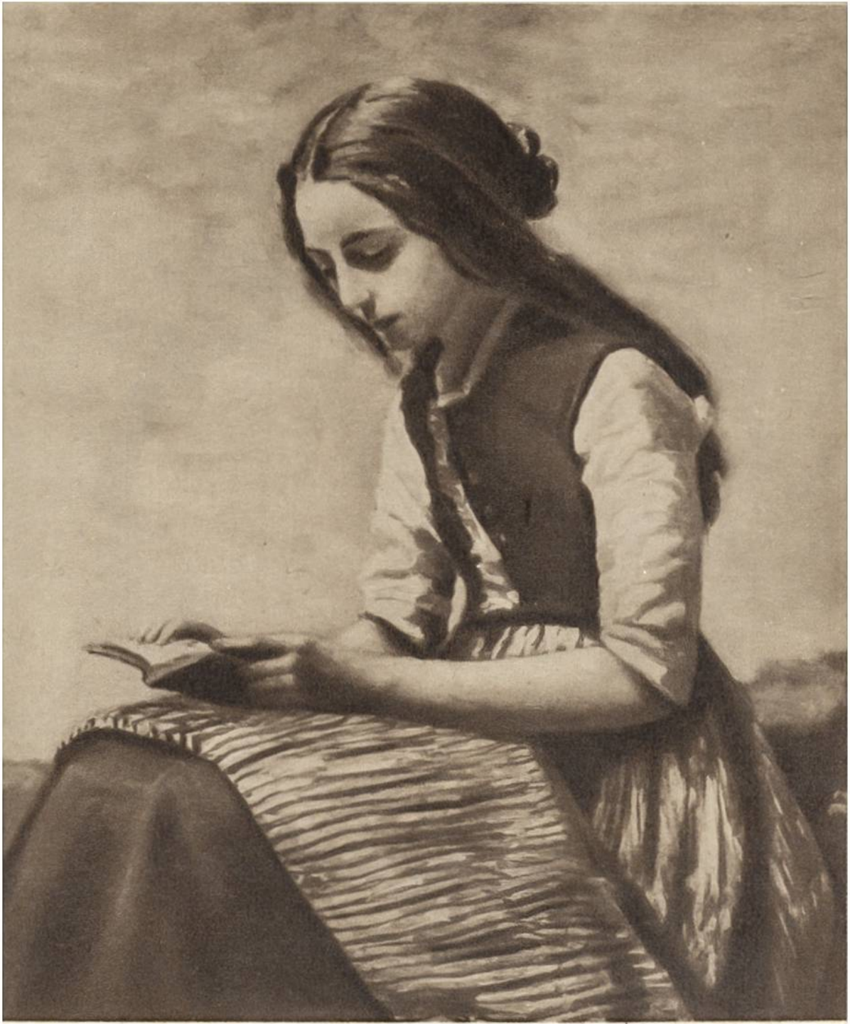
Lesendes Mädchen, von Camille Corot, Paris, 1796-1875. (Privatbesitz Winterthur.)