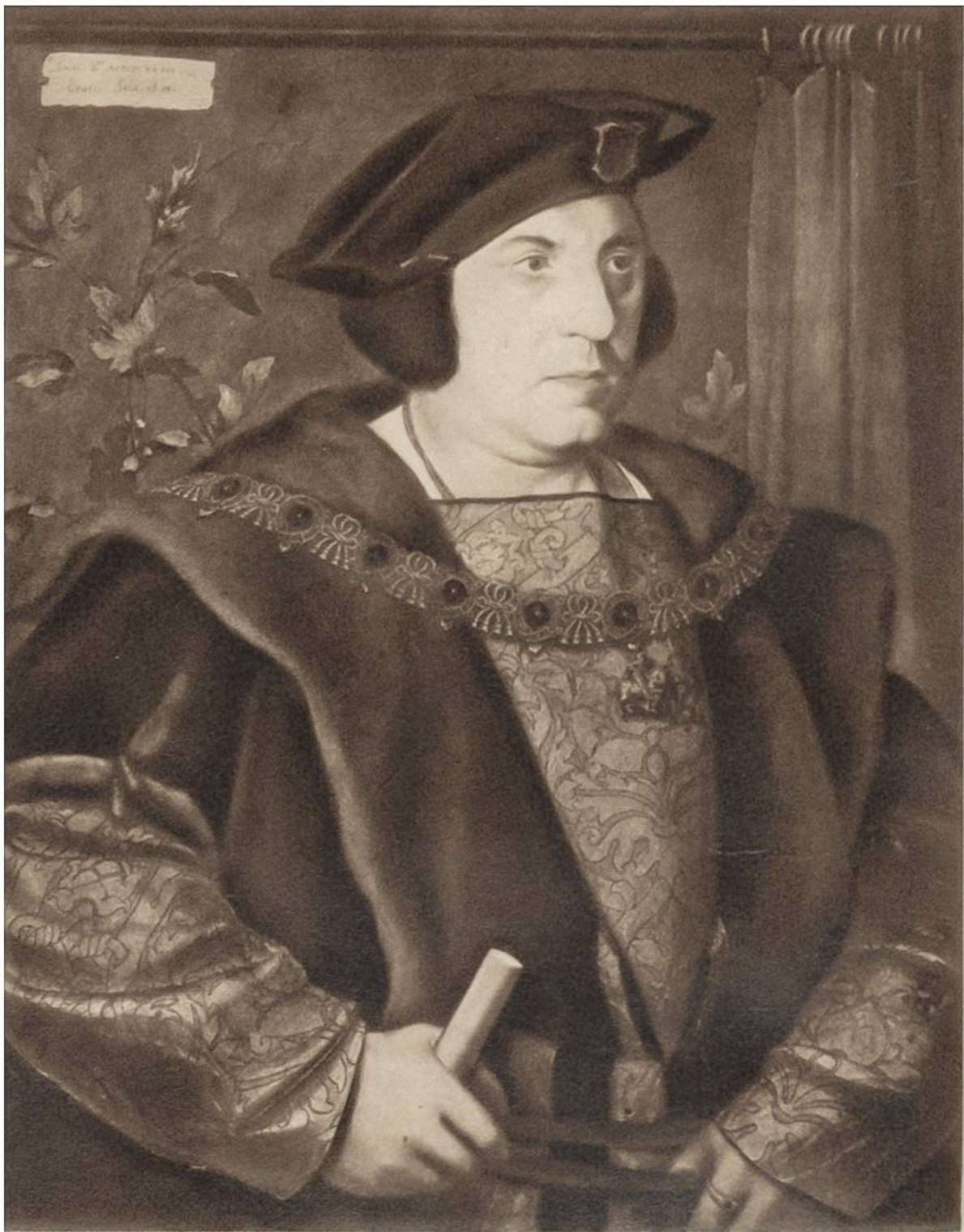
Bildnis eines englischen Adligen, von Hans Holbein d. J., Basel und London, 1497-1543.