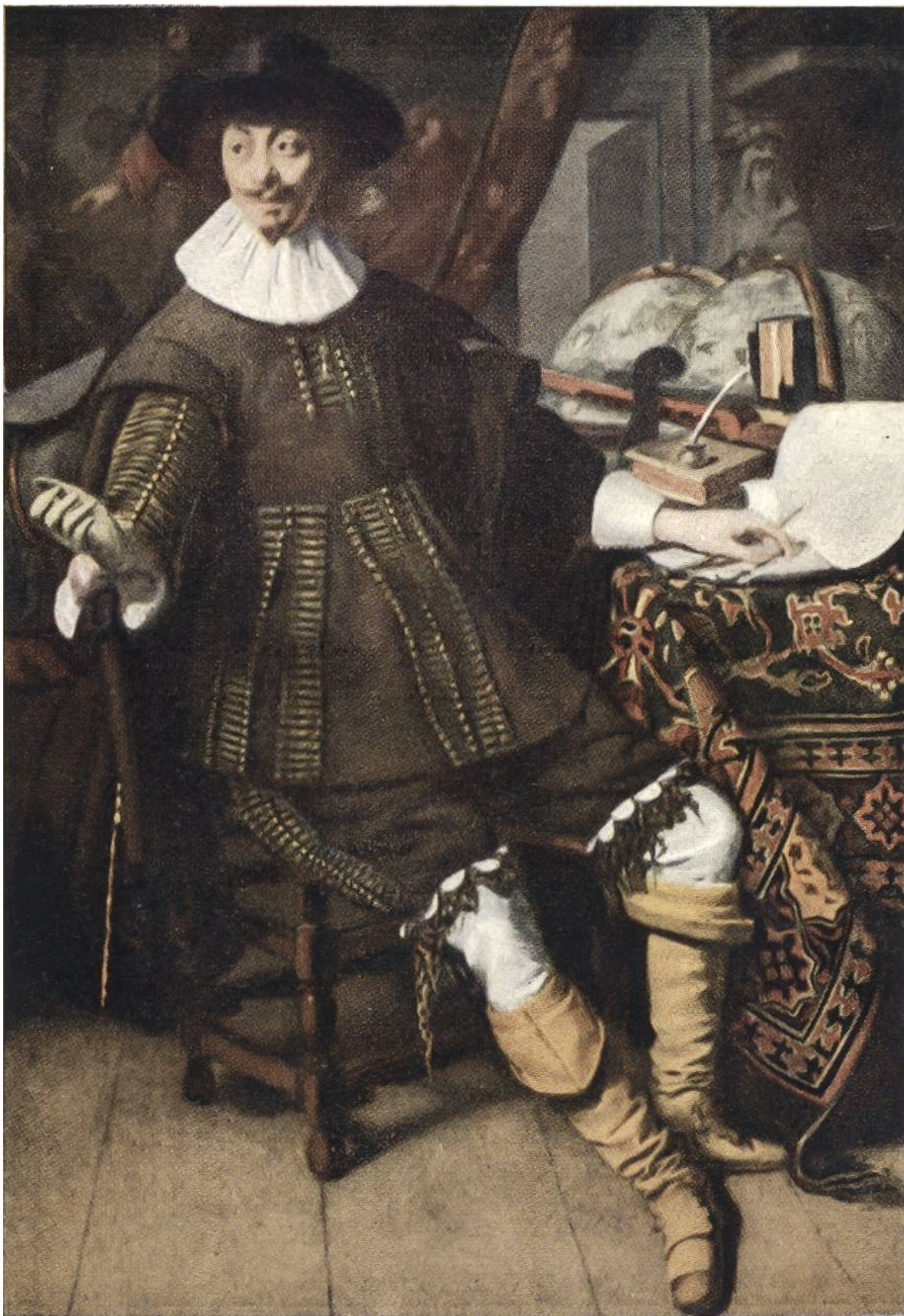
DER KAUFMANN von Thomas de Keyser, Amsterdam, 1596—1667.