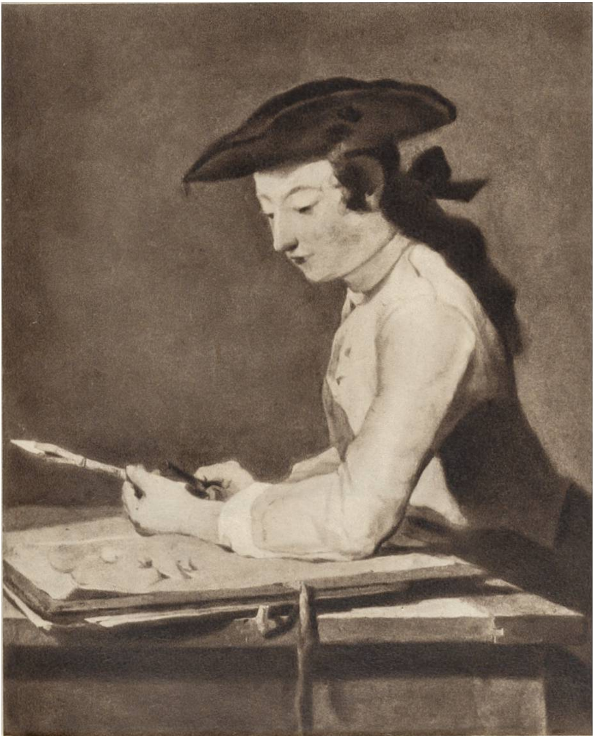
Der Zeichner, von J. B. S. Chardin, Paris, 1699-1779.