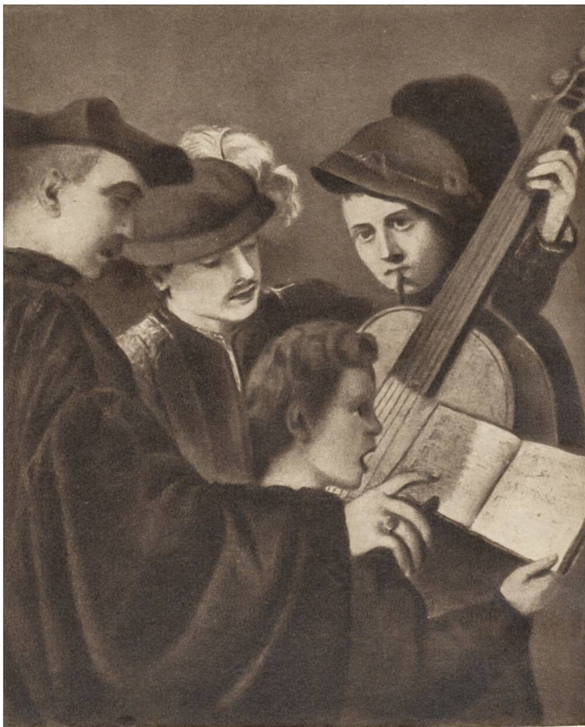
Das Konzert, von Tizian, Venedig, 1477-1576.