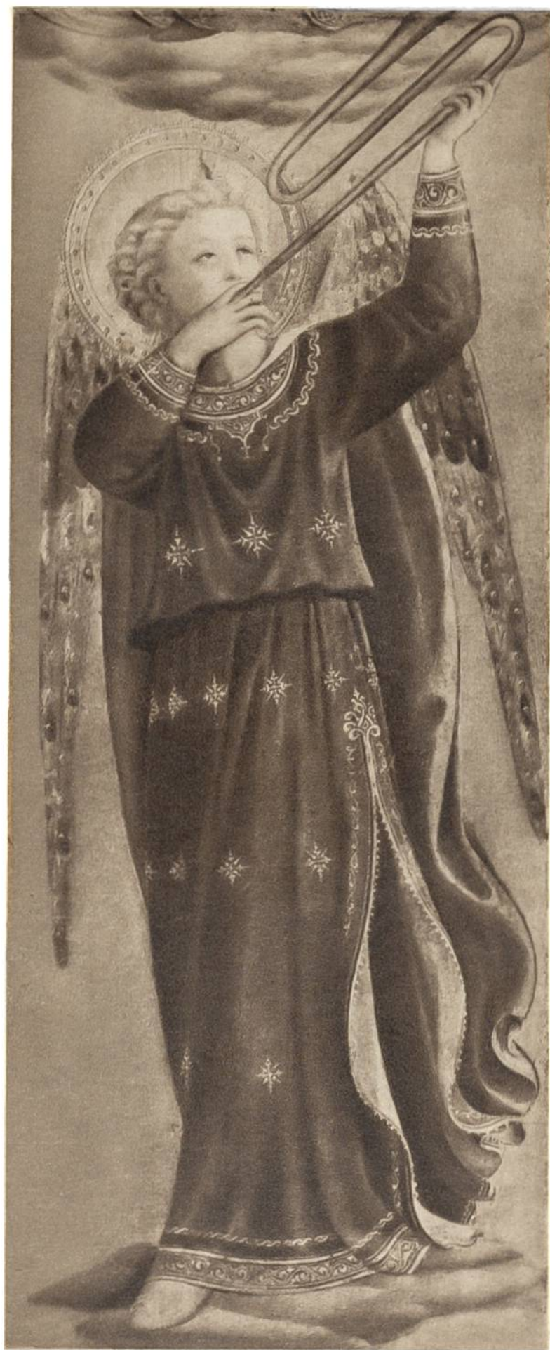
Musizierender Engel, von Fra Angelico da Fiesole, Florenz, 1387-1455.