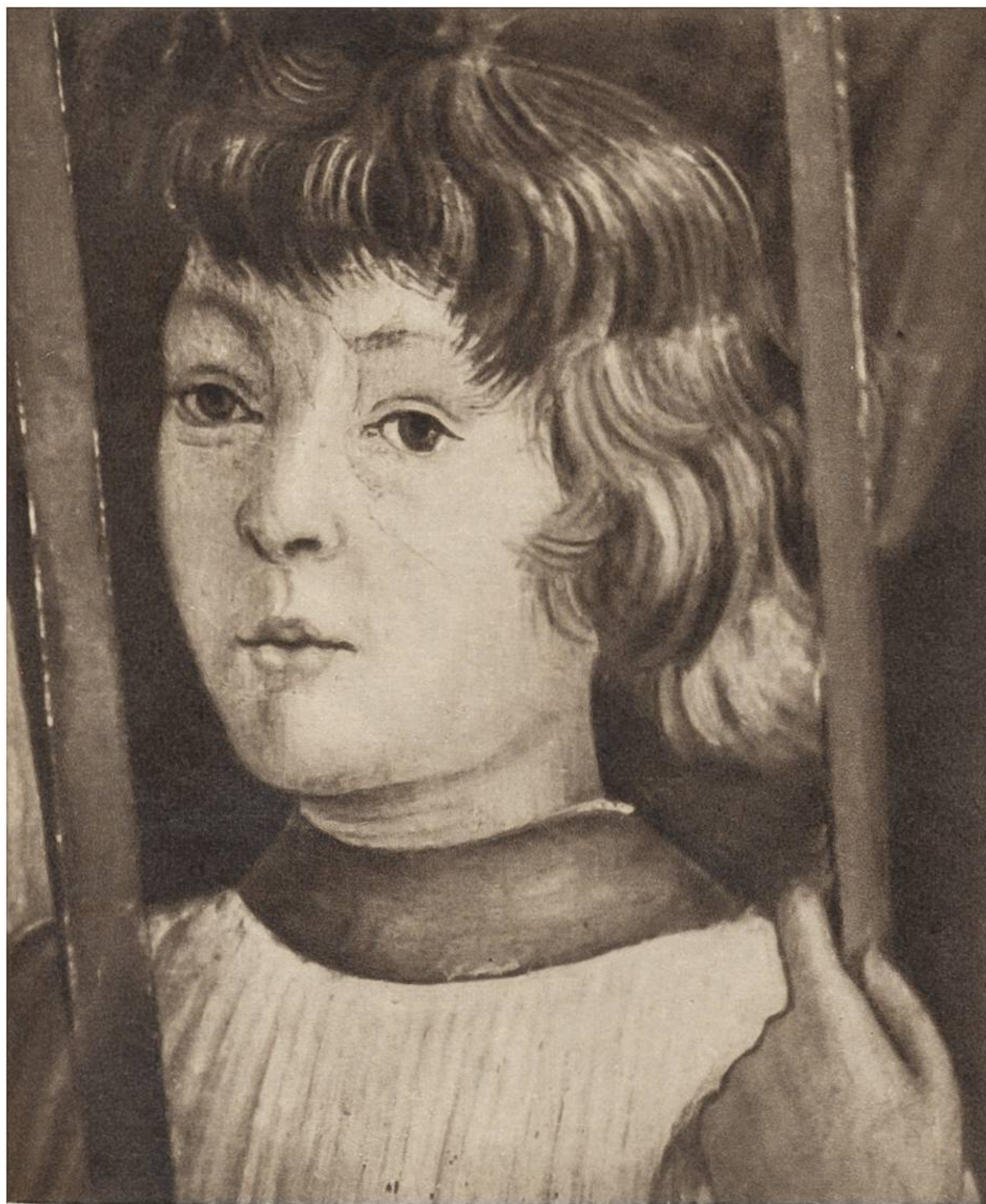
Chorknabe aus dem Freskengemälde «Tod der Santa Fina» in S. Gimignano, von Ghirlandajo, Florenz, 1449-1494.