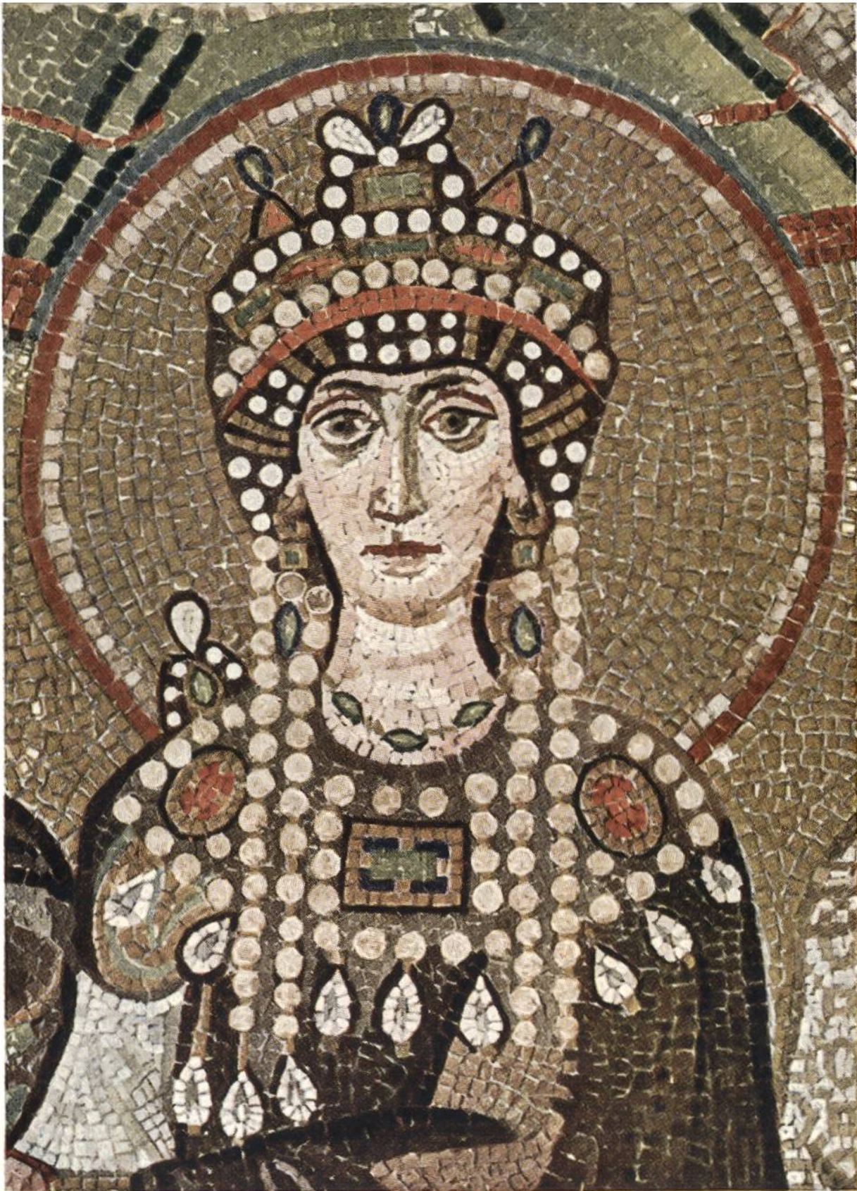
KOPF DER BYZANTINISCHEN KAISERIN THEODORA Mosaik in Ravenna aus dem Jahre 548 n. Chr.