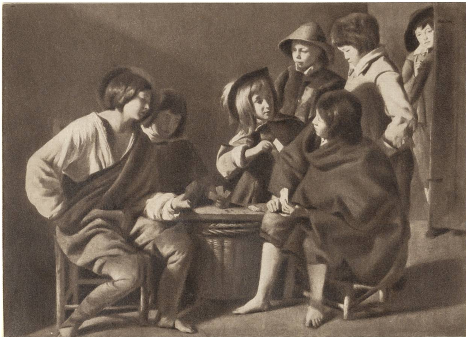
Die jungen Kartenspie- ler, v. Le Nain, Paris, um 1600.