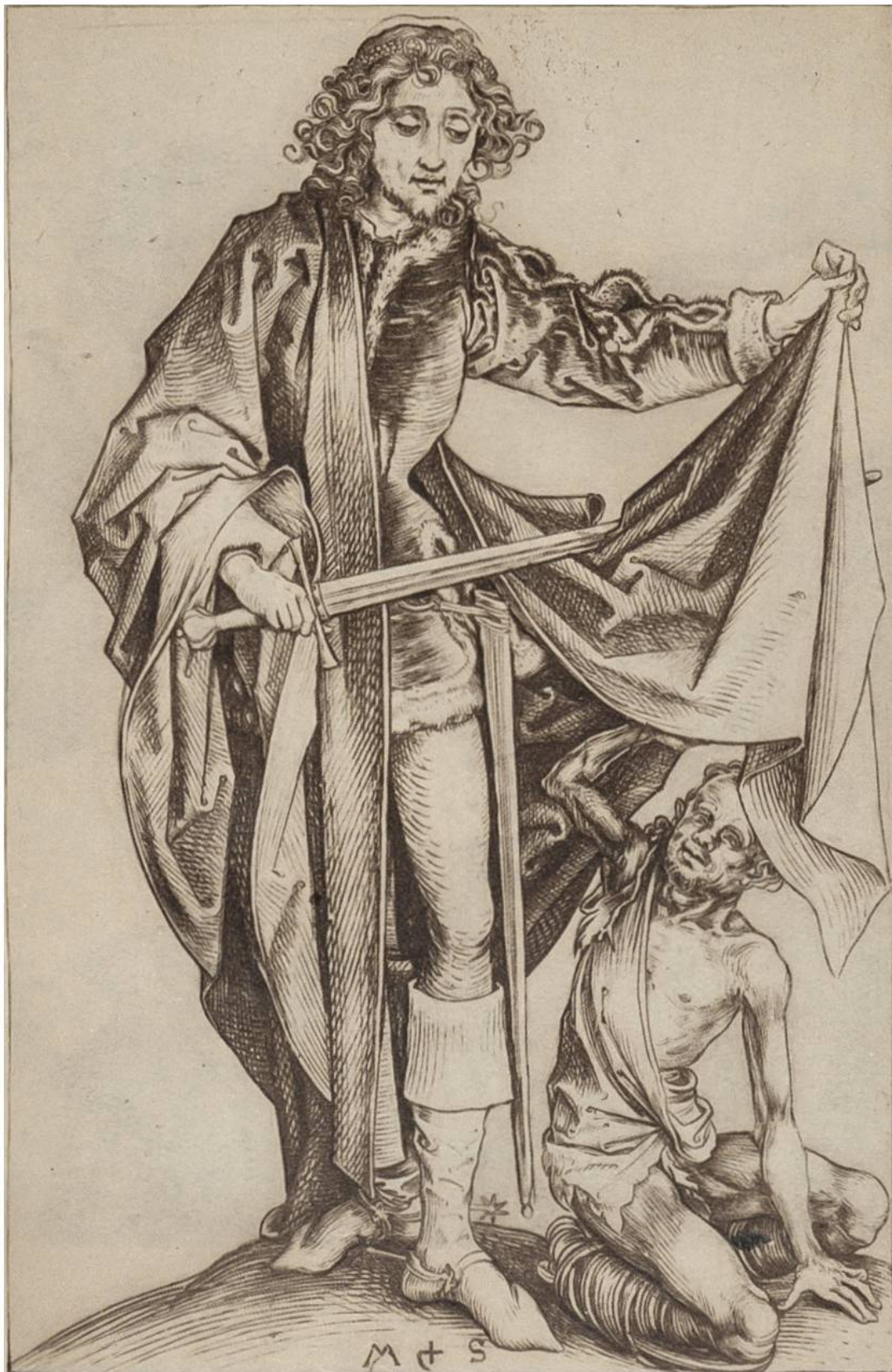
Der hl. Martin von Tours (4. Jahrhundert) schenkt dem Armen ein Stück seines Mantels, Kupfer- stich von Martin Schongauer, Colmar, um 1445-1491.