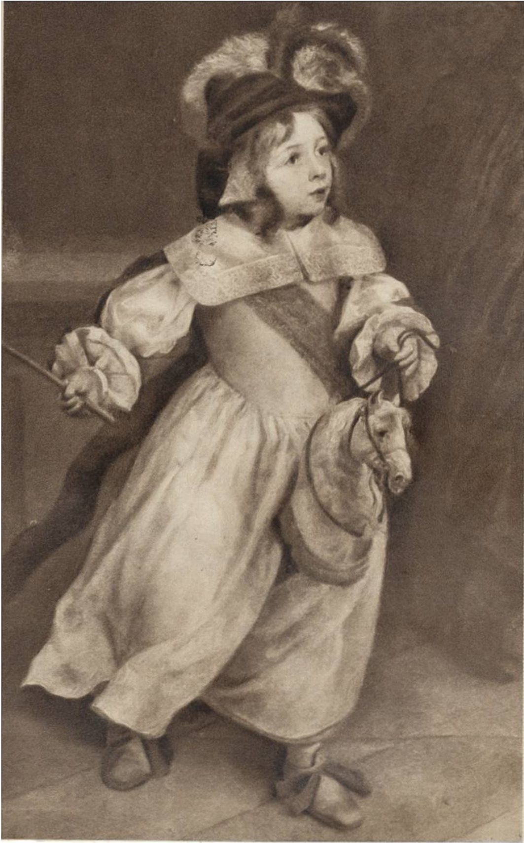
Mädchen mit Steckenpferd, aus einem Familienbild, von Gonzales Coques, Antwerpen, 1614-1684.