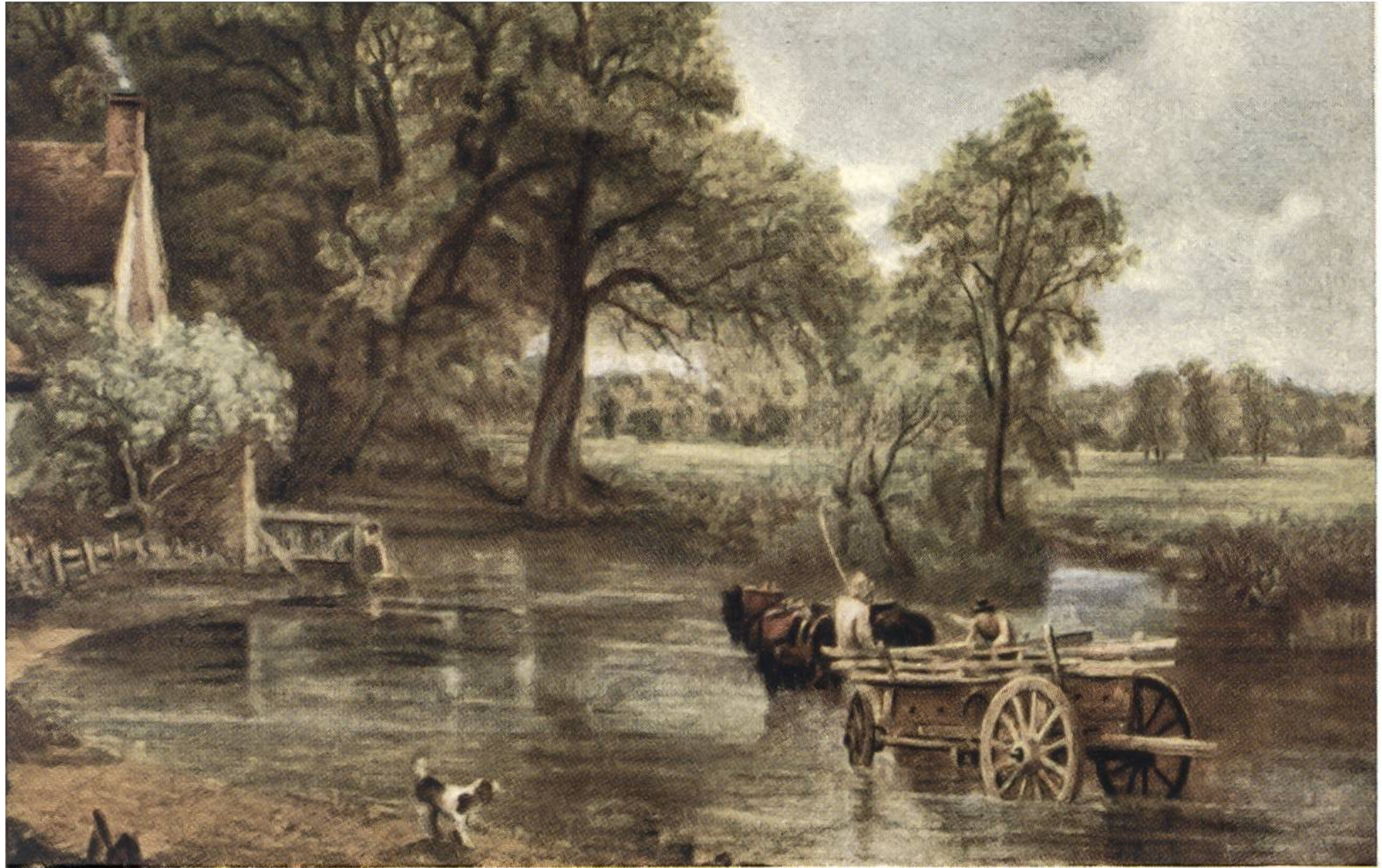
HEUWAGEN, von John Constable, London, 1776—1837.