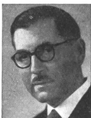
Dr. Karl Kobelt von Marbach (St. G.) * 1891 seit 1941 i. Amte Militärdepartem.