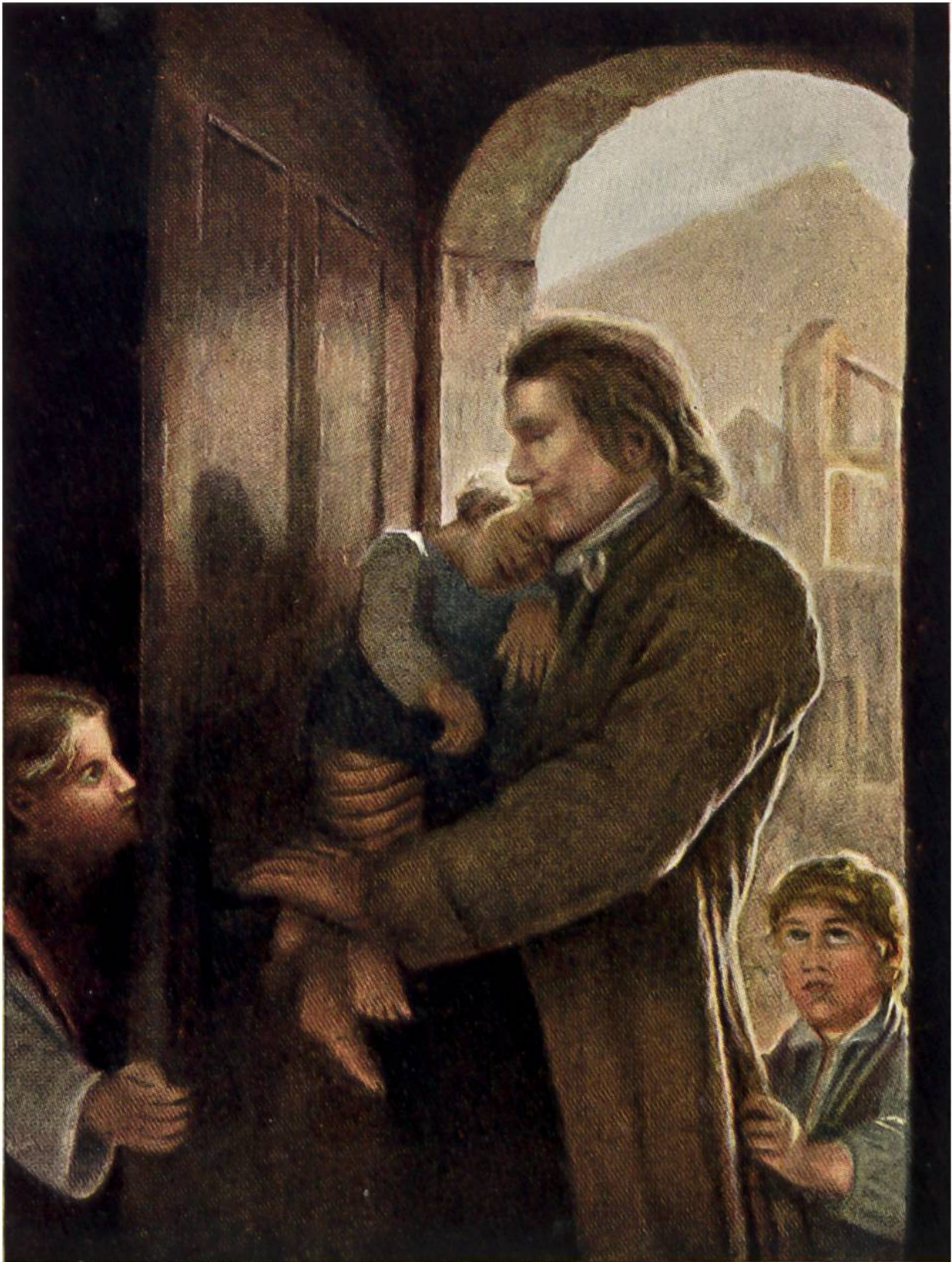
PESTALOZZI IN STANS Gemälde von Albert Anker.