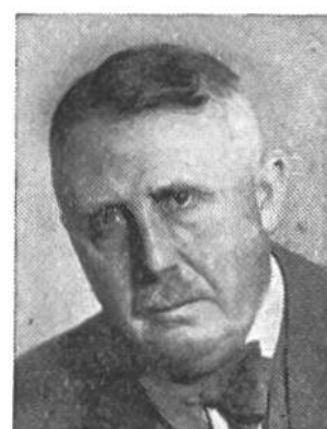
Eduard v. Steiger von Bern * 1881, seit 1941 im Amte Justiz-u. Polizeid.