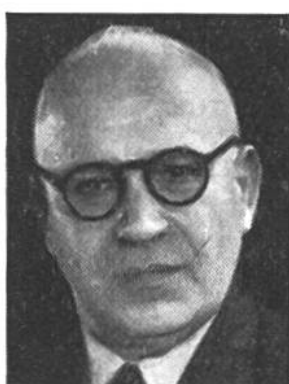
Ernst Nobs von Zürich * 1886, seit 1944 im Amte Finanz-, Zolldep.