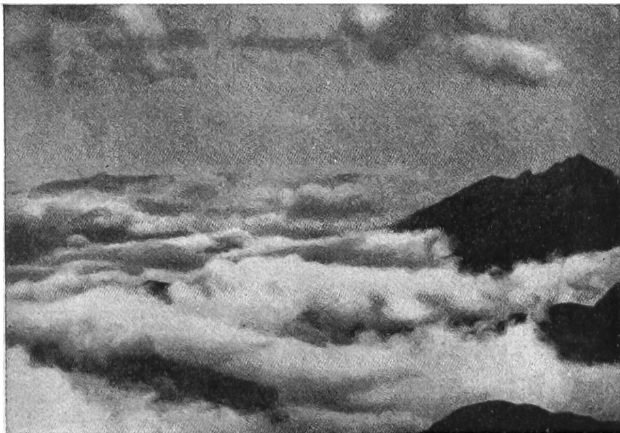
Wolkenmeer in den Bergen.

Wolkenmassen überdeckt; als Klippen ragen die Bergzacken von Fels und Schnee aus der brauenden, wogenden Tiefe. Bewunderung und Andacht erfüllen den Einsamen in diesem grossen Frieden hoch über den hastvollen Städten und in der Nähe des Himmels. Weh ihm aber, wenn er selbst auf unsicherem Pfad von den schleichenden Wolkenfetzen überrascht wird und ohne Sicht als Verirrter den Gefahren der Bergwelt entrinnen muss!