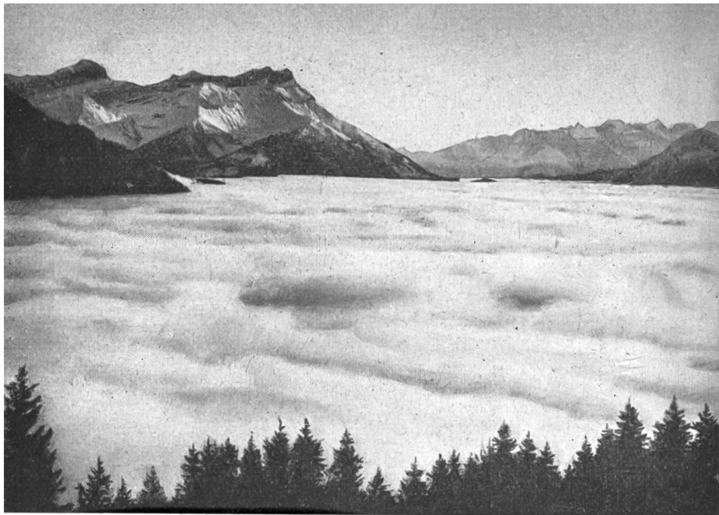
Nebelmeer im Rhonetal. Ausblick von Leysin.