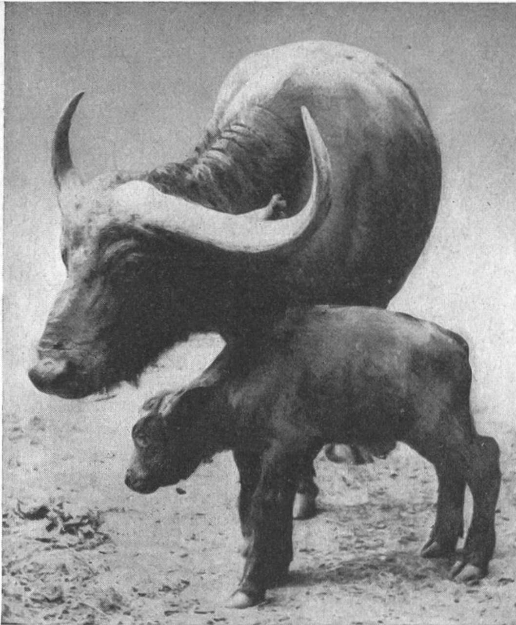
Indische Wasserbüffel-Kuh mit Kalb.

nämlich den Wasserbüffel oder Kerabau, der überall dort gewaltige Bedeutung besitzt, wo Reis angebaut wird. Als ein schweres, gern im Sumpf lebendes Tier eignet sich der Wasserbüffel wie kein anderes Geschöpf zur Bearbeitung der unter Wasser stehenden Reisfelder; aber auch als Zug- und Reittier, als Fleisch- und Milchlieferant leistet er dem Menschen unschätzbare Dienste. Seine Verbreitung erstreckt sich von Japan und Südchina bis nach Ägypten und Oberitalien, wo er überall den Menschen beim Anbau von Reis, diesem überaus wichtigen Nahrungsmittel, unterstützt. H.