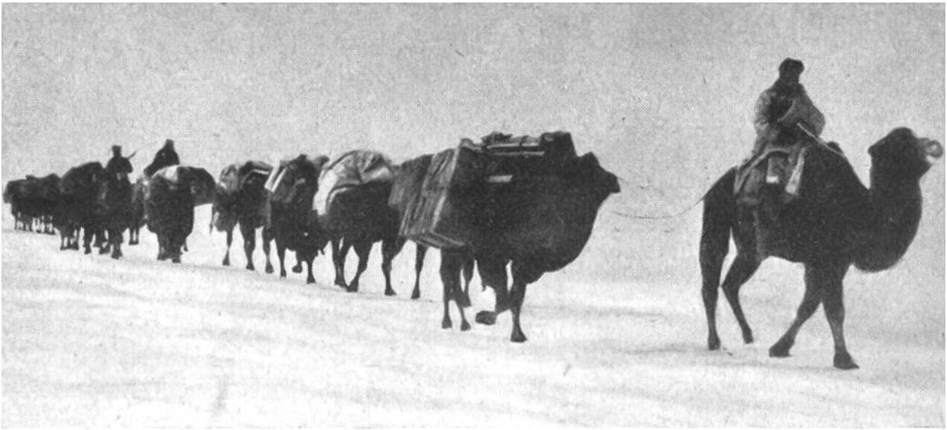
Eine Kamelkarawane durchzieht die endlosen Schneefelder Zentralasiens.