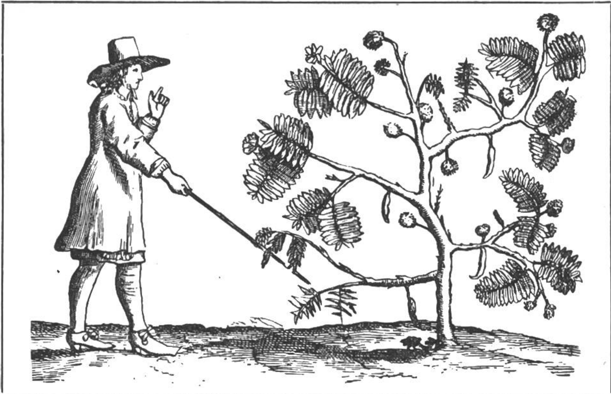
„Die fühlende Pflanze“. Darstellung aus einem holländischen Reisewerk des 17. Jahrhunderts. Der Mann berührt mit einem Stecken einzelne Zweige, deren Blätterwerk sofort verschwindet.