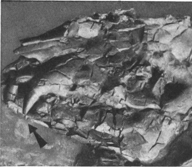
Schädel eines Urpferdchens mit raubtierartigem Eckzahn (Pfeil links unten).

Schwanzquaste eines Urpferdchens erhalten geblieben. Sonst wissen wir über das Äussere, die Behaarung, die Farbe und die Zeichnung des Felles nichts. Von diesen Urpferdchen, zum Teil handelt es sich um noch kleinere Tiere, wurden in der Schweiz bei Gösgen und Egerkingen im Kanton Solothurn und am Mormont im Waadtland ebenfalls zahlreiche Reste, wie Knochen und Zähne, gefunden.