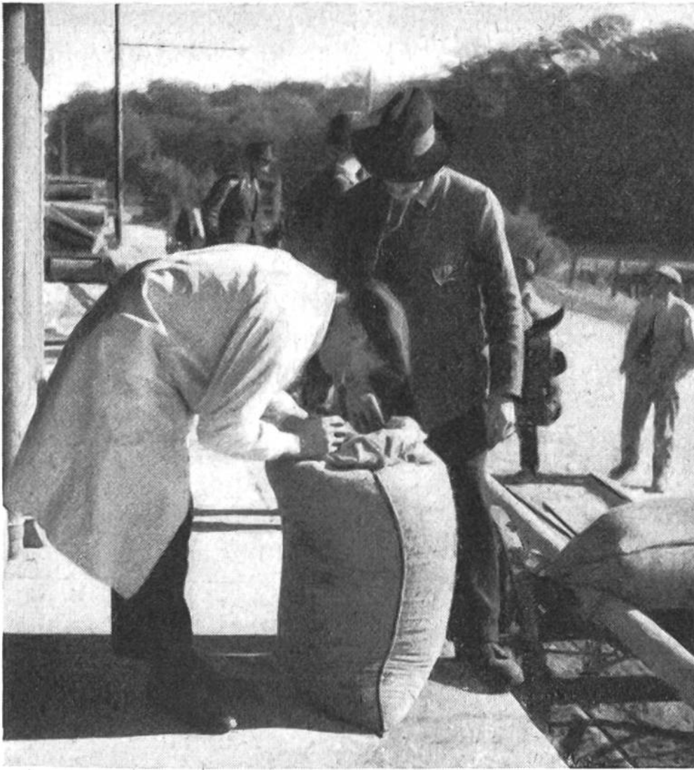
Der Aufkäufer kontrolliert jeden einzelnen Sack, der von den Rapspflanzern abgeliefert wird.

noch grünen Bäckchen der Samen einem samtigen Schwarz gewichen. Jetzt ist die Zeit der Einfahrt da. Die Puppen werden auf eine ausgelegte Blache geworfen und die Gärbchen sorgfältig auf die mit Tüchern ausgeschlagenen Wagen geladen. Die grosse Sorgfalt bei der Behandlung des Erntegutes ist notwendig, weil bei jeder heftigen Bewegung die Schoten aufspringen und die Samen raschelnd zu Boden fallen.