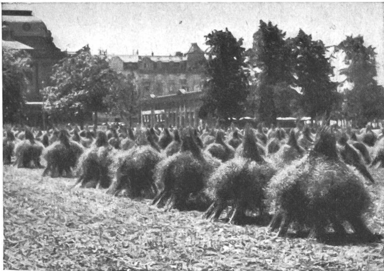
Rapsernte in der Großstadt! Aus Rapsgärbchen erstellte „Doppelhocken“ auf dem alten Tonhalleplatz in Zürich.