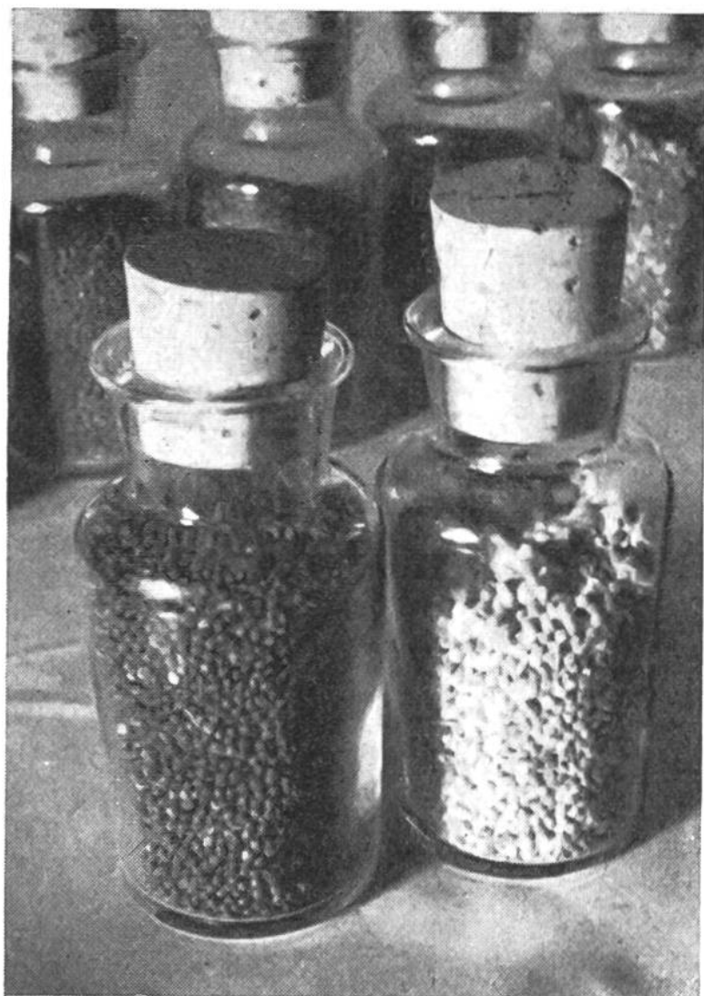
Die dunkle Rapssaat links entspricht den Qualitätsanforderungen; die Probe rechts mit den hellen Samen ist vollständig verschimmelt.

Verlustgeschäft. So war auch die besondere Anbau-, Ernte- und Nachbehandlungstechnik der alten Ölfrüchte allmählich in Vergessenheit geraten. Da die Ölgewächse vor allem während der Ernte- und Trocknungszeit sorgfältig behandelt sein wollen, wurden bei der behördlich angeordneten, starken Ausdehnung des Ölpflanzenbaus im Jahre 1944 landauf, landab Rapserntekurse durchgeführt. Dieser Aufklärungstätigkeit ist es zuzuschreiben, dass dann auch anfangs Juli im ganzen Land ungefähr die gleichartigen Erntebilder zu sehen waren. Der Raps verlangt eine frühzeitige Ernte, da die Schoten in vollreifem Zustand aufspringen und die runden schwarzen Samen mit ihrem kostbaren Ölgehalt auf die Erde kugeln und verloren gehen. Der in der Taufrische gemähte Raps wird in kleine Gärbchen gebunden und zu sogenannten „Puppen“ zusammengestellt. Acht bis zehn Tage später sind die anfangs