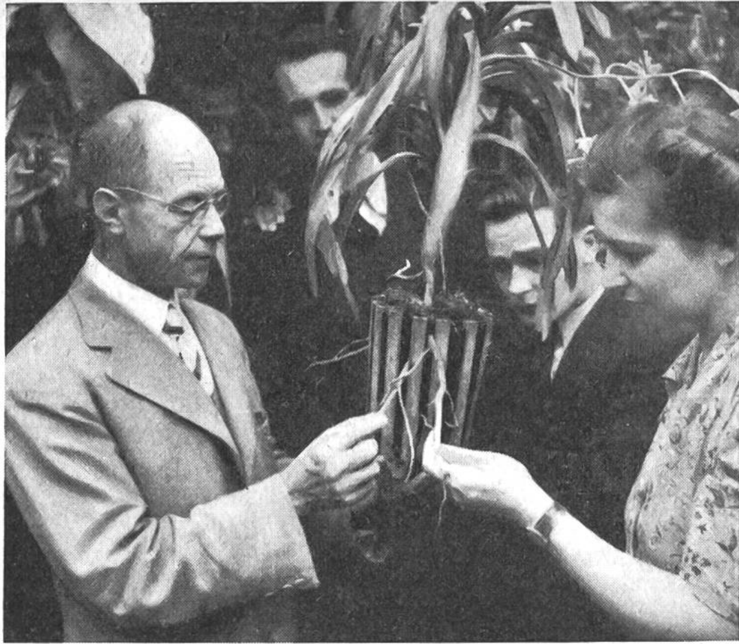
Anschauungsunterricht im Botanischen Garten.

jeder zugeben, dass unsere kleine Schweiz in mancherlei Hinsicht an diesen überseeischen Gebieten ausserordentlich interessiert sein muss. Lebhaftige Handelsbeziehungen bestehen zwischen der Schweiz und jenen fernen Ländern; für mehrere hundert Millionen Franken werden alljährlich über die riesigen Entfernungen Waren ausgetauscht, und schliesslich ist zu berücksichtigen, dass viele schweizerische Forscher, Missionare, Ärzte, Geologen, Lehrer, Ingenieure, Techniker, Pflanze, Sammler usw. in den Tropen tätig sind. Es bestehen also zwischen der Schweiz und den Tropen viele enge und überaus wichtige Beziehungen.