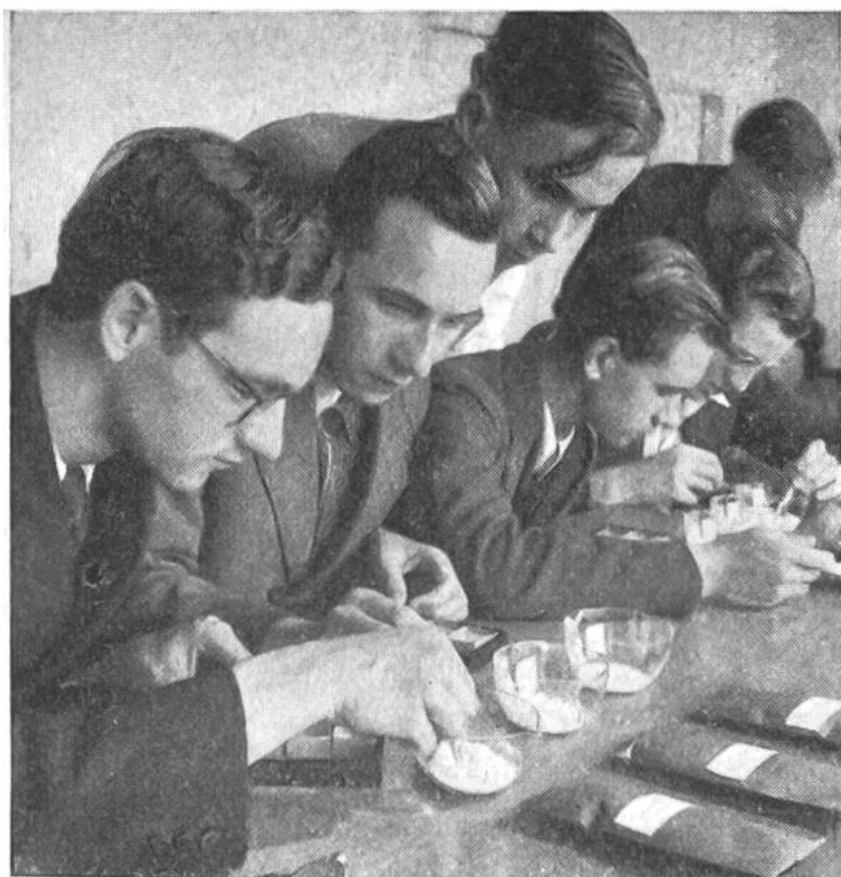
Schüler des Schweizerischen Tropeninstituts erlernen tropische Warenkunde.

zu angepasster Kleidung und Ernährung, zu ganz anderer Lebensweise. Wir sehen uns in den Tropen neuen Krankheiten, fremden Menschenrassen, einer wundersamen Tier- und Pflanzenwelt gegenüber. Es ist klar, dass in dieser eigenartigen, von der unseren so grundverschiedenen Umgebung derjenige grössere Erfolgsaussichten hat, der sorgfältig vorbereitet ist.