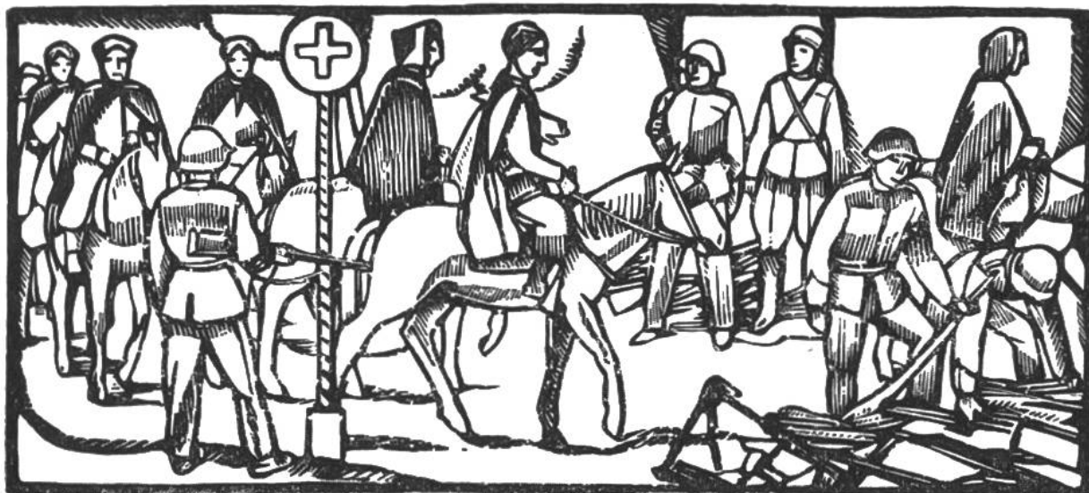
Im Juni 1940 überschreiten nahezu 40 000 alliierte Truppen die Schweizergrenze. Waffenabgabe der Spahis im Berner Jura.

burg. Churchill wird engl. Ministerpräsident. 11.: 2. Generalmobilmachung d. schweiz. Armee. 15.: Holland u. 28.: Belgien kapitulieren. Juni 6.: Beginn der neuen deutschen Offensive gegen Frankreich. 10.: Norwegen kapituliert. 11.: Italien erklärt Grossbritannien u. Frankreich d. Krieg. 14.: Einmarsch deutscher Truppen in Paris. 17.: Russland besetzt nach Litauen auch Lettland u. Estland. 18.–21.: nahezu 40 000 alliierte Truppen überschreiten die Schweizergrenze im Berner Jura. 22.: Waffenstillstand zw. Deutschland u. Frankreich u. 24.: zw. Italien u. Frankreich. Sept. 6.: Abdankung König Carols v. Rumänien zugunsten s. Sohnes Michael. 27.: Abschluss des Drei-Mächte-Paktes in Berlin zw. Deutschland, Italien u. Japan. Nov. 5.: Einmarsch ital. Trupp. in griech. Gebiet. Roosevelt wird zum 3. Mal als Präsident der USA. gewählt. 7.: Beginn der allnächtl. Verdunkelung i. d. Schweiz. 20.–24.: Ungarn, Rumänien u. die Slowakei treten dem Drei-Mächte-Pakt bei. Dez. 6.: Brit. Offensive gegen Libyen (6. Jan. 41 Bardia, 23. Jan. Tobruk erobert).