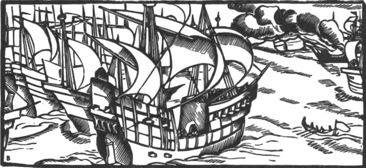
Die Engländer besiegen die mächtige spanische Flotte Armada, 1588.