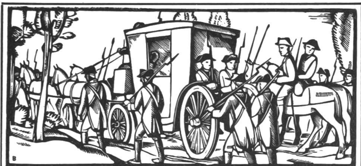
Ludwig XVI. wurde auf der Flucht in Varennes gefangengenommen und mit seiner Familie nach Paris zurückgeführt (1792).