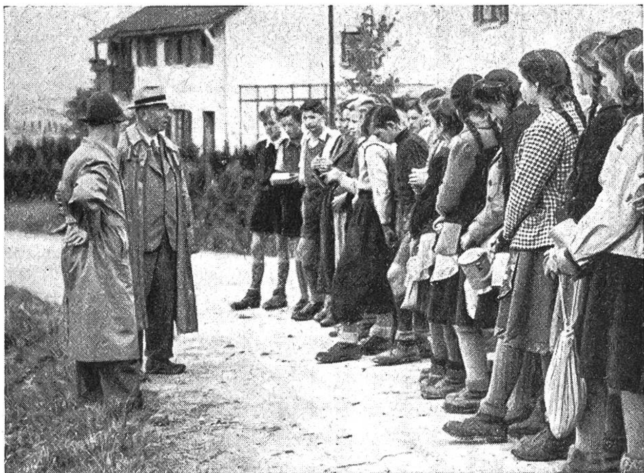
Die Sekundarschülerklasse einer Zürcher Aussengemeinde „einsatzbereit zur Jagd auf den Händöpfelfeind“. Lehrer und Ackerbauleiter geben die letzten Anweisungen.

Stück an die Unterseite der Kartoffelblätter. Nach etwa einer Woche schlüpfen daraus die rotgefärbten Larven, die unter ständigem Fressen innert 14 Tagen bis 12 mm gross werden und sich dann 15—20 cm tief im Boden verpuppen. Nach weitem 10—12 Tagen kriechen die fertigen Käfer aus, und der Kreislauf beginnt von neuem. Infolge dieser ausserordentlichen Vermehrungsfähigkeit und Fressgier des Schädlings können ganze Kartoffelfelder in kurzer Zeit kahlgefressen werden, wenn die Bekämpfung nicht rechtzeitig einsetzt. Die natürlichen Feinde des Kartoffelkäfers, wie die Vögel, die Larven des Marienkäferchens, verschiedene Schreitwanzen usw., richten bei plötzlichem massenhaftem Auftreten des Käfers nicht viel aus.