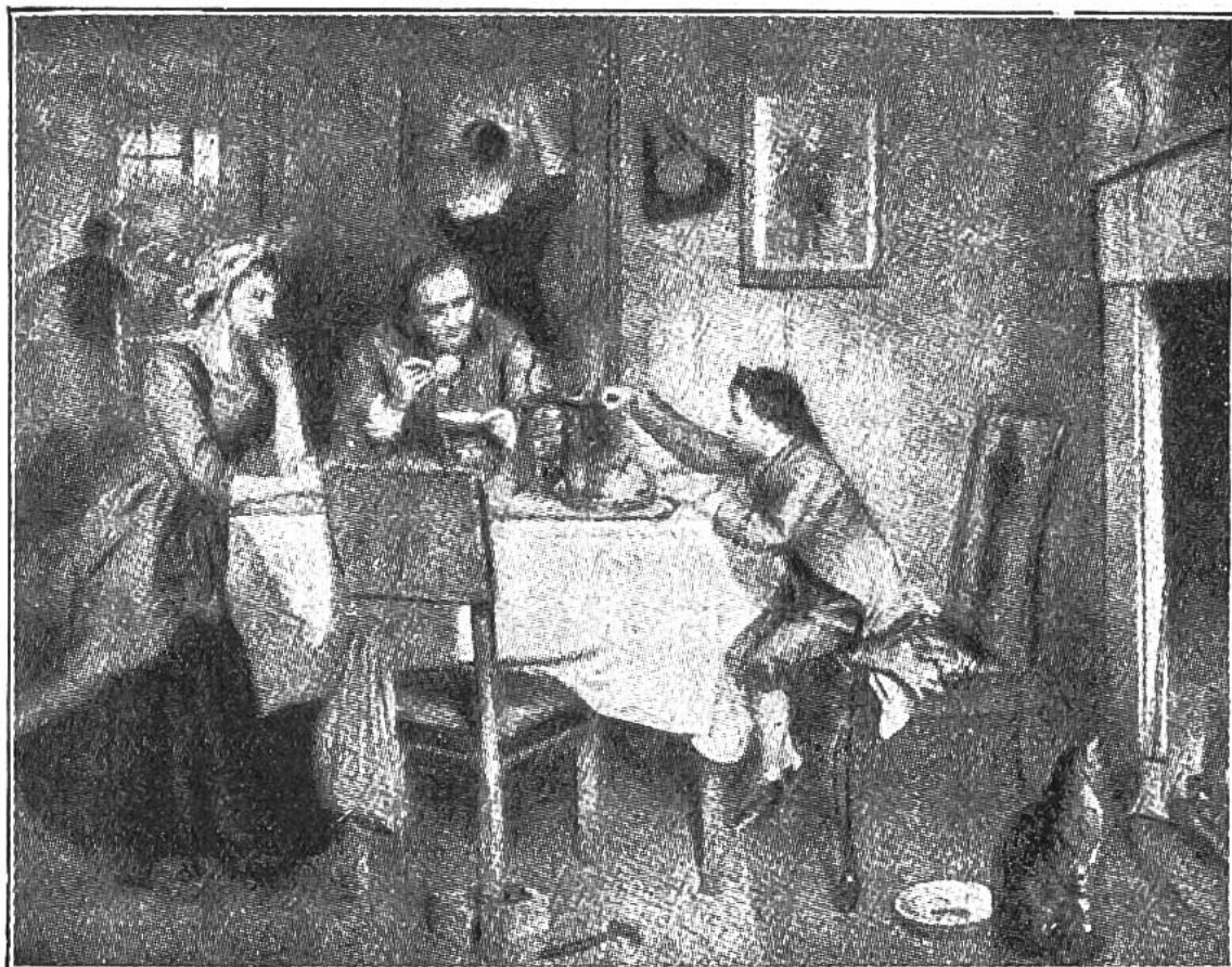
Der Knabe J a m e s W a t t beobachtet den Dampf des Teekessels.