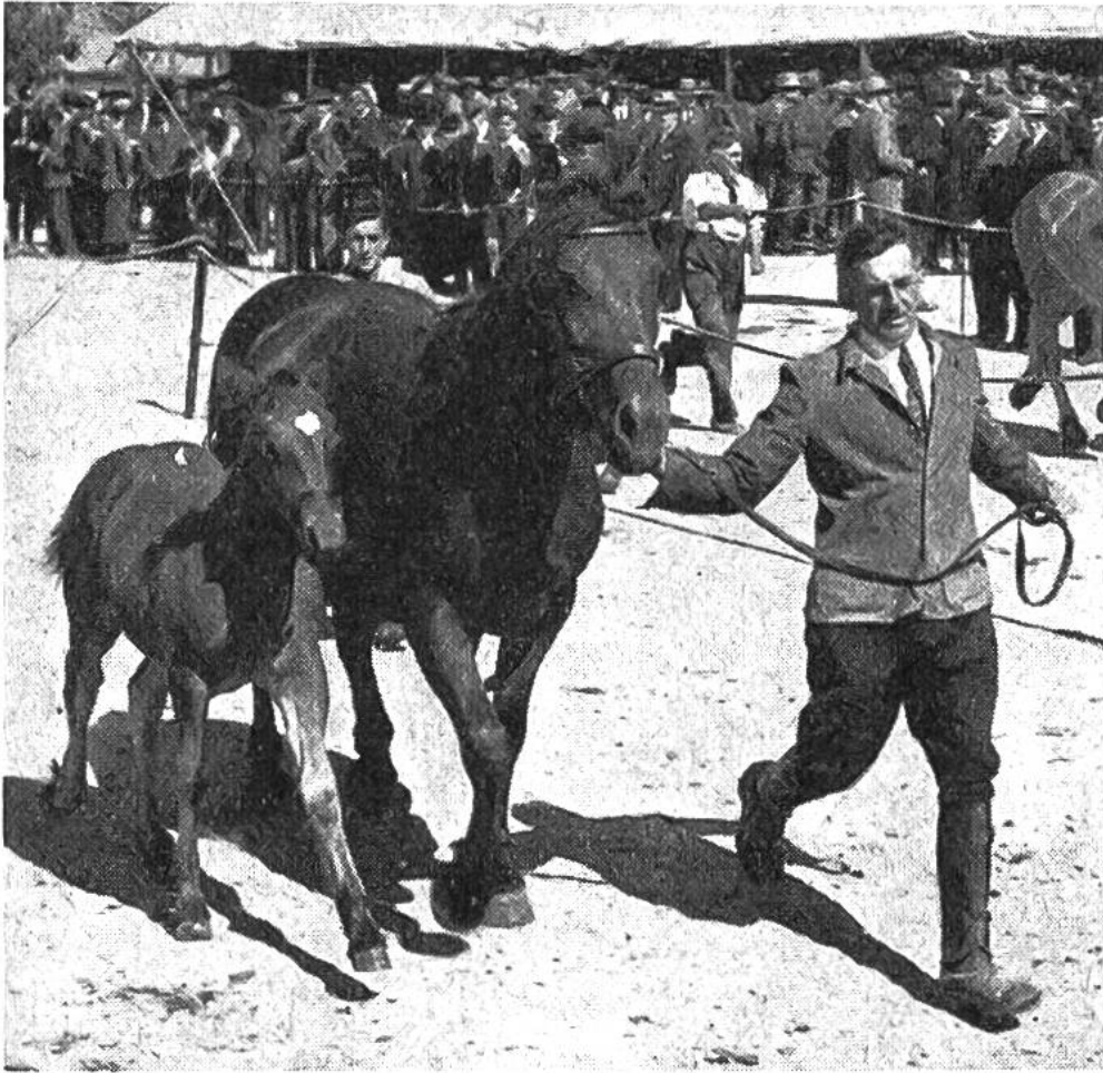
Mutterstute mit Fohlen bei den Vorführungen im Ring. Alle Muttertiere tragen auf der Weide eine Schelle, damit die Pferde besser beisammenbleiben und leichter aufzufinden sind.

Nicht weniger hoch aber steht das Freiburgerpferd auf dem Bauernhofe im Kurs, wo es sich mit seinem muntern, zutraulichen und arbeitsamen Wesen bei Gross und Klein rasch die Herzen erobert und in diesem Kriege wieder viel zur Sicherung unserer Volksernährung aus dem eigenen Boden beigetragen hat. Obwohl in den Städten die Pferdehaltung fast ganz verschwunden ist, zählten wir im Jahre 1943 in der Schweiz nicht weniger als 102 000 Arbeitspferde, ein Beweis dafür, wie sich das heimelige Freiburgerpferd an Stelle des Stadtpflasters allmählich den Bauernhof zu erobern wusste.