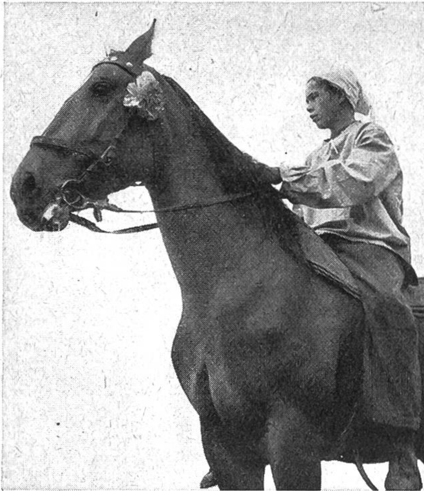
Vor dem Start zum originellen Pferderennen der Bauernbuben, das jeweils von den vielen tausend Zuschauern begeistert verfolgt wird.

du in diese Zusammenhänge ein wenig hineinsiehst. Vielleicht lockt es dich dann auch einmal zu einer Wallfahrt nach dem schön gelegenen Saignelégier droben in den Freibergen, wo jedes Jahr um Mitte August die schönsten Pferde des Landes in der Nationalen Pferdeaussstellung bewundert werden können. An diesem Fest- und Ehrentage des Jura-pferdes zählte man schon über 30 000 Besucher aus allen Schweizerkantonen, was deutlich zeigt, wie gross das Interesse für die Fortschritte in unserer Pferdezucht ist. Sicher wirst auch du deine stille Freude haben an den hübschen, zutraulichen Tieren im Stall oder auf der freien Weide, die gerne ihre seidenweichen Nüstern an deiner Schulter reiben oder neugierig und naschhaft an deiner Tasche schnuppern.