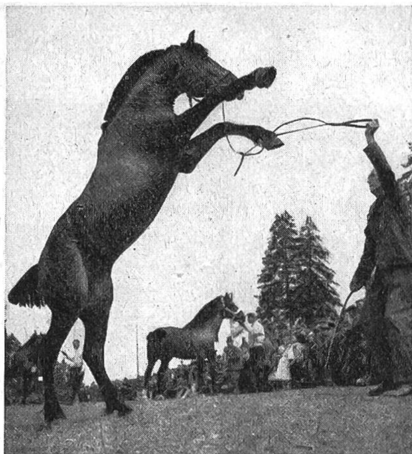
Nationaler Pferdemarkt in Saignelégier. Hier führt ein Züchter seinen stolzen Hengst in einer stilgerechten „Levade“ vor.

Rindviehzucht. Chronisten erzählen, dass z. B. während des Dreissigjährigen Krieges (1618—1648) jährlich viele tausend Pferde ausser Landes verkauft wurden. Noch im Winter 1830/1831 exportierte allein der Kanton Bern gegen 10 000 Pferde nach Frankreich für die Gendarmerie und die Bespannung des Armeetrains. Dass die Pferdezucht einst allgemeiner verbreitet gewesen sein musste als heute, bezeugen noch viele Berg- und Flurnamen, wie Rossberg, Füllweid, Rosstränke, Rossboden usw.