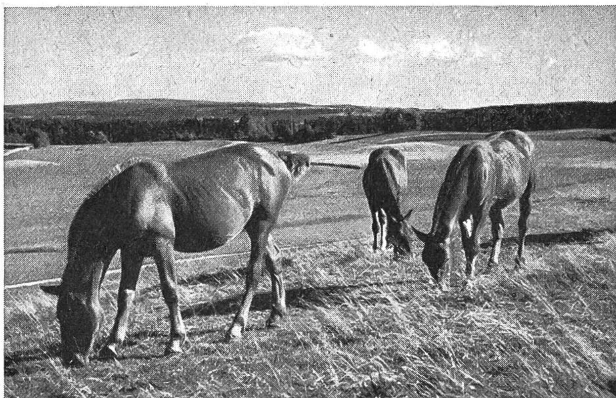
Ein Stimmungsbild aus den Freibergen. Fohlen auf der Weide.