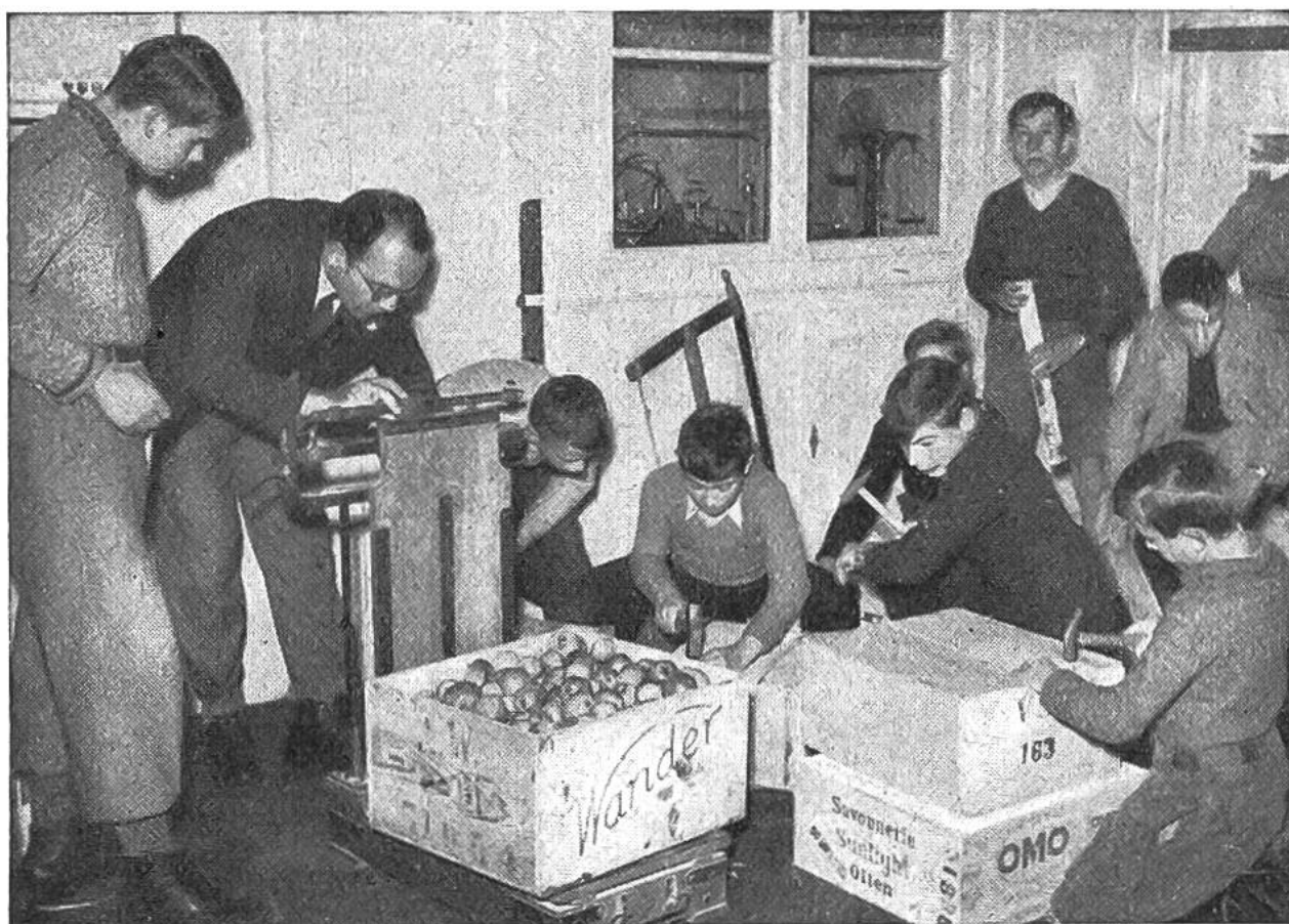
Der Lehrer wägt die Kisten, und die Schüler nageln sie zu.

Dann gab es in den Schulstunden viel Neues: Der Lehrer erklärte uns, was ein Frachtbrief sei, wie die Äpfel auf der Bahn umgeladen und dann mit dem Fuhrwerk von der Station nach Flühmatten gebracht würden. Wir schrieben auch Briefe an die Schüler, damit diese wüssten, von wem die Äpfel kämen und dann war es so weit. Wir konnten vor Ungeduld kaum auf den Bänken sitzen, bis der Lehrer mit uns abgemacht hatte, wer die Äpfel abholen, wer sie verlesen und einpacken, und wer sie zur Bahn bringen sollte.