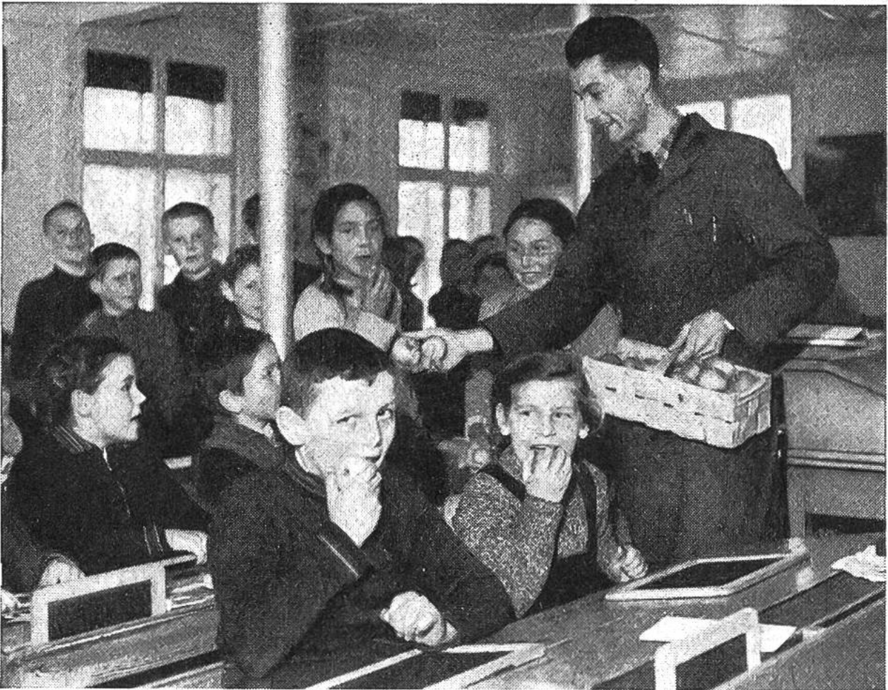
Die Kinder aus Flühmatten schrieben den Spendern im Unterland: „Wir freuen uns den ganzen Morgen auf die Pause“.

Schule“ und erzählten von den Feldern und Tieren, die wir haben und die wir besorgen helfen. Einmal schickten uns die Schüler von Flühmatten ein Bild ihrer Schule, das hängt jetzt in unserem Zimmer. Wir kennen uns schon gut dort oben aus, und vielleicht werden wir im Sommer sogar eine Schulreise dorthin machen.