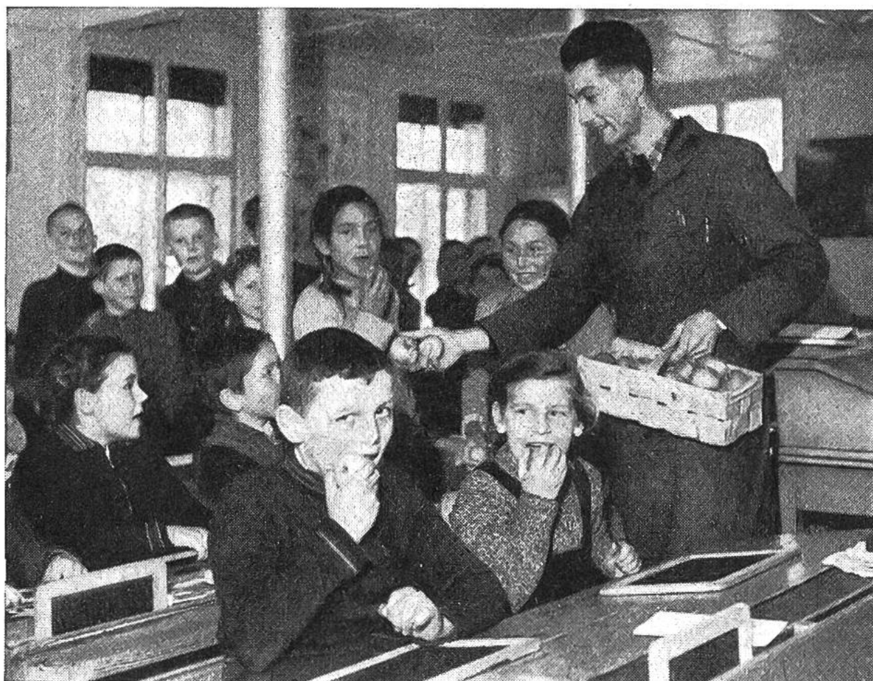
Die Kinder aus Flühmatten schrieben den Spendern im Unterland: „Wir freuen uns den ganzen Morgen auf die Pause“.

Schule“ und erzählten von den Feldern und Tieren, die wir haben und die wir besorgen helfen. Einmal schickten uns die Schüler von Flühmatten ein Bild ihrer Schule, das hängt jetzt in unserem Zimmer. Wir kennen uns schon gut dort oben aus, und vielleicht werden wir im Sommer sogar eine Schulreise dorthin machen.