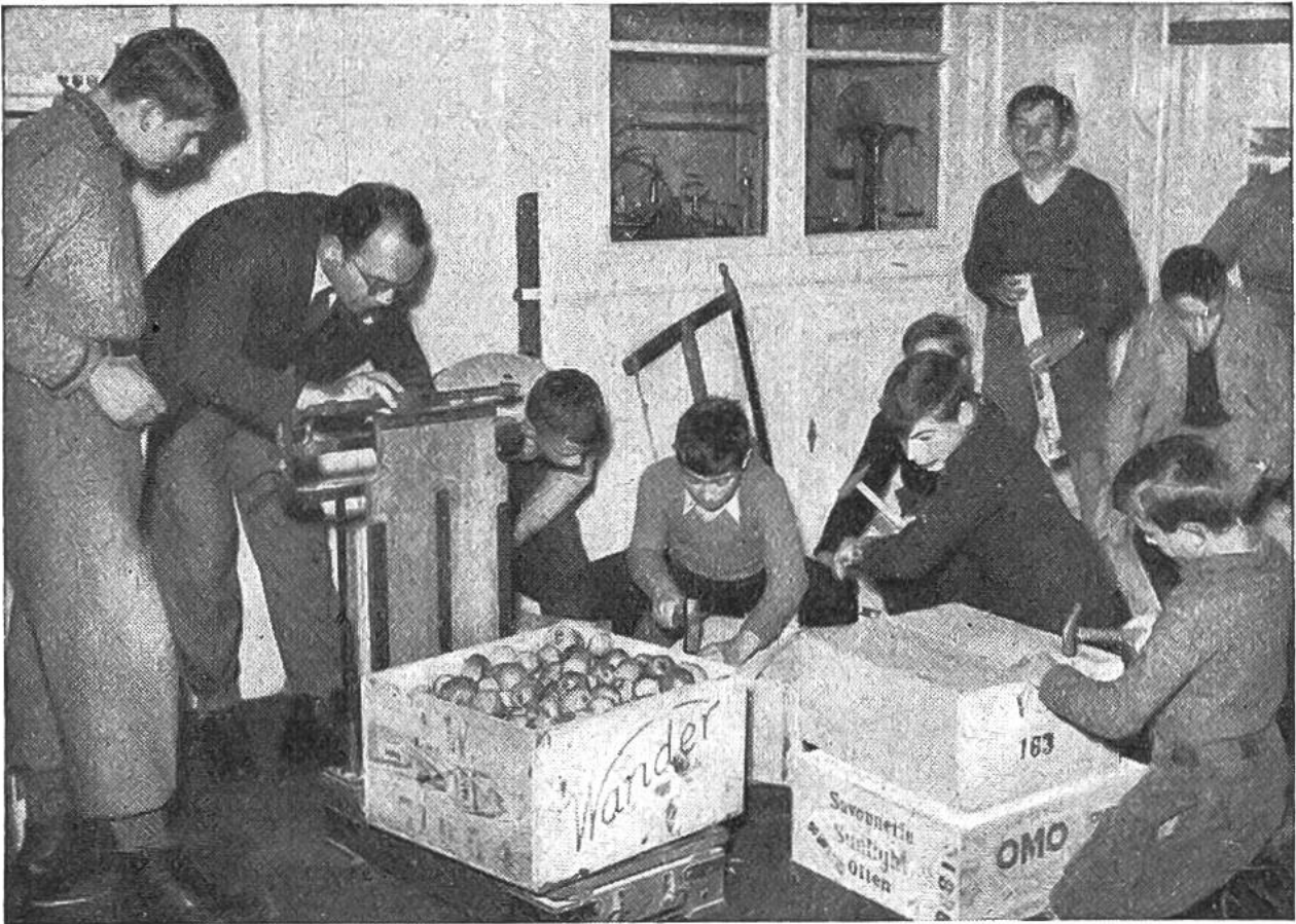
Der Lehrer wägt die Kisten, und die Schüler nageln sie zu.

Dann gab es in den Schulstunden viel Neues: Der Lehrer erklärte uns, was ein Frachtbrief sei, wie die Äpfel auf der Bahn umgeladen und dann mit dem Fuhrwerk von der Station nach Flühmatten gebracht würden. Wir schrieben auch Briefe an die Schüler, damit diese wüssten, von wem die Äpfel kämen und dann war es so weit. Wir konnten vor Ungeduld kaum auf den Bänken sitzen, bis der Lehrer mit uns abgemacht hatte, wer die Äpfel abholen, wer sie verlesen und einpacken, und wer sie zur Bahn bringen sollte.