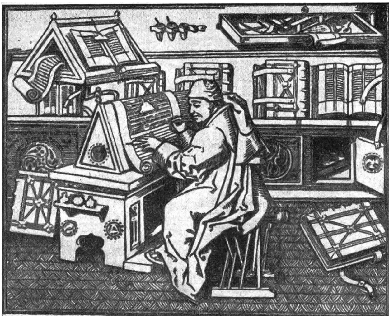
Mittelalterliche Schreibstube. Jean Mielot, Sekretär von Philipp dem Guten, Herzog von Burgund, schreibt auf eine Pergamentrolle. Über dem Schreibtisch ist eine Art Leseputel angebracht, auf dem das zur Abschrift oder zum Nachschlagen bestimmte Buch steht. Abbildung aus der im Jahre 1456 im Haag von Mielot verfassten Handschrift.

geführt habe. Allein um das neue Testament (278 Blätter) abzuschreiben, brauchte ein Mönch ein halbes Jahr. Die Bücher hatten damals viel grösseren Wert als heutzutage; im Mittelalter wurden die höchsten Buchpreise verlangt. So kostete beispielsweise im 12. Jahrhundert eine Ausgabe der Werke des römischen Geschichtsschreibers Titus Livius 120 Goldkronen, gerade soviel, wie man damals für ein ansehnliches Landgut anlegen musste.