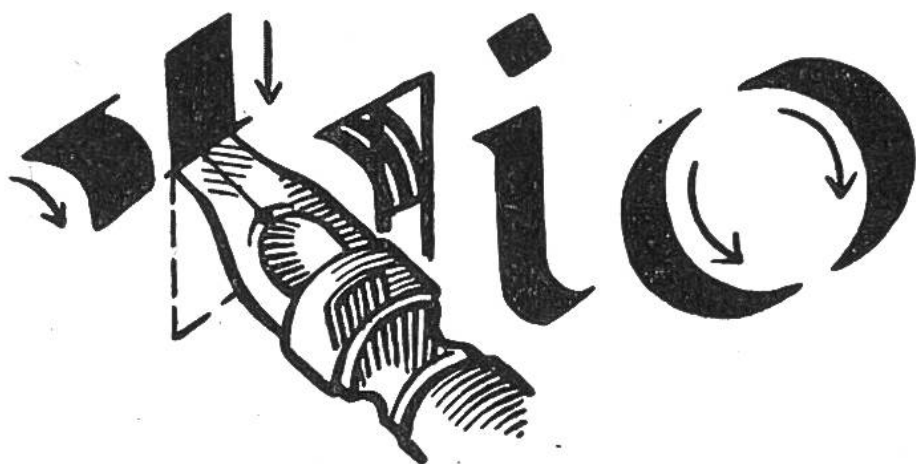
Federhaltung beim Schreiben mit Soennecken- Schreibfedern.

Durch die richtige Führung der schräggestellten Breitfeder wird eine formklare und schwungvolle Lateinschrift erreicht. Die unten gezeigte Federstellung ist einzuhalten. Ohne Druck und ohne besondere Anstrengung erzielt man die gleichmässige Abwicklung eines runden O oder den Schwung eines S.