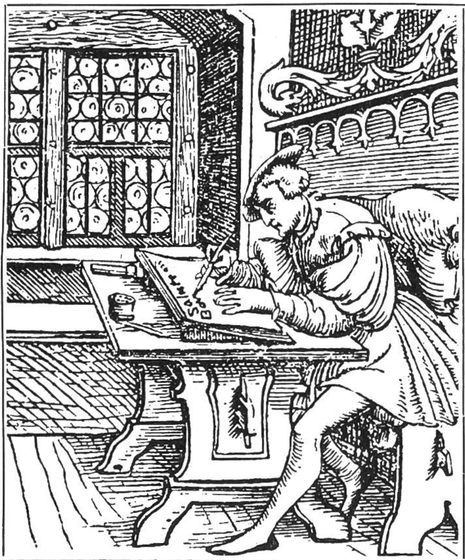
Schreiber an der Arbeit. Holzschnitt aus dem 16. Jahrhundert.

Engelberger Schreibstube unter dem Abt Frowin (1143—87) entfaltete eine fruchtbare künstlerische Tätigkeit. Die Buchmaler des Klosters Einsiedeln pflegten besonders die farbige Ausschmückung der handgeschriebenen Bücher. Die Anfangsbuchstaben einer Seite oder eines Kapitels wurden immer mehr hervorgehoben. Das blieb nicht ohne Einfluss auf die spätere Rechtschreibung. Das Großschreiben der Anfangsbuchstaben, das in andern europäischen Schriften nicht angewendet wird, ist auf jene Sitte zurückzuführen. Unter den mittelalterlichen Schreibstätten und Bibliotheken der Stadt und Landschaft Zürich nahmen das weltliche Chorherrenstift zum Grossmünster in Zürich und die Benediktinerabtei zu Rheinau durch hervorragende Leistungen den ersten Platz ein.