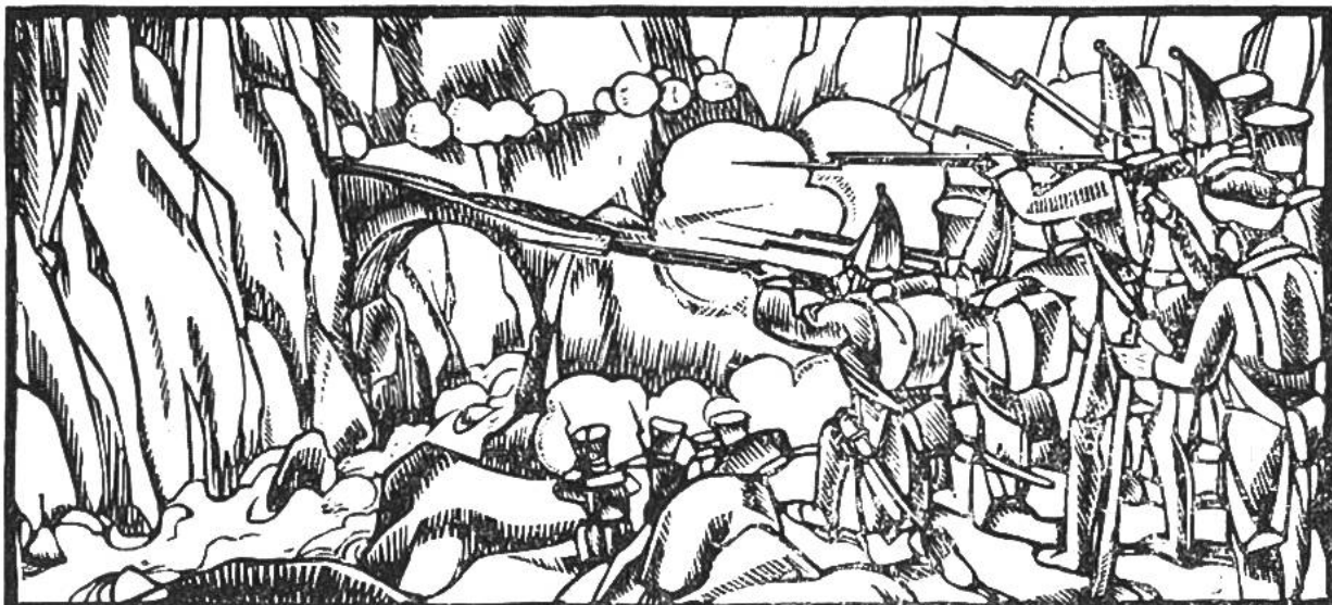
Gefecht bei der Teufelsbrücke nach der Überschreitung des Gotthardpasses durch 25 000 Russen unter Suworow, 1799. Die Schweiz wird zum Kampfplatz fremder Armeen: Russen, Österreicher, Franzosen.