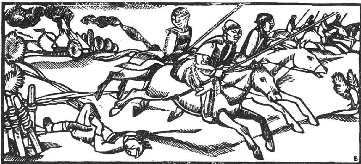
Mongolenvölker dringen in Europa ein.