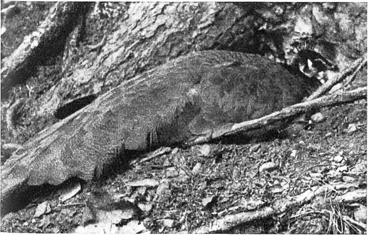
Brütende Pfauhenne. Das einfache Braun und Grau ihres Gefieders ist eine ausgezeichnete Schutzfärbung, so dass sich der Vogel kaum von der Unterlage abhebt.

sich keinen Horst hoch oben über den Boden, um ihre grossen Eier hineinzulegen, sondern legt sie irgendwo zwischen dürren Blättern und vermodernden Zweigen auf die blosse Erde, mit Vorliebe am Fusse dicker Baumstämme zwischen starken Wurzelabzweigungen.