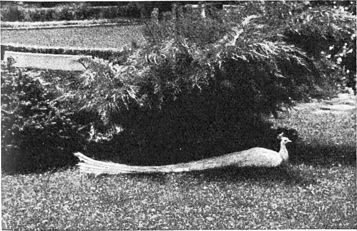
Weisser Pfau, in der Deckung und im Schatten eines Strauches mit angezogenen Beinen ruhend.