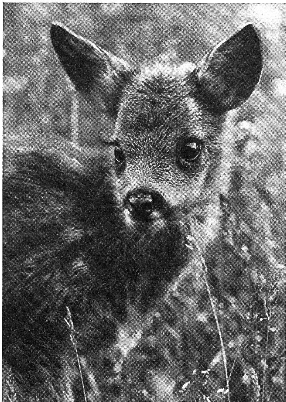
R e h k i t z im Alter von einigen Wochen.

der Flasche aufgezogene Rehböcke werden in einem bestimmten Alter ohnehin lästig, weil sie dann regelmässig selbst auf ihre vertrautesten Pfleger Angriffe unternehmen. Das liegt in ihrem Wesen begründet und hat mit Bösartigkeit nichts zu tun. Solche Böcke, die mitunter recht gefährlich werden können, müssen unter Umständen abgetan werden.