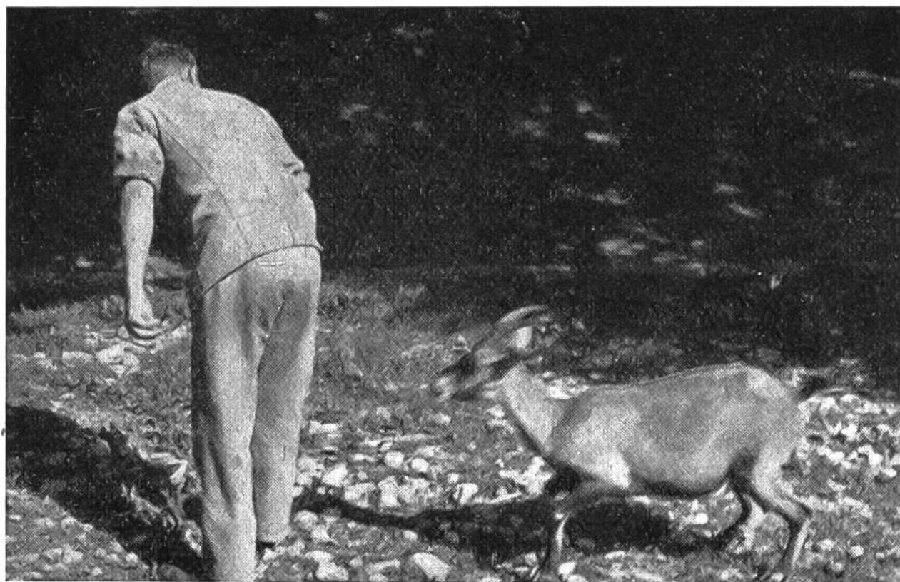
Die zahme Steingeiss nimmt einen Anlauf ....

waffnet betreten werden. Auch dann noch richtet sich der herrliche Bock gelegentlich vor dem Wärter hoch auf, wie er das sonst vor seinen vierbeinigen Rivalen zu tun pflegt, und umtanzt ihn drohend, so dass die Zuschauer ihre helle Freude haben. Häufig nimmt das kampflustige Tier den Besen auf die Hörner oder lässt seine Kraft an dem soliden Einräderkarren aus, wenn ihn der Wärter bei der Reinigung des Geheges kurze Zeit aus den Augen lässt. Im Gegensatz zu den Böcken sind die Geissen, die Weibchen des Steinwildes, sanft und liebenswürdig. Zutraulich kommen sie dem Pfleger entgegen, um sich am Bauch oder hinter den Ohren kraulen zu lassen. Oft sind sie so spiellustig aufgelegt, dass sie dem Wärter plötzlich von hinten her auf die Schulter springen, was ihnen offensichtlich ein ganz besonderes Vergnügen bereitet. Geradezu reizend sind die Kitze, die schon kurz nach ihrer Geburt mit verblüffender Sicherheit auf den steilsten Felszinnen herumhüpfen und selbst im übermütigsten Spiel niemals den Tritt verfehlen. Oft kommt es die Jung-