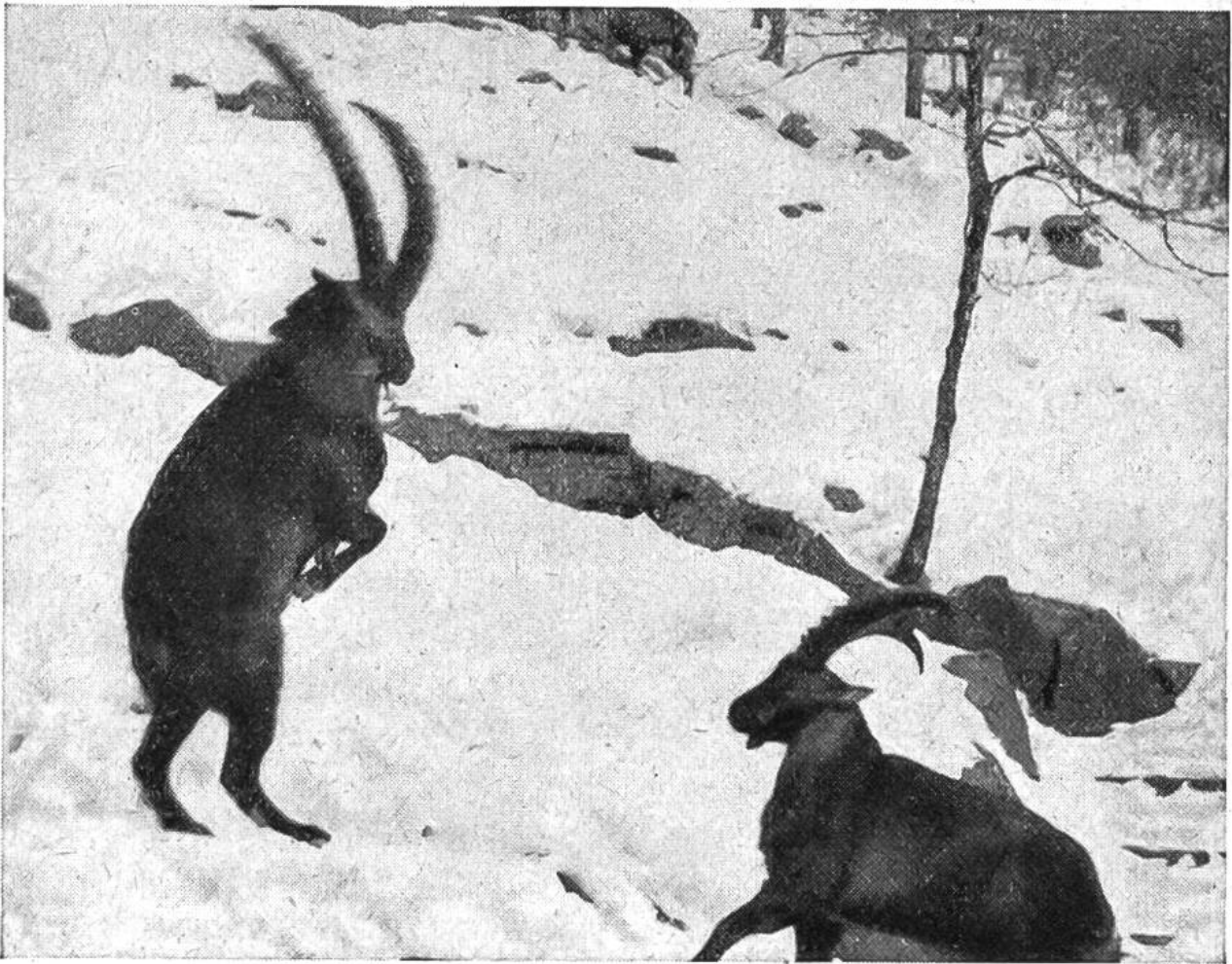
Um seinem Gegner zu imponieren, holt der überlegene Steinbock in übertriebener Weise zum Schlag aus und richtet sich dabei auf den Hinterläufen hoch empor.

schutzbund beteiligte, blieb nicht aus: Heute leben in rund 10 verschiedenen Kolonien etwa 800 Stück Steinwild auf schweizerischem Boden. Es darf daher mit Freude und Genugtuung festgestellt werden, dass das Steinwild für unser Land endgültig gerettet ist, sofern zu dem vorhandenen Bestand Sorge getragen und er durch Gründung weiterer Kolonien gegen drohende Rückschläge gesichert wird.