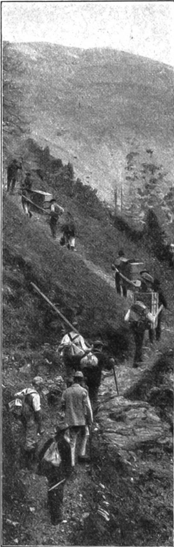
Einer der ersten Transporte von Steinwild zur Aussetzungsstelle.

weise dauerte es jedoch eine ganze Weile, bis der gute Wille in die Tat umgesetzt werden konnte; denn der Wiederaufbau eines Wildbestandes ist weit schwieriger als seine Zerstörung.