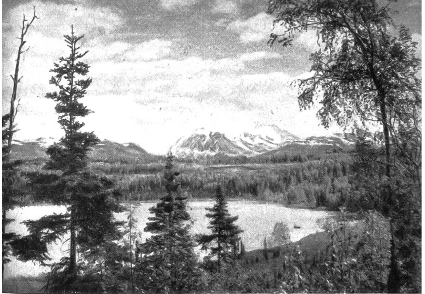
Alaska-Landschaft: ein Paradies für Touristen, südlich des Mount Mc. Kinley im Naturschutzpark.