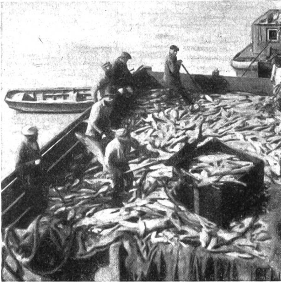
Ein Lachs- fährboot bringt die reiche Beute zur Konser- venfabrik.

gesetztes Dasein. Der grösste und einträglichste Erwerbszweig ist der Fang von Lachs in den grossen Flussläufen, sein Konservieren und der Transport in die ganze Welt über den Seehafen Seward. Ungefähr 25 000 zugewanderten Arbeitern verschafft diese Tätigkeit in den Sommermonaten Lebensunterhalt. Manch einer der ursprünglich nicht ansässigen Leute mag späterhin seine Zelte für immer im Lande aufgeschlagen und sich mit Jagd und etwas Ackerbau befassen haben. In den unendlich weiten Wäldern und Moos-Tundren herrscht Überfluss an Wild, an Bären, Füchsen, Mardern, Bibern und Ottern. Den Wagemutigen und Abenteuerlustigen lockt reiche Jagdbeute an kostbarem Pelzwerk. Nicht minder verlockend wirkte um die Jahrhundertwende die Kunde von Goldfunden, die plötzlich ein Auswanderungsfieber in Amerika und Europa auslöste. Selten aber lohnten sich die harten Strapazen in diesem nördlichen Lande mit seinen strichweise sehr kalten Wintern ( -60^{\circ} ) und heissen kurzen Sommern ( +35^{\circ} ). Tausende von Goldsuchern sind dem mörderischen Alaskawinter zum Opfer gefallen.