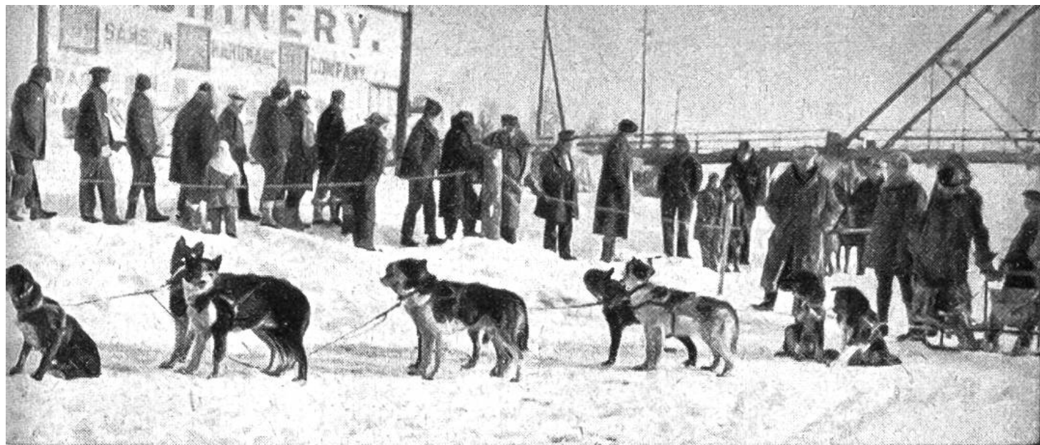
Start zu einem Hundeschlitten-Rennen in Fairbanks.

grösser als die Schweiz, ist im Jahre 1917 zum Naturschutzpark erklärt worden. Der höchste Berg Nordamerikas, der gewaltige Mount Mc. Kinley von 6240 Meter Höhe, der 6050 Meter hohe Logan, der 5977 Meter hohe Saint-Elie, die Gletscherwelt, die wilden, breiten und langen Flussläufe, die Seen und die unendlichen Nadelholzwälder und Tundren bieten dem Forschungsreisenden unausschöpfbares Wandergebiet. In den eisfreien Monaten verkehrt auf dem Flusse Yukon ein Raddampfer, der als „schwimmendes Spital“ dient. Oft werden Schwerkranke und Verunglückte mit dem Flugzeug nach diesem Lazarett gebracht.