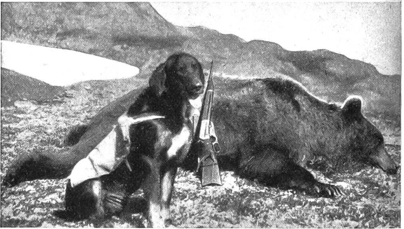
Nach einem erfolgreichen Jagdtag in der Alaska-Wildnis.

grössten Wetter- und Landungsschwierigkeiten zu meistern. Neuerdings liessen die Vereinigten Staaten ausser der schon bestehenden Eisenbahnlinie von Seward nach Fairbanks weitere Bahnstrecken und eine 2600 km lange Autoheerstrasse anlegen. Wir begegnen in der Alaskawildnis ausserdem elektrischen Anlagen und Telephonleitungen.