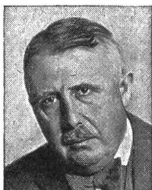
Eduard v. Steiger von Bern * 1881, seit 1941 im Amte Justiz-u. Polizeid.