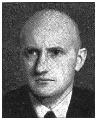
Philipp Etter von Menzingen (Zug) * 1891, seit 1934 i. Amte Dep. des Innern