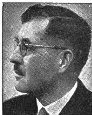
Dr. Karl Kobelt von Marbach (St. G.) * 1891, seit 1941 i. Amte Militärdepartem.