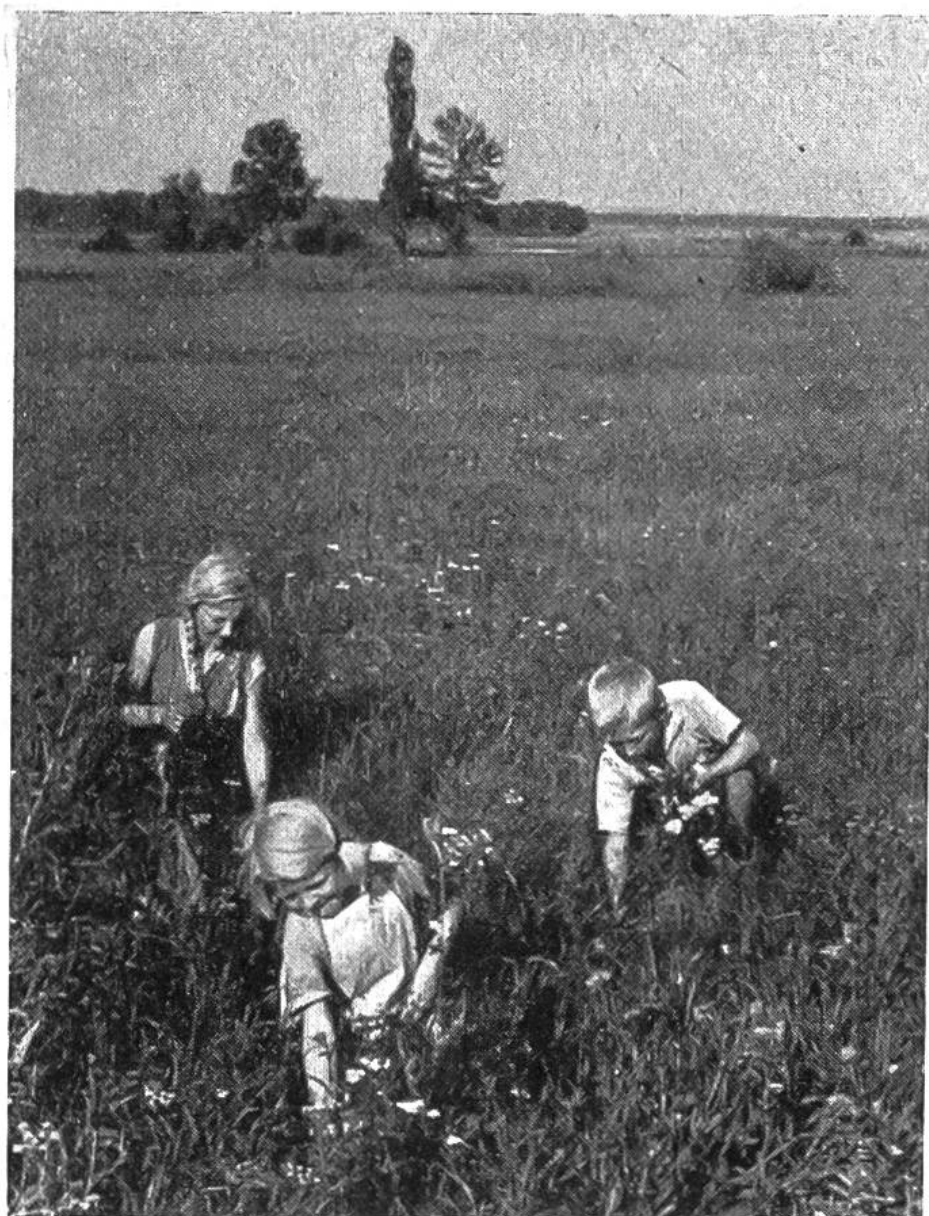
Das Sammeln wildwachsender Heilpflanzen ist eine dankbare Beschäftigung.