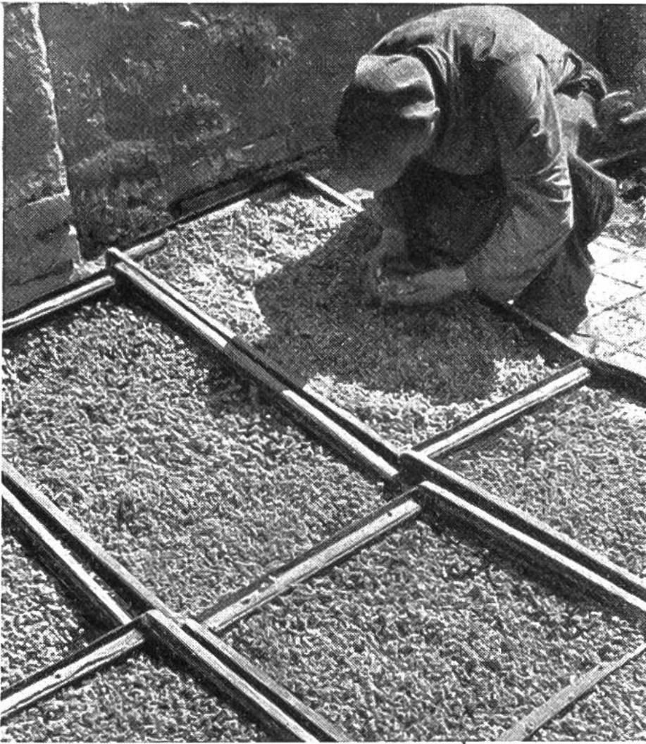
Trockenhurden sind an der Sonne ausgelegt. Durch öfteres Wenden wird die Trocknung beschleunigt.

wird der Mutter durch Anpflanzung von Heilpflanzen und Teekräutern viel Freude bereiten.