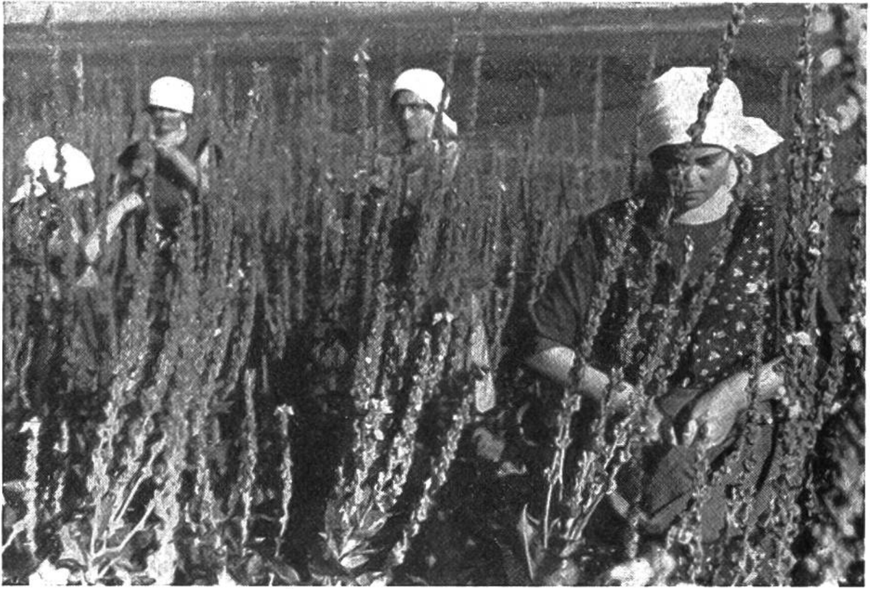
Königskerzenblüten müssen während der Blütezeit jeden Morgen abgezapft werden.

lichen Drogen ernsthaft gefährdet. Hier öffnet sich nun ein weites und dankbares Feld für hilfsbereite Buben und Mädchen, die sich mit ihrer Arbeit für die Gesundheit ihrer Familie und des ganzen Schweizervolkes einsetzen wollen.