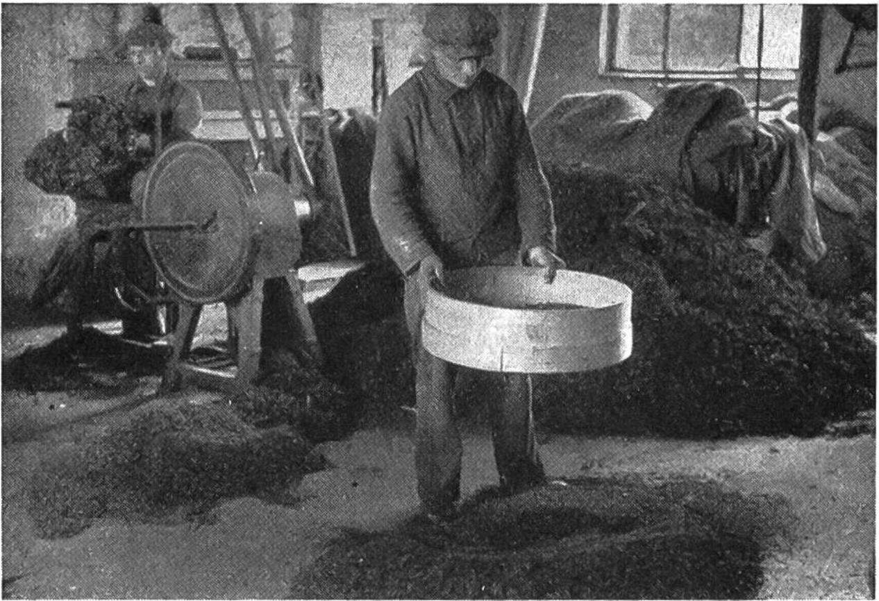
Zerkleinern und Reinigen der Drogen geschieht im Grossbetrieb durch Maschinen.

mian, Eibisch und Liebstöckel. Für die Beschaffung von Pfeffermünzstecklingen sind wir auf gute Kultursorten angewiesen und hüten uns vor dem Sammeln wilder Pflanzen.