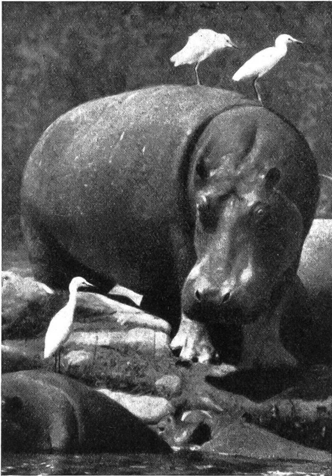
Kuhreiher, auf Nilpferden sitzend.