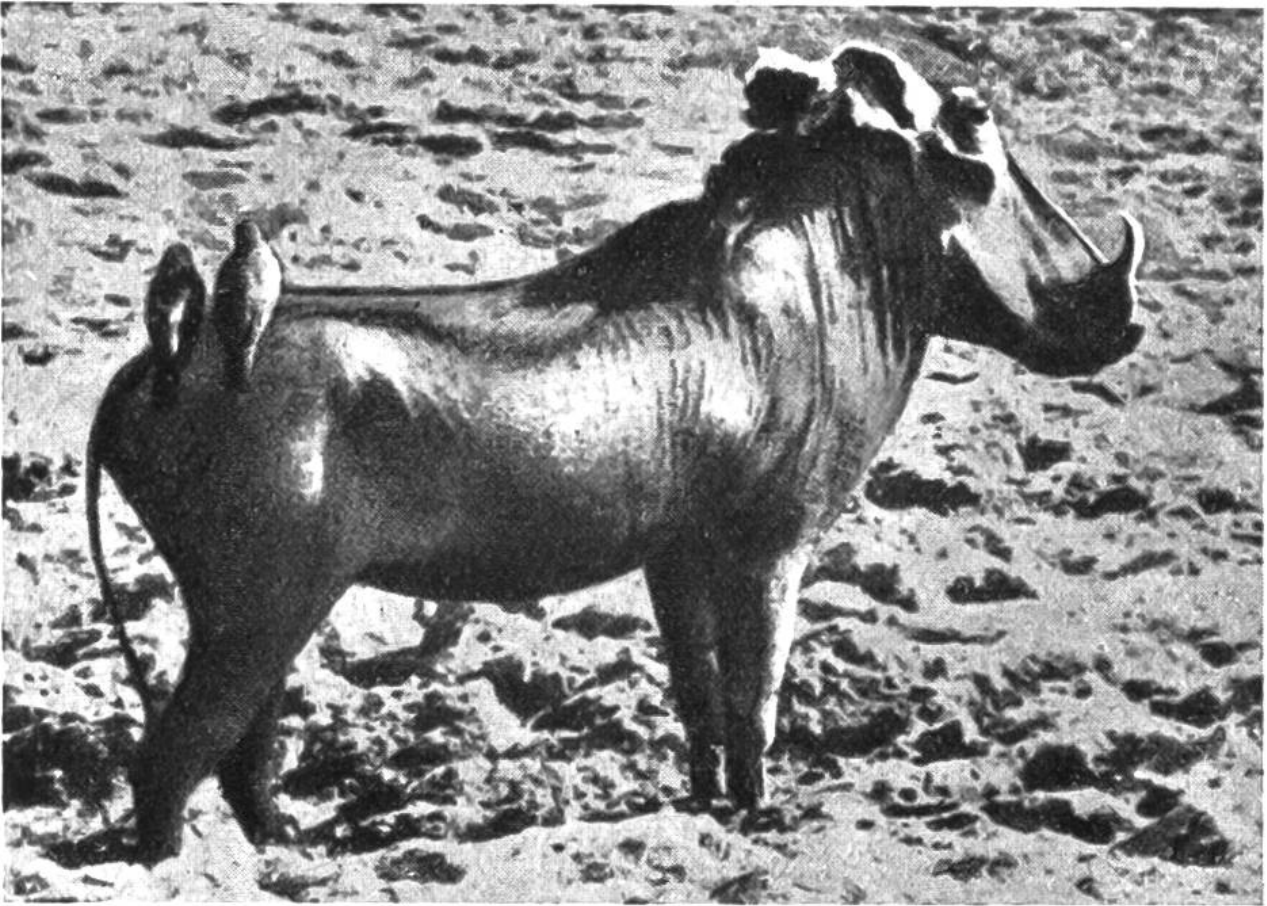
Afrikanisches Warzenschwein mit zwei Madenhackern.

Name andeutet — zu der Gruppe der Reiher, der Madenhacker zu den Staren und der Krokodilwächter zu den Regenpfeifern. Diese drei Arten sind also miteinander gar nicht verwandt, haben aber alle eine gemeinsame Besonderheit in ihrer Lebensweise: sie unterhalten merkwürdige Beziehungen zu verschiedenen Vertretern des afrikanischen Grosswildes und zu einigen Haustieren.