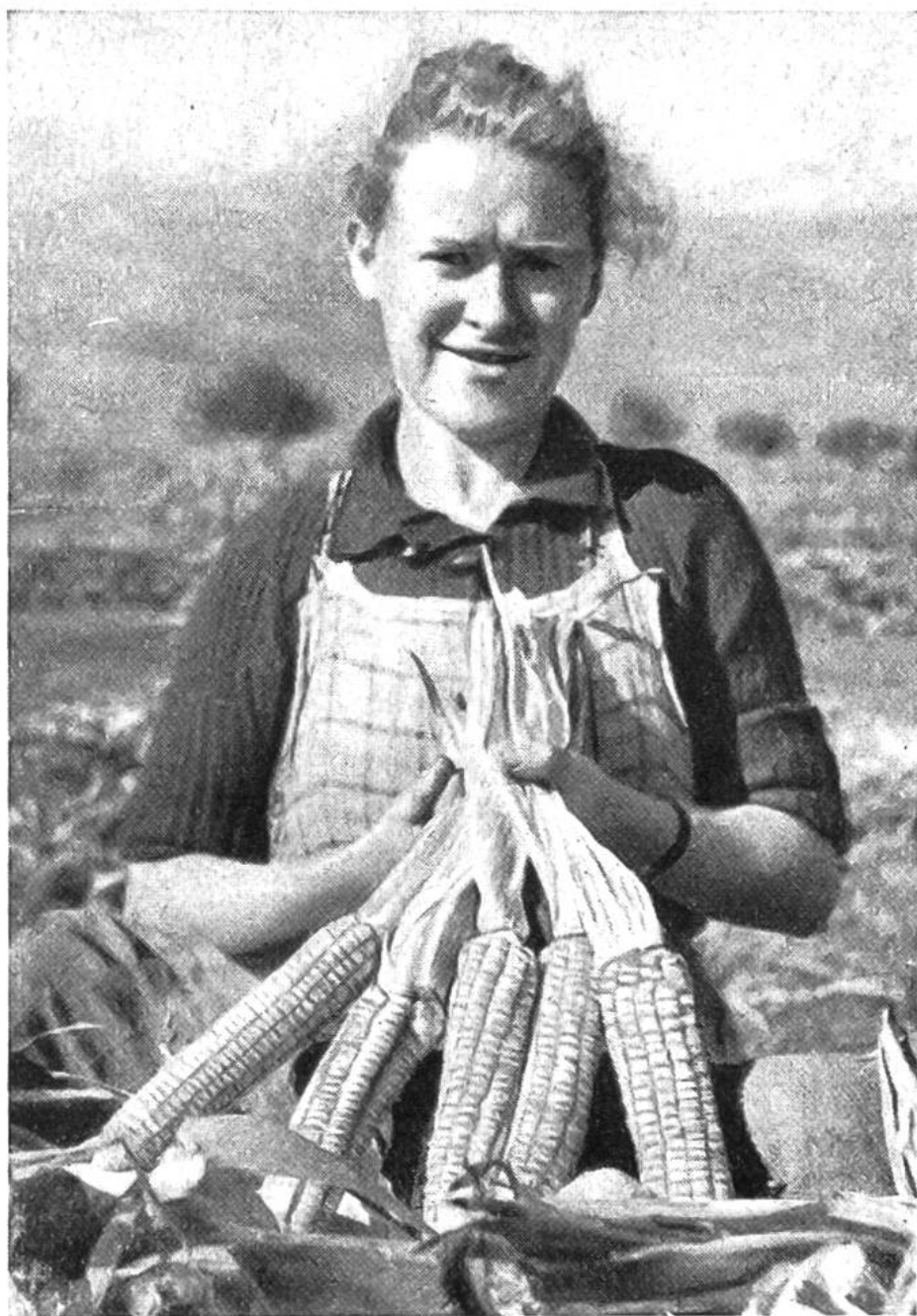
Reife Kolben des achtreihigen weissen Rheintalermaises. Aus dem daraus gewonnenen Mehl backen die Bäuerinnen, unter Verwen- dung von aller- lei schmack- haften Zuta- ten, das nahr- hafte Maisbrot.

weizen nur ca. 25 q pro ha) und der gegenüber andern Getreidearten bedeutend höhere Nährwert aber führten während des jetzigen Krieges zu einer starken Ausdehnung des Anbaus von Körnermais. Im Jahre 1942 wurden bereits 3212 ha gezählt, die sich auf 39 500 Pflanzler verteilten. Daran sind die Kantone Tessin mit 1578 ha, St. Gallen mit 1038 ha, Graubünden mit 150 ha, Wallis mit 109 ha und Schwyz mit 100 ha beteiligt. Der Rest verteilt sich auf alle übrigen Kantone.